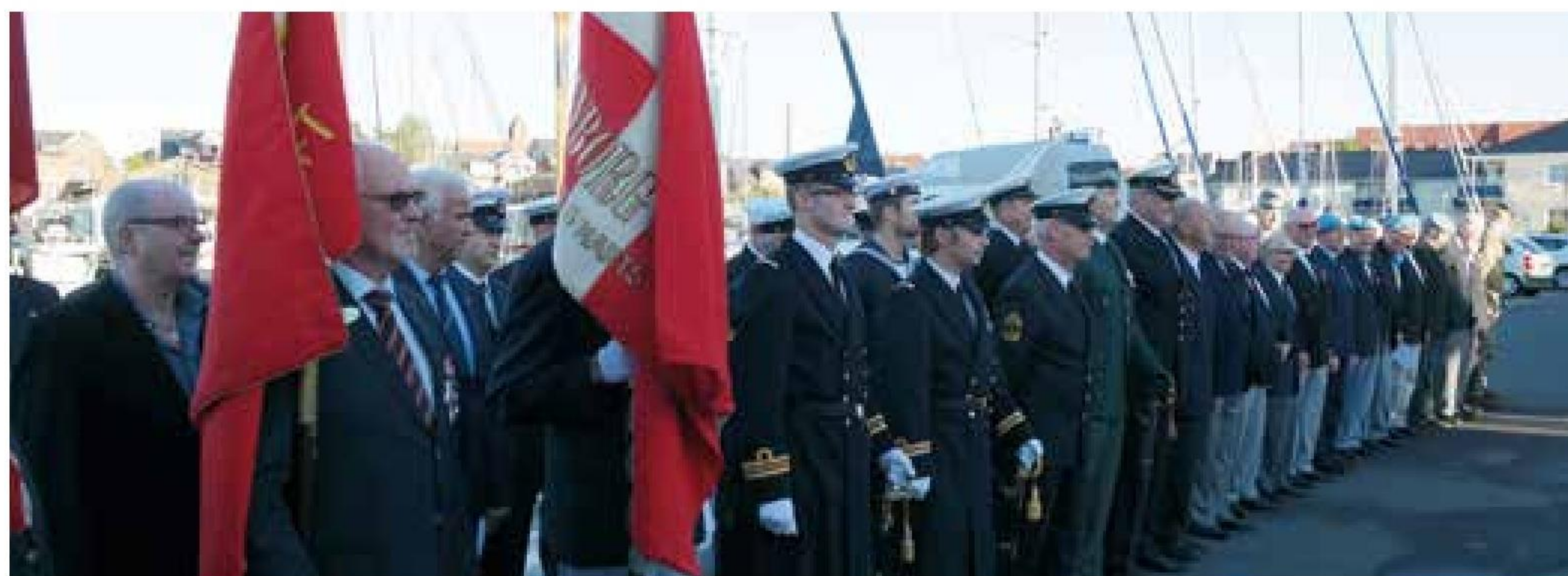
▲ Nyborg Kommune og Nyborg Marineforening stillede med en flot flag parade ved markeringen af Den Nationale Flagdag.