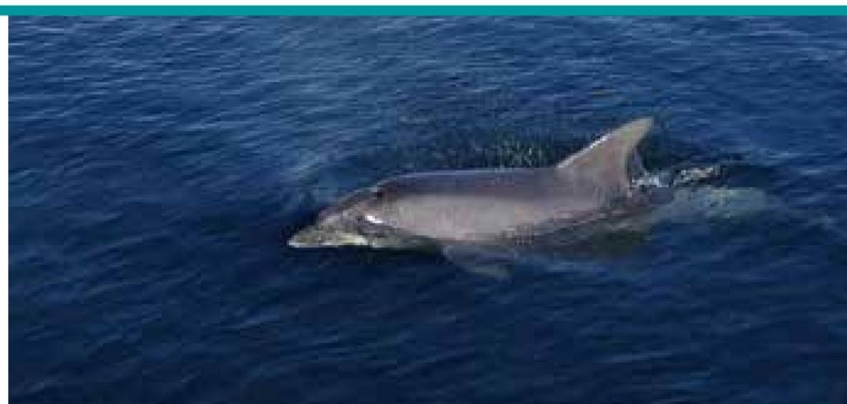
▲ Denne omstrejfende Delfin skabte stor begejstring for iagttagerne, da den over flere dage kom tæt under land ud for Marinehuset på Sildemarken i Middelfart.

Afdelingen havde den 6. september sæsonstart med 20 del-