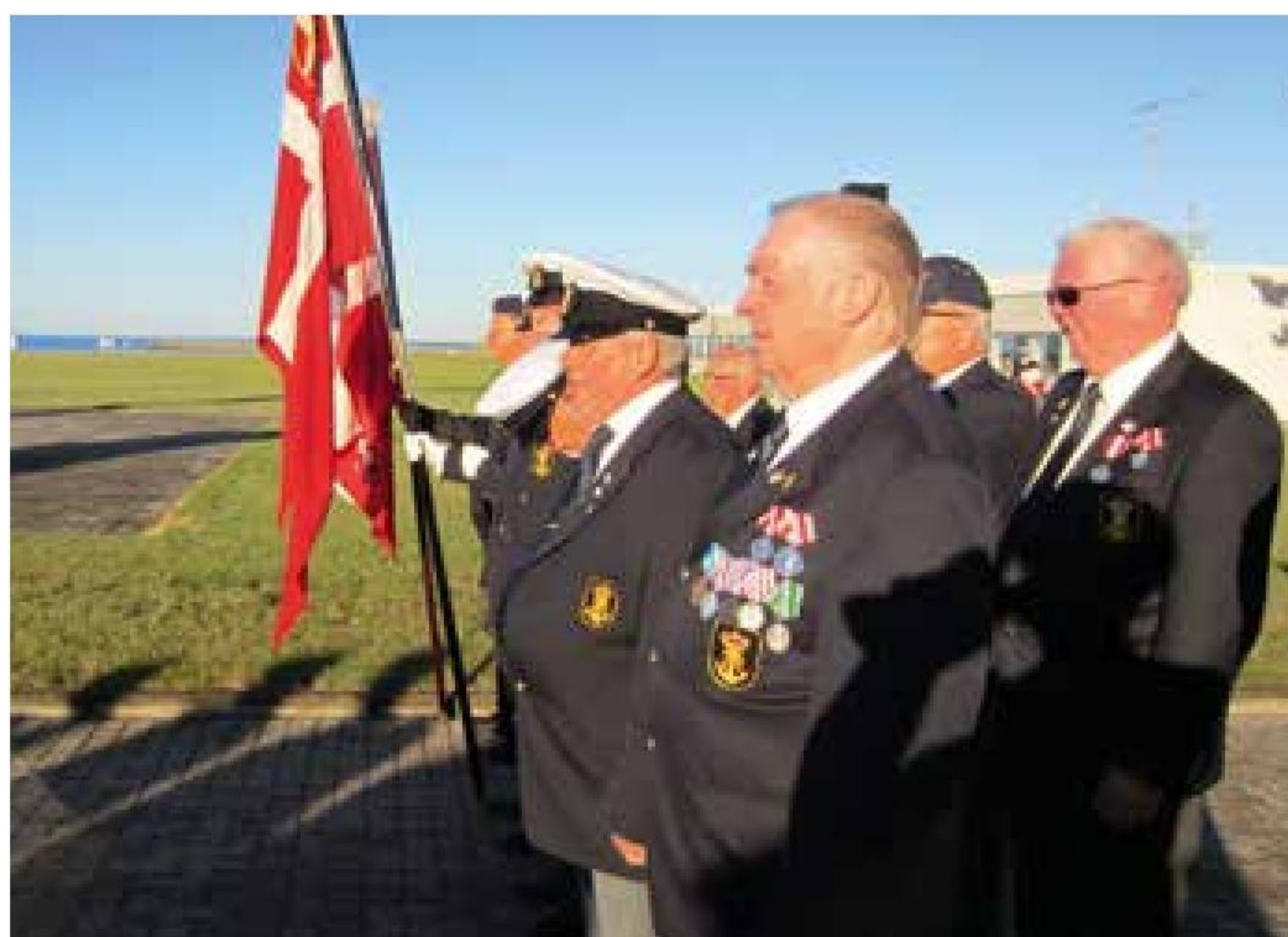
▲ Folk og flag fra Korsør Marineforening ved Den Nationale Flagdag på Flådestation Korsør.

Vinterperioden byder på diverse juleaktiviteter samt nytårsmønstring, torskegilde med skydning til MUGGEN, distriktsmøde den 10. februar og generalforsamling den 25. februar 2017. ■