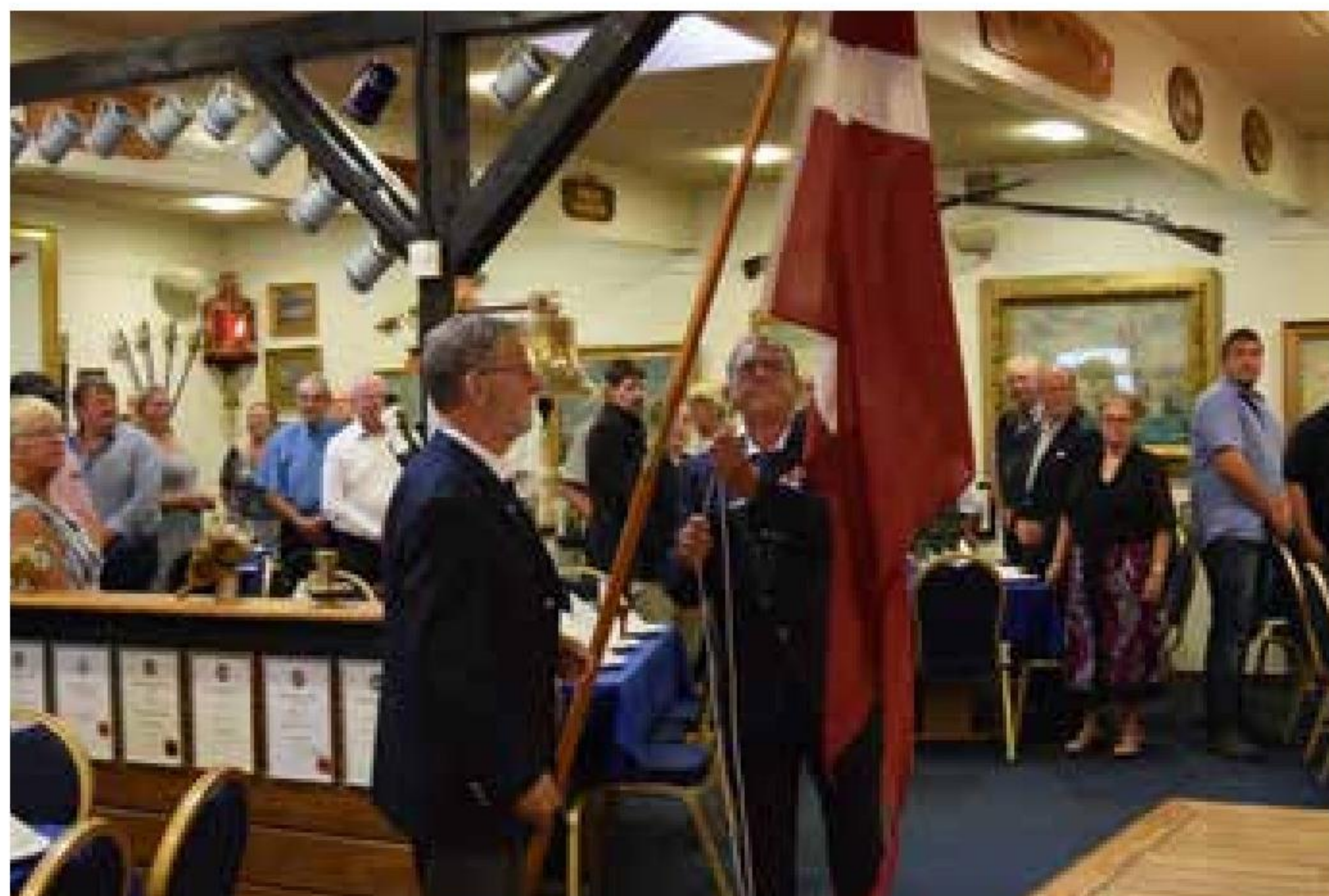
▲ Flaghejsning inden august åleskafningen i Skagen Marineforening.