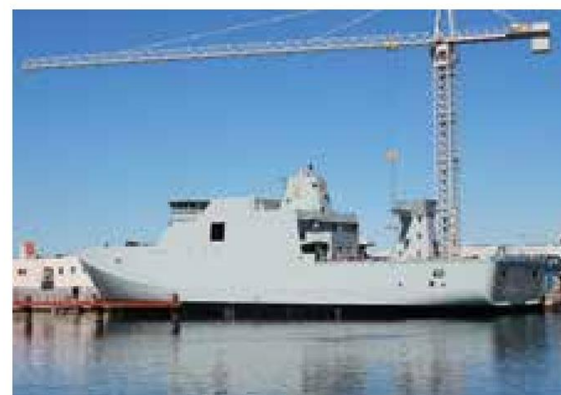
▲ Inspektionsfartøjet LAUGE KOCH ved Karstensens Skibsværft i Skagen.