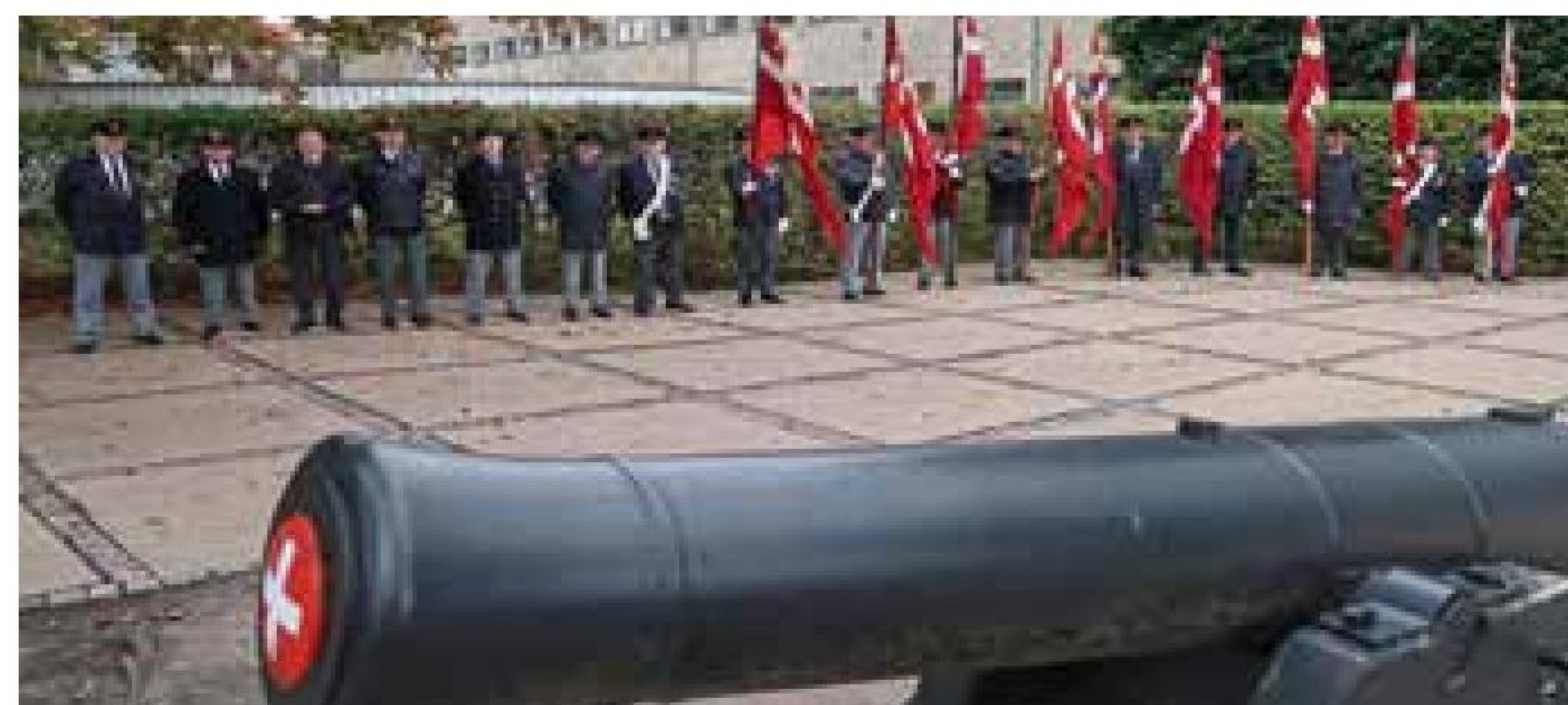
▲ Danmarks Marineforenings ni flag og flaggaster opstillet ved indgangen til Søværnets Officersskole, hvor aulaen dannede ramme om afskedsceremonien for skoleskibene.