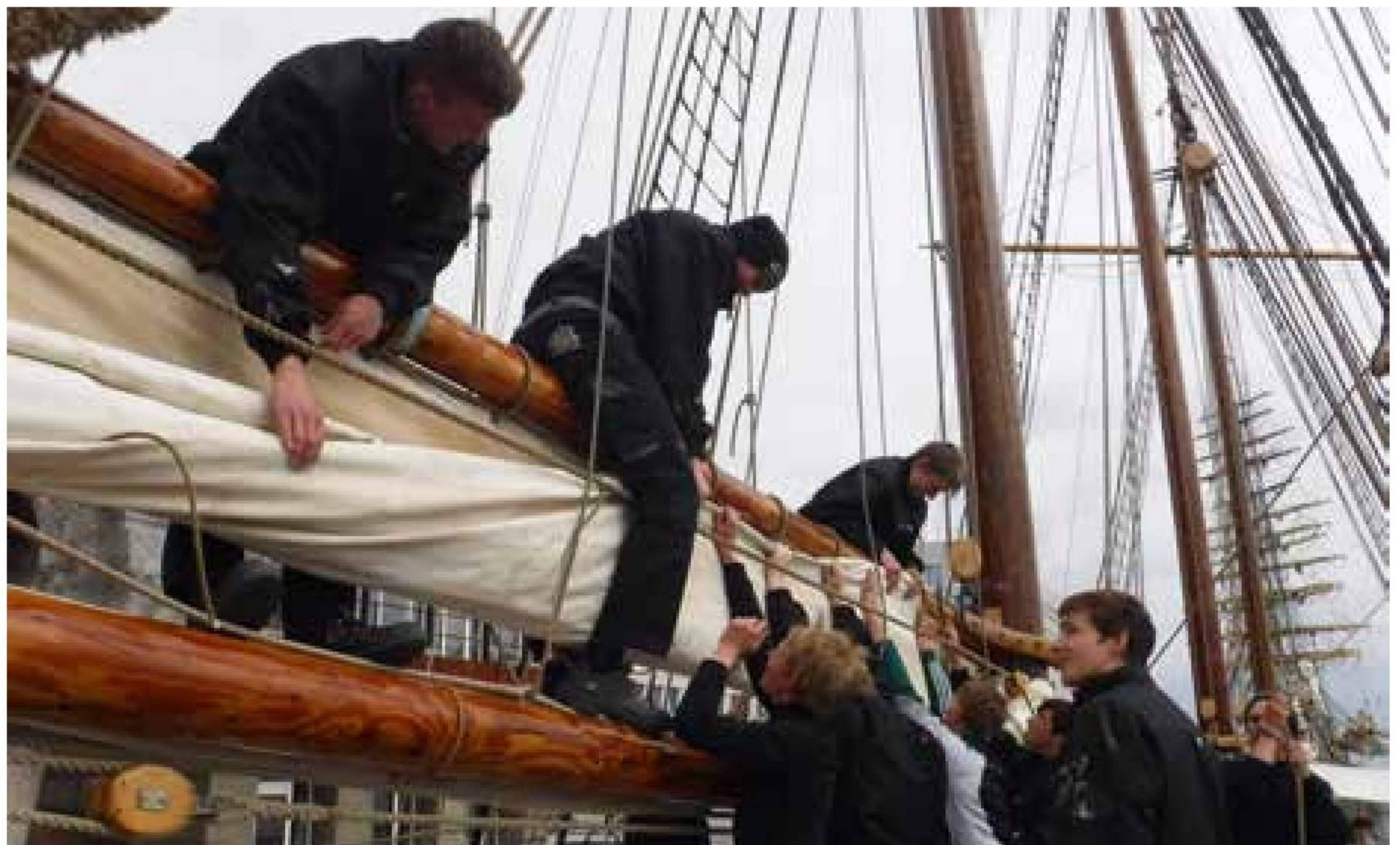
▲ Sejlene slås under.

holdte danske træskibe under dansk flag, "Marilyn Anne" af Struer. ■