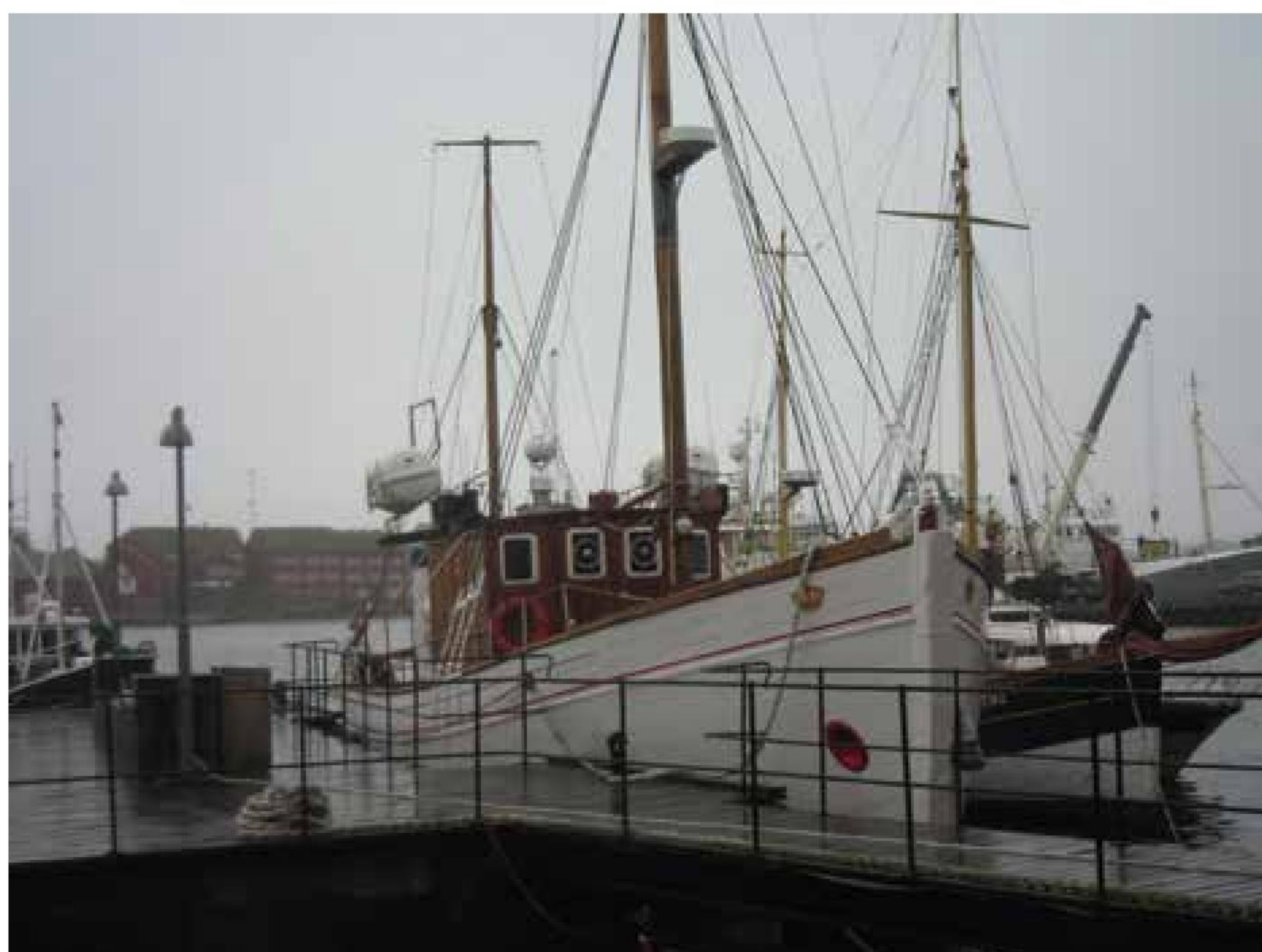
▲ ”Thorshavn” ved kaj i Tórshavn. I baggrunden parlamentsbygningen Tinganes.