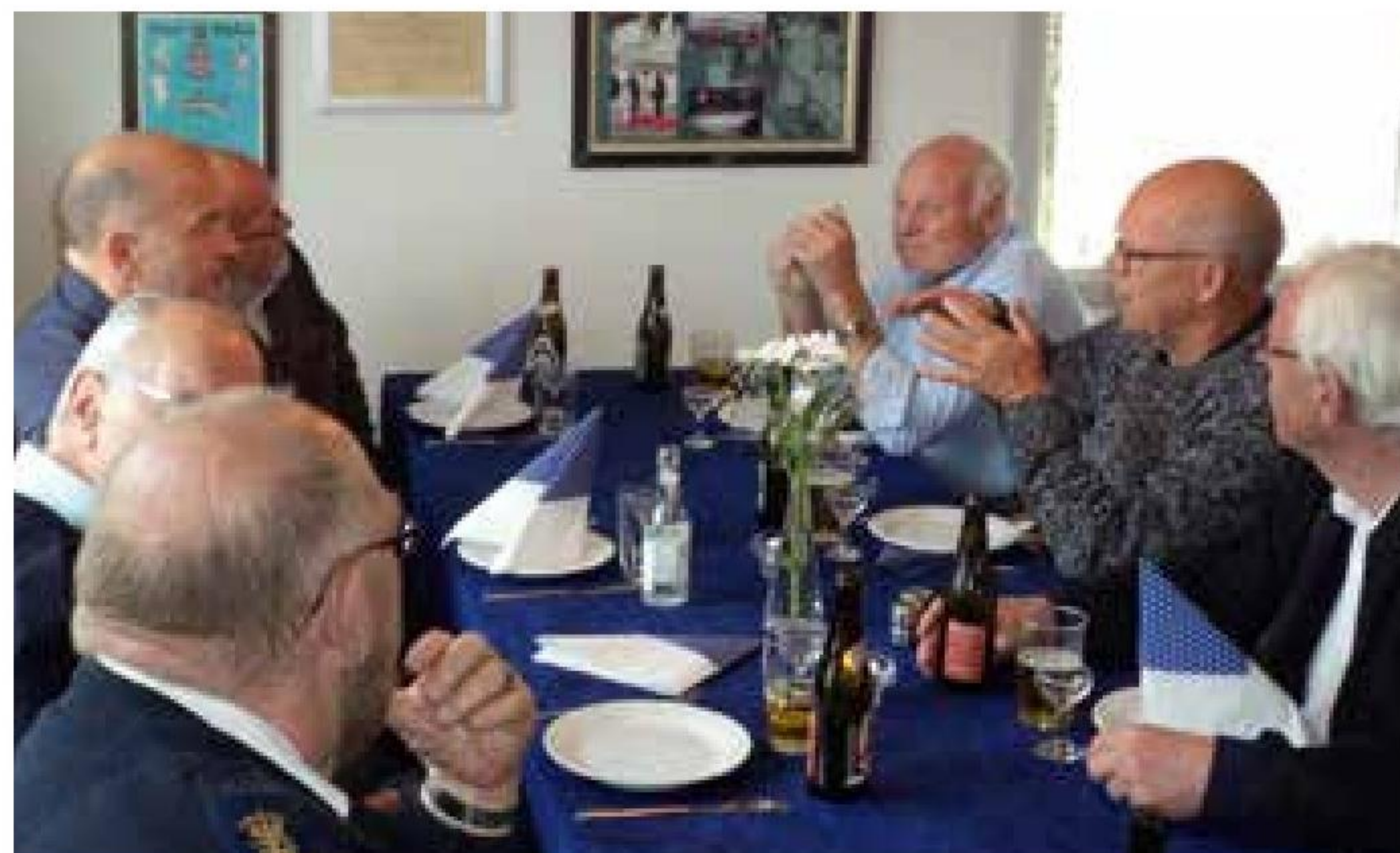
▲ Efter pokalskydningen i Skive var der skafning for de slagne skytter fra skyttelavet i Hanstholm/Thisted.

13 skytter deltog den 9. oktober i den årlige pokalskyd-