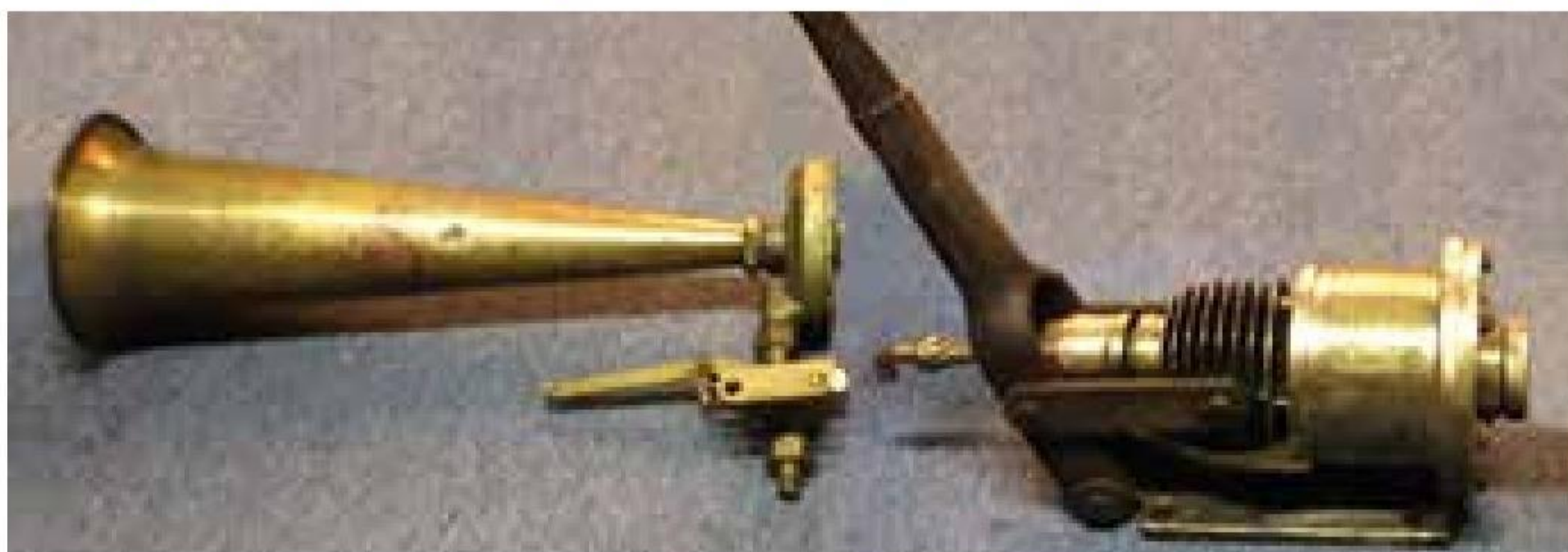
▲ Tågehornet i Skagen Marineforening skal fremover anvendes til afgivelse af lukkesignal ved søndagsarrangementerne i marinehuset.