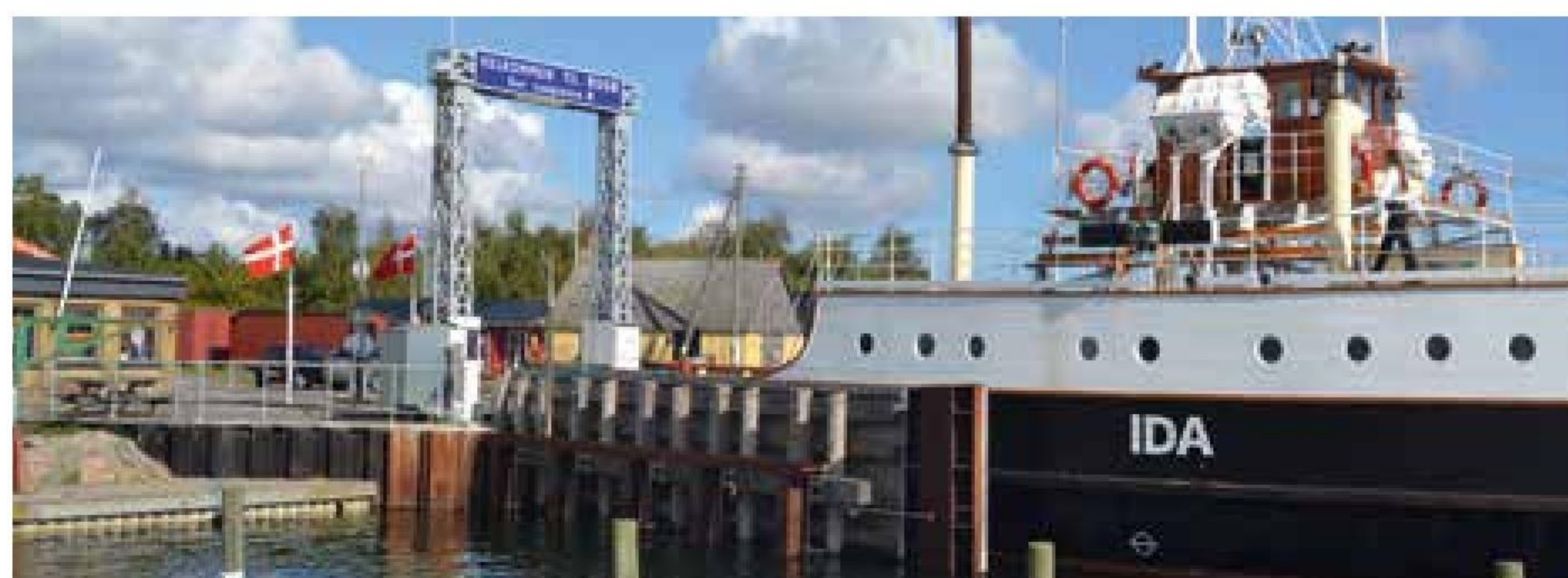
▲ "Ida" ved færgeløjet på Bogø.

Bogø-Stubbekøbing-overfarten opretholdes som sommerfærge af museale hensyn og for at give en genvej for cyklister fra Kalvehave/