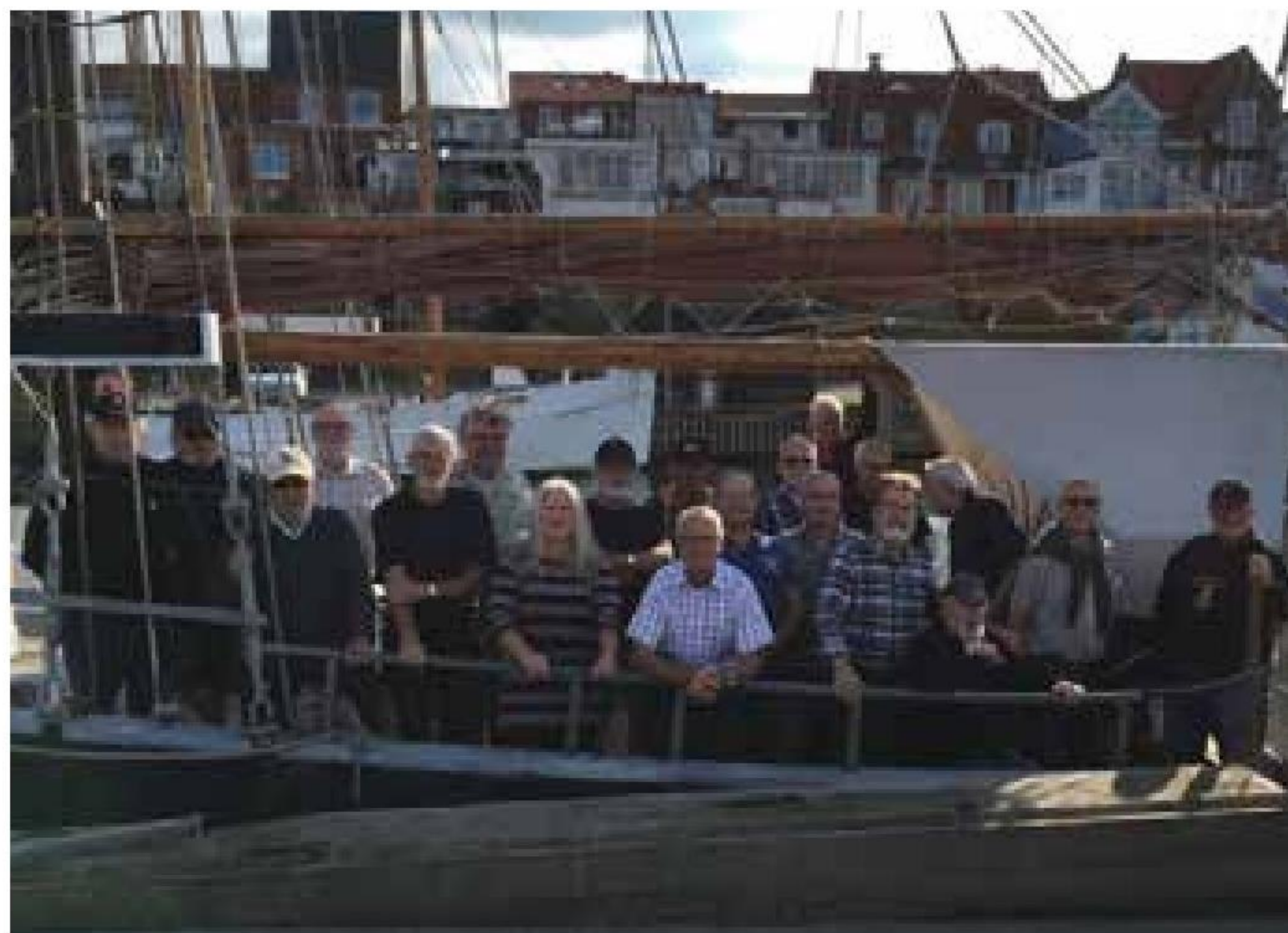
▲ Middelfart Marineforening startede sæson 2016/2017 med sensommertur om bord på Galeasen "Aventura".