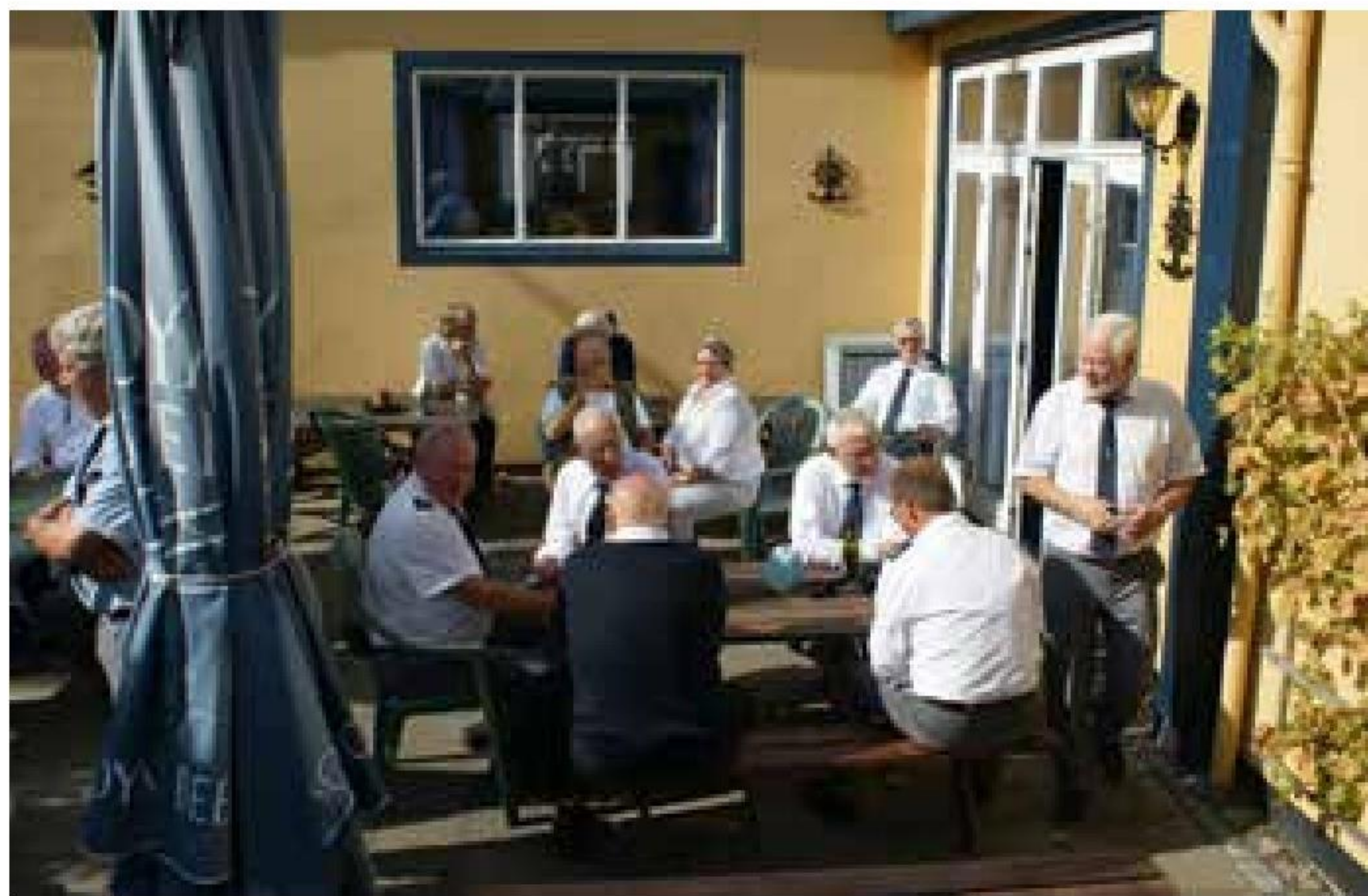
▲ Den smukke gårdhave ved marinehuset i Ebeltoft er altid god for læ og hyggesnak under de mange arrangementer i Ebeltoft Marineforening.