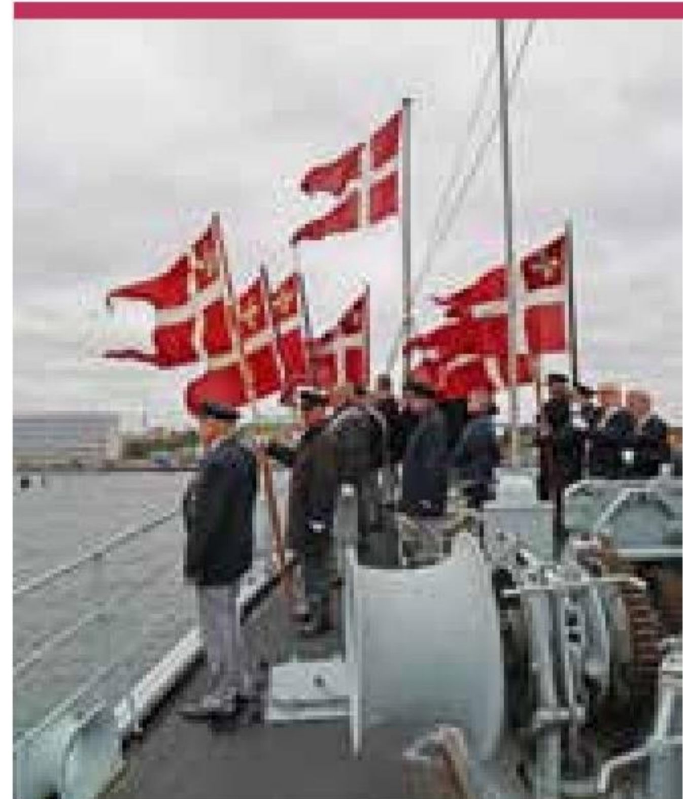
▲ Flagparaden klar ved gøsen på museumsfregatten PEDER SKRAM.