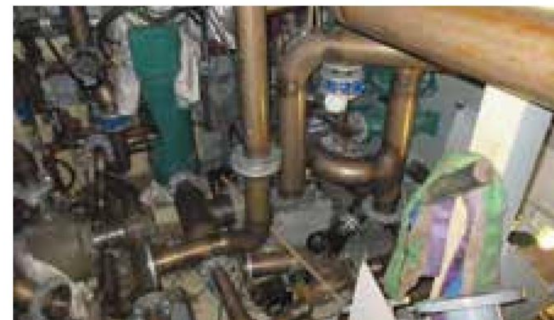
▲ Mange af de skibstekniske installationer er på plads, men først ved årsskiftet 2017/2018 er LAUGE KOCH klar til indsættelse ved Grønland.

Geographical Society. Lauge Koch ligger begravet på Hørsholm Kirkegård. ■