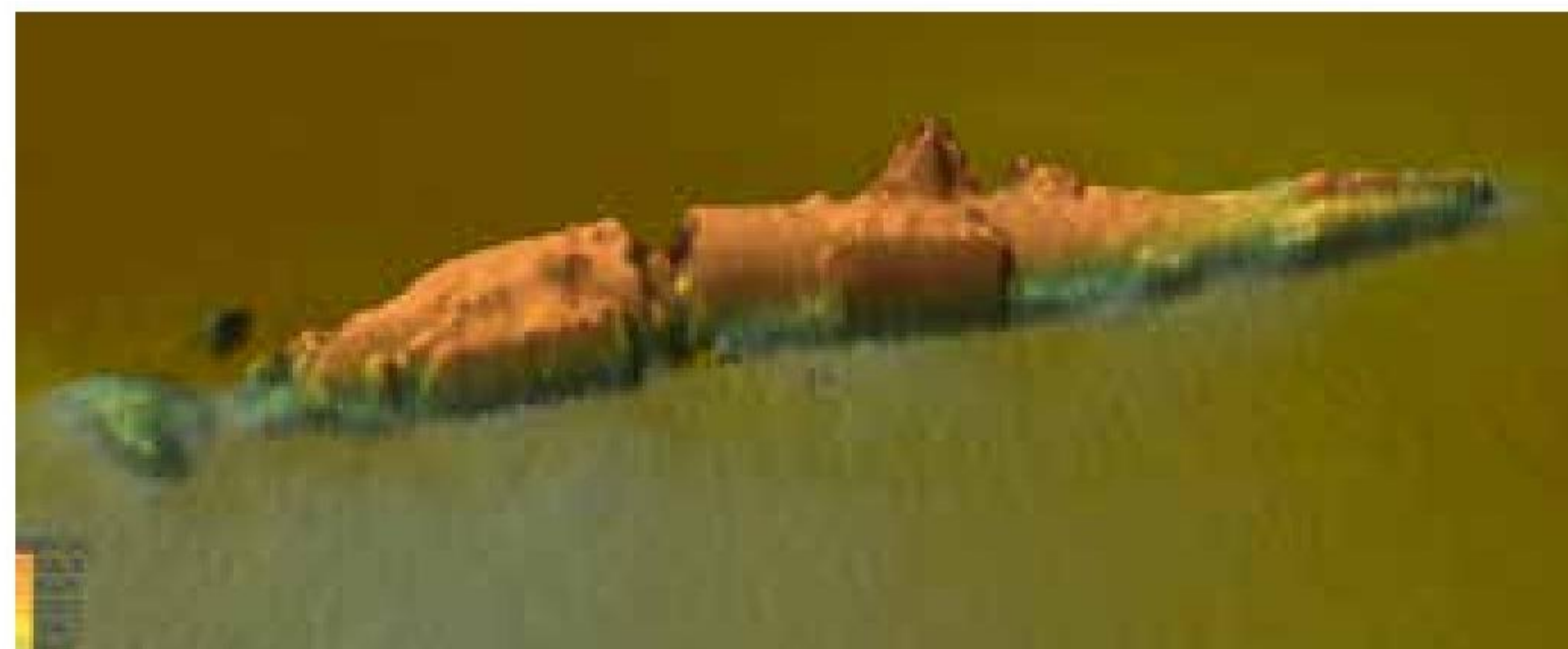
▲ En scanning af UC30 på 20 meter vand i sejlrenden Slugen ved Horns Rev. Det ses tydeligt, at ubåden er knækket over agter for tårnet.

Vraget indeholder stadig 18 sprængfarlige miner og 6 torpedoer. Vraget er afmærket og af Søfartsstyrelsen foreløbig gjort til forbudsområde. ■