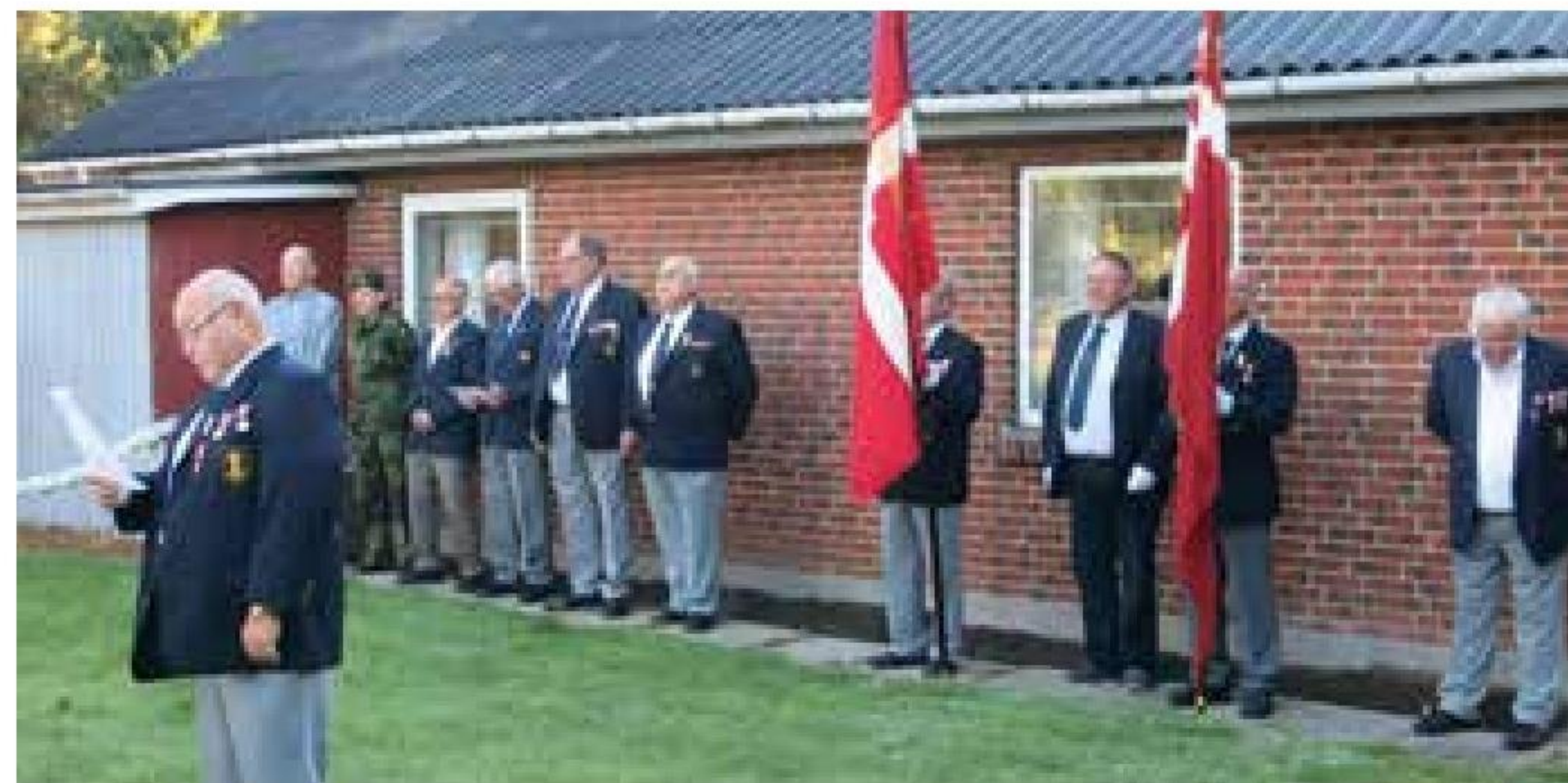
▲ Repræsentanter fra Hjørring Marineforening og De Danske Forsvarsbrødre under morgenflaghejsningen den 5. september ved Marinehuset.

Sidst i september deltog repræsentanter fra afdelingen i distriktsmødet, der blev afholdt i marinestuen i Hals.