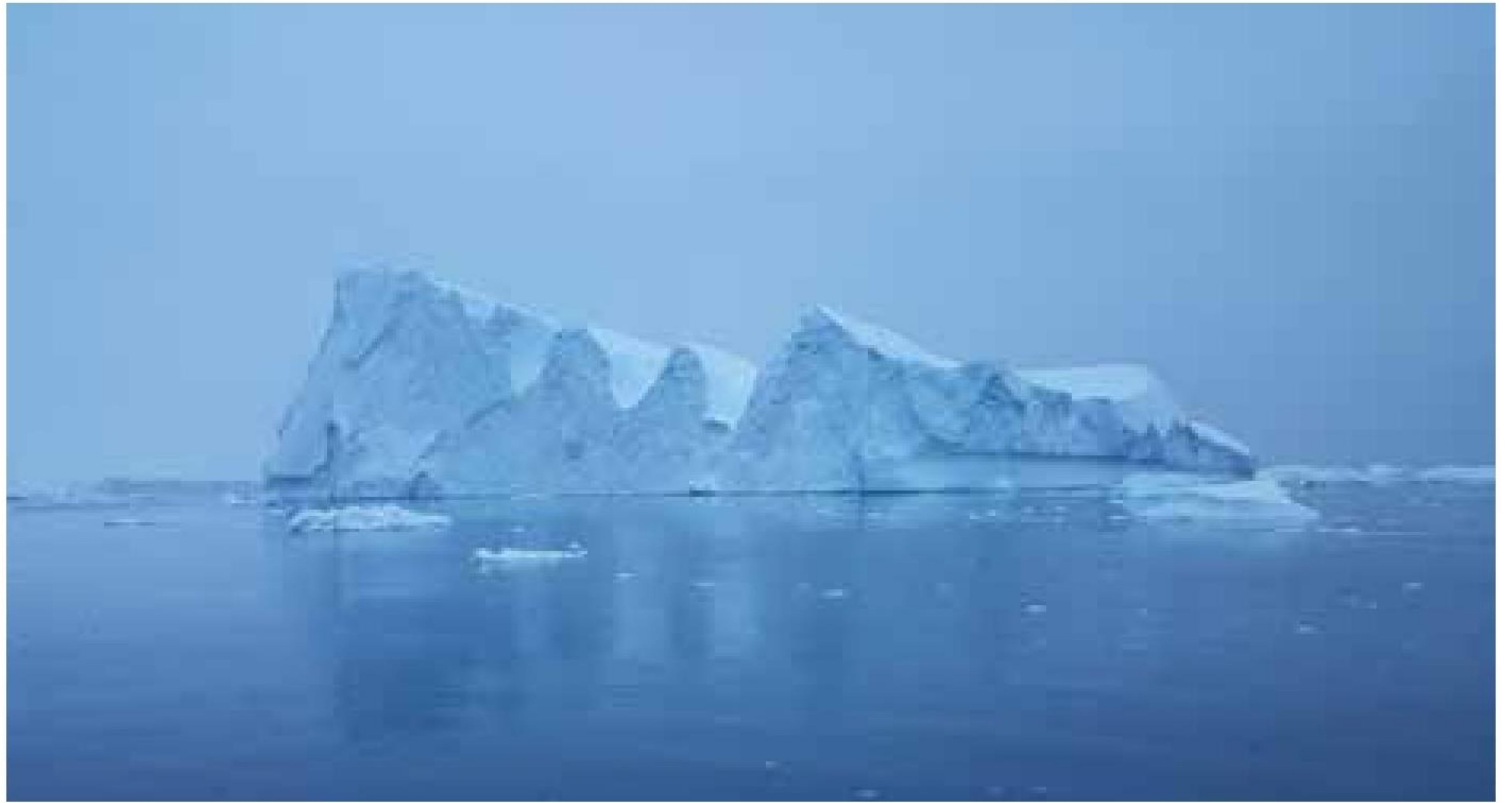
▲ Isfjeld i en grønlandsk fjord. Smukt.

Vores værter fra Godthåb Marineforening tog imod os i lufthavnen og gjorde alt for at sikre os de absolut bedste oplevelser. Intet var umuligt. Besøg i Landstinget. Rådhuset med den smukke byrådssal, ja, selv Lars Emil Johansens domicil på 12. sal kunne åbnes for os. Ud at fiske -selvfølgelig. Op at flyve i en vandflyver og lande i en smuk bjergsø – intet problem. En af-tentur ind i den smukke fjord i en stor luk-