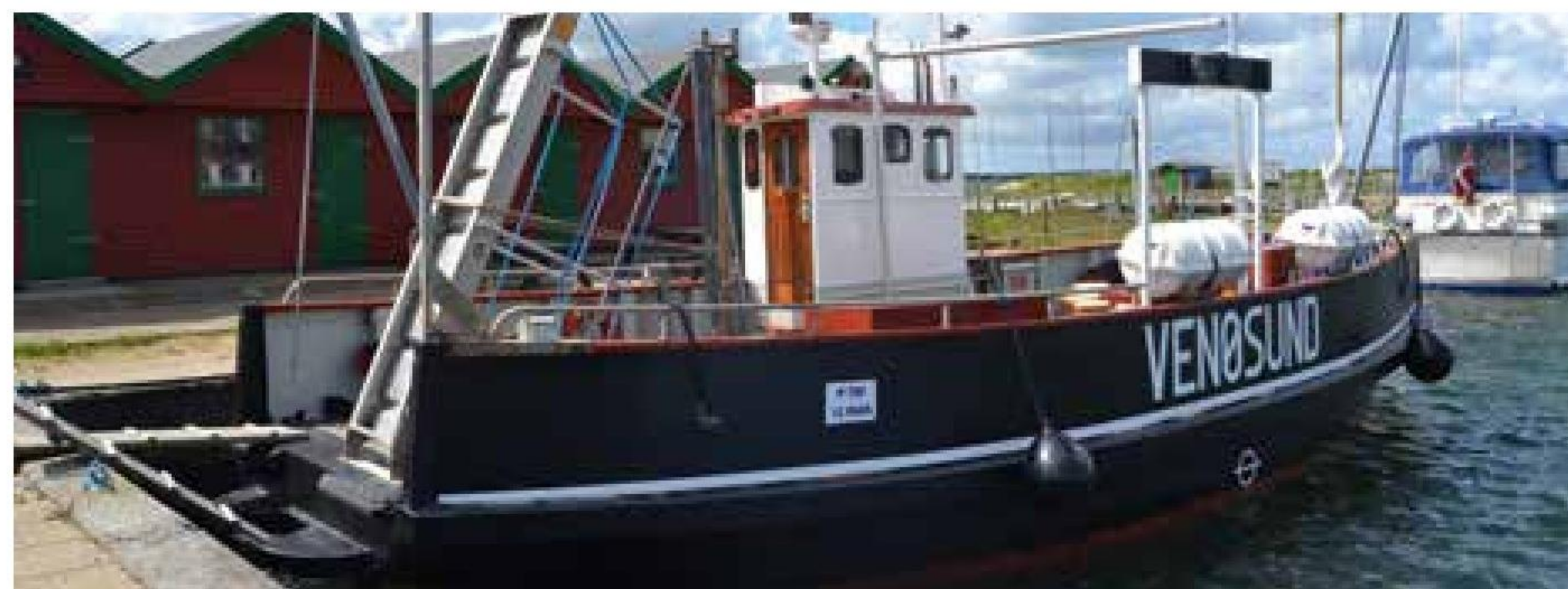
▲ "Venøsund" på sin faste plads i færgehavnen på Venø. Fiskerhusene i baggrunden huser en permanent udstilling om færgeoverfarten.