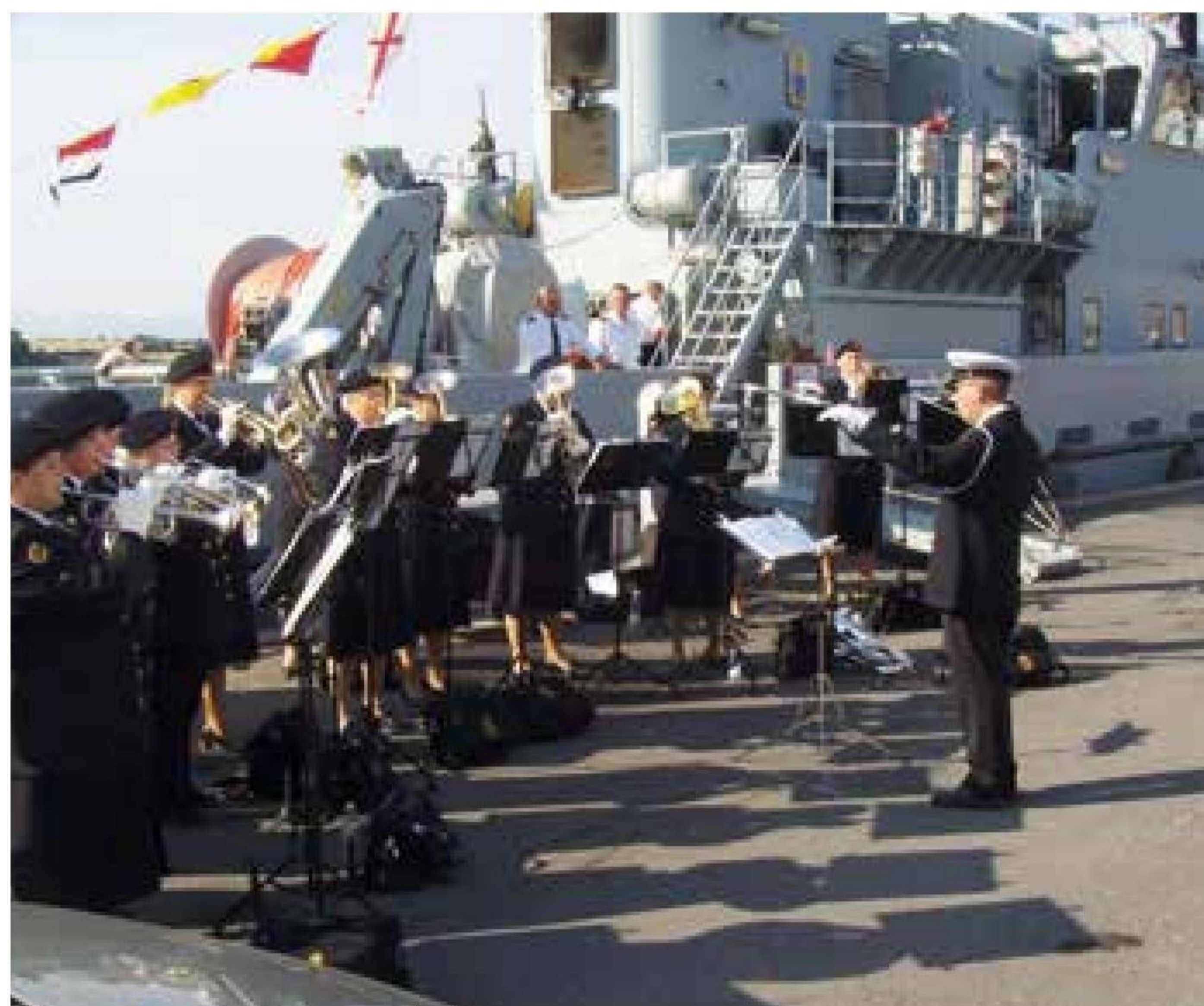
▲ Kvindelige Marineres Musikkorps underholder under Åbent Skib eventen under adoptionsbesøget i Faaborg.

Midtfyn Kommune's adoptionskib patruljefartøjet P521 FREJA den 16. september anduede Faaborg Havn for et officiel besøg. Inden Tamburkorpsets velkomstkonzert på havnen havde musikerne været til skafning i marinstuen, og givet koncert på bytorvet.