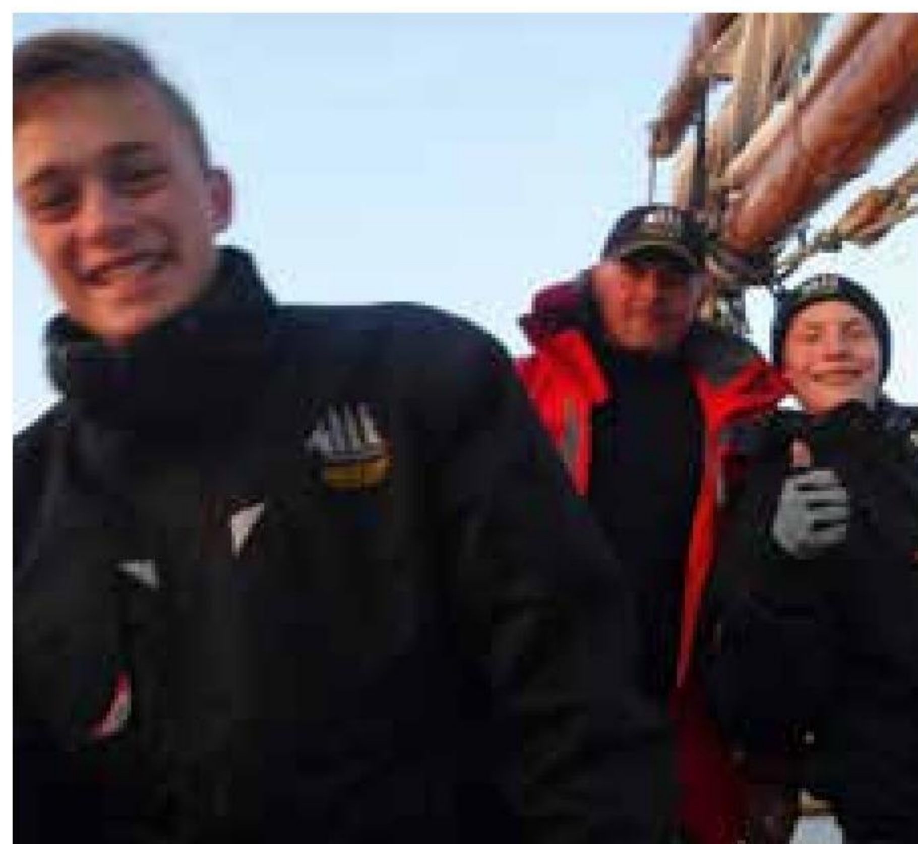
▲ Der er god kemi mellem skipper og elever.

København byder på lange byvandring, hvor vi prøver at vise eleverne andet end de typiske turistmål. Vi kigger ind i de mange gårde, hvor der stadig er bindingsværksbygninger, og der er cirka 14 kilometer rundt langs de gamle volde med masser af historier. Klippeøen i Østersøen er naturligvis også interessant. Bornholm er jo lavet af et noget hårdere materiale end resten af landet, og der bli-