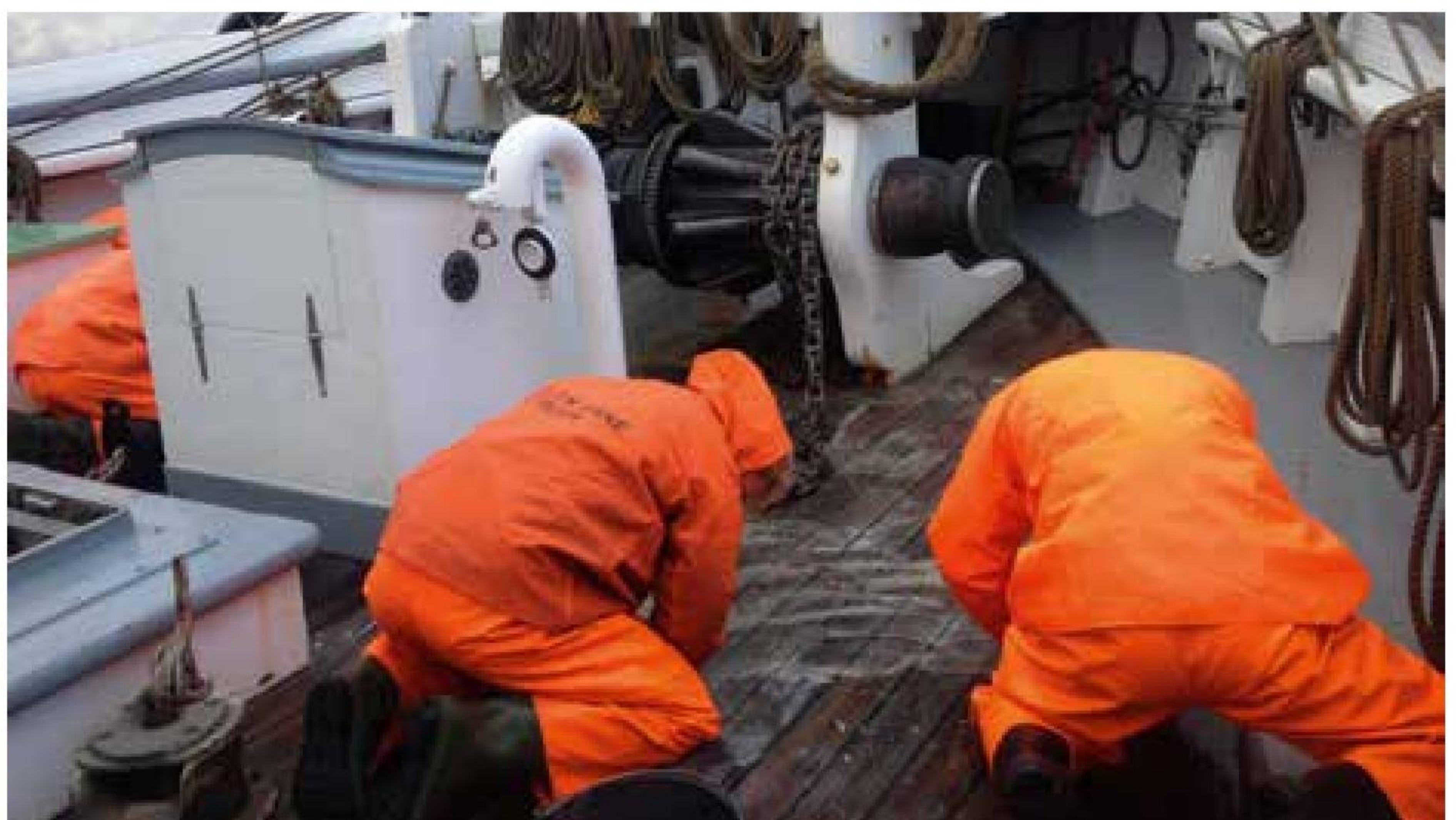
▲ Hårdt, men nødvendigt dæksarbejde en grå efterårsdag på havet.