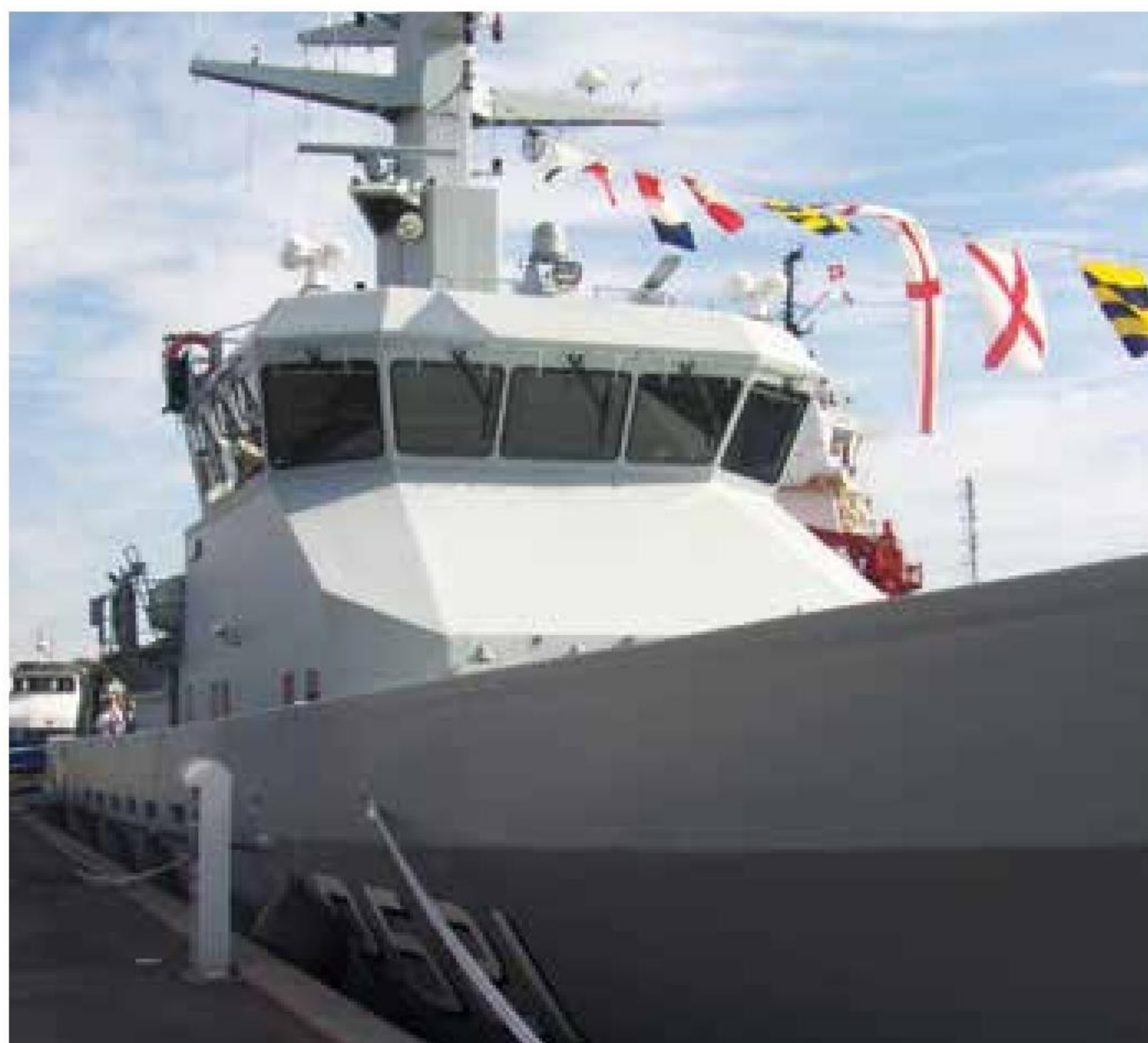
▲ Patruljefartøjet FREJA ved kaj i Faaborg.

Der var "Dansk Løsen" fra Faaborg Kanonerlaug og velkomstmusik leveret af Søværnets Tamburkorps da Faaborg-