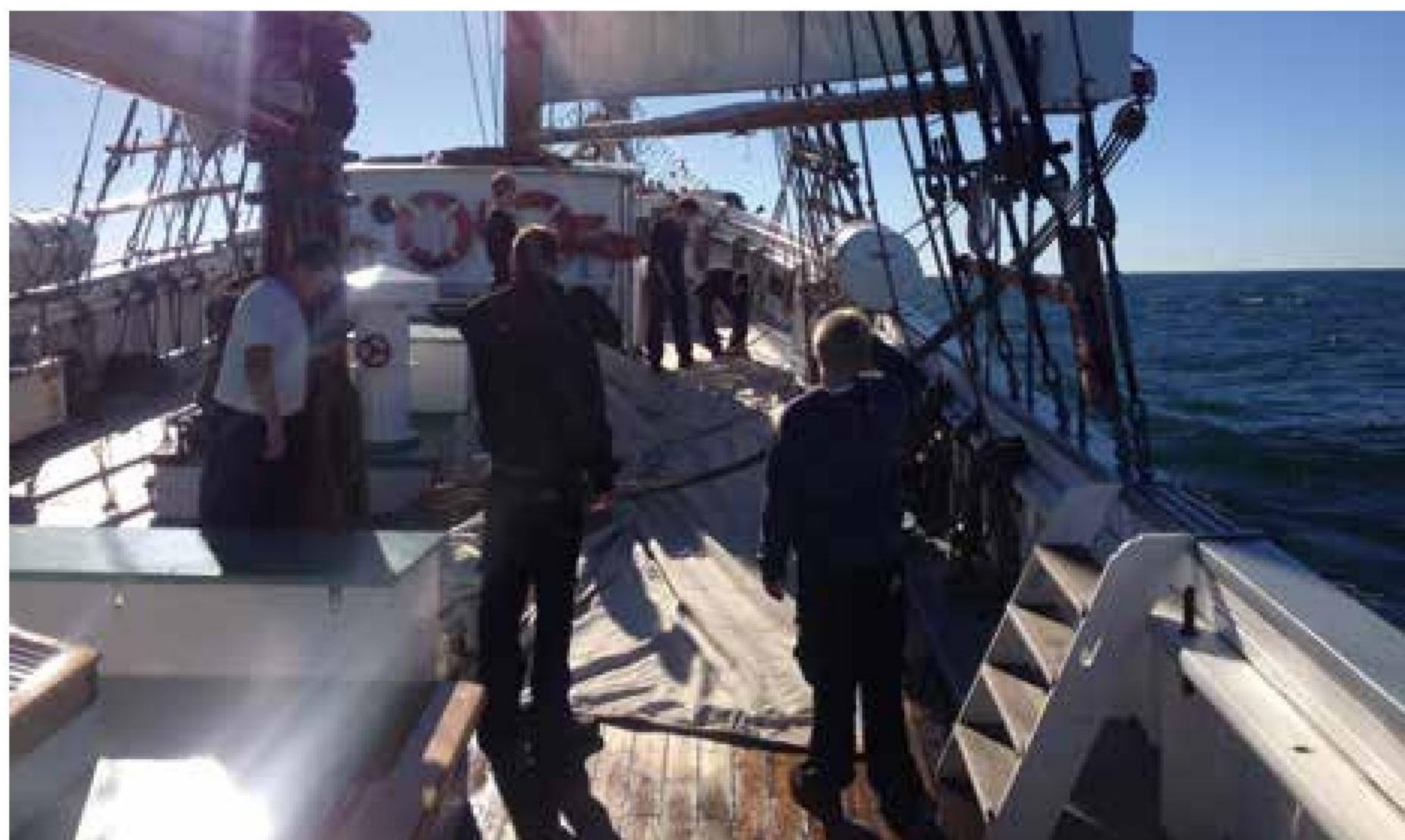
▲ Sejlene skal pakkes korrekt.

Det er også om vinteren, at læreren har de bedste arbejdsvilkår. Skolestuen vipper og gynger ikke, og derfor er søsyge i undervisningen ikke-eksisterende til stor glæde for alle parter.