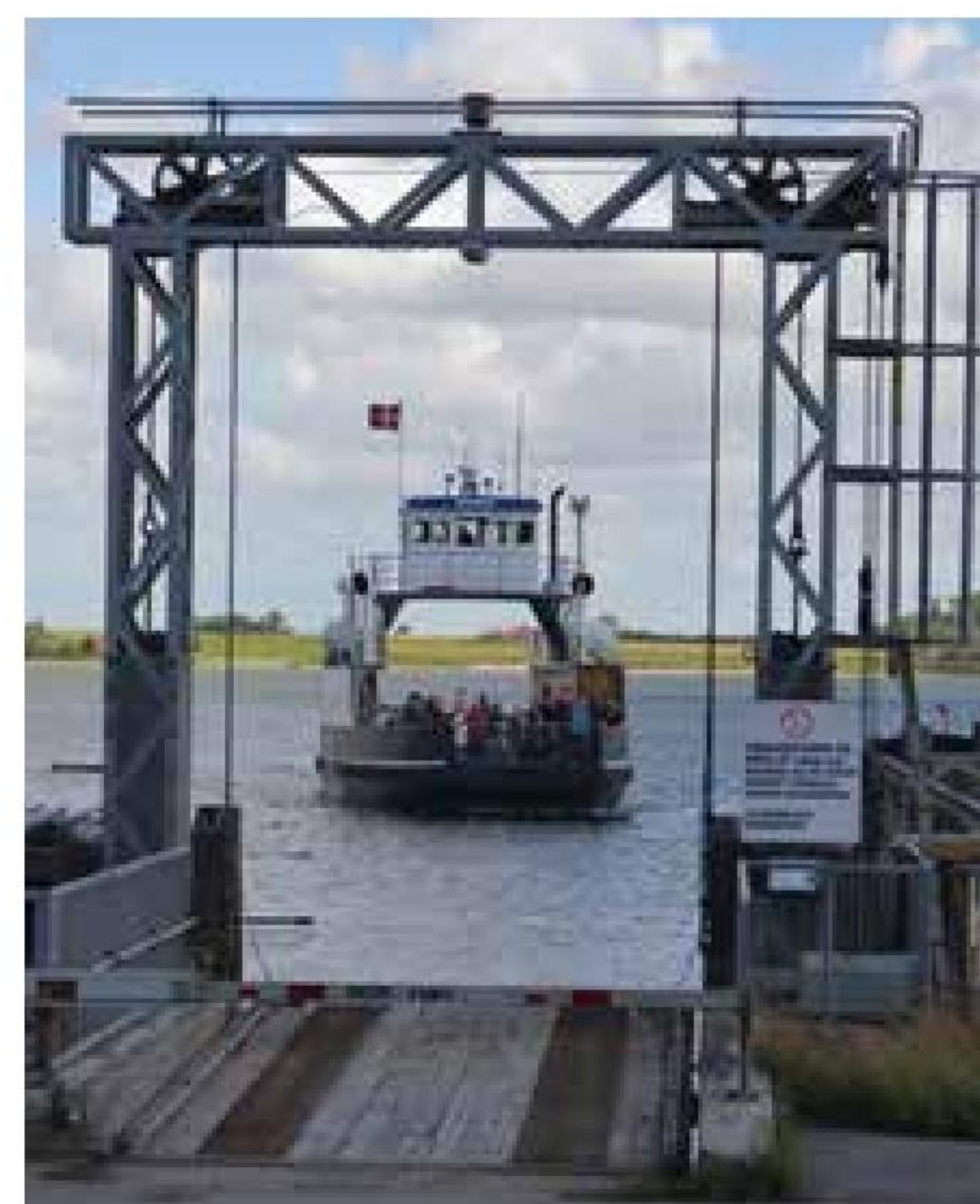
▲ Efter ét år, fire måneder og to dage er der igen færgeankomst fra Vestmors til Thysiden af Nees Sund. Billedet er taget den 30. juni 2016, dagen før færgeruten åbnede i det nye foreningsregi.