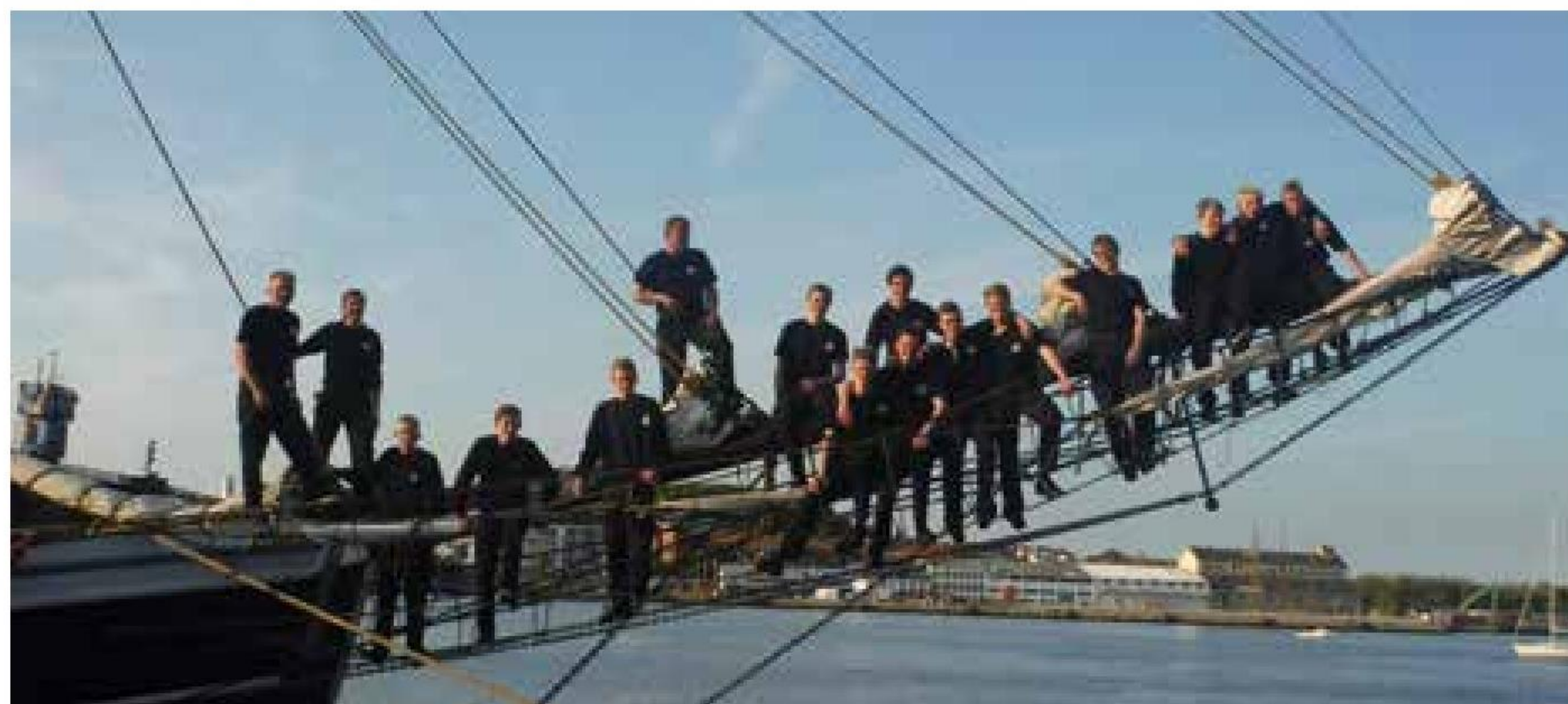
▲ Parade på bovsprydet.