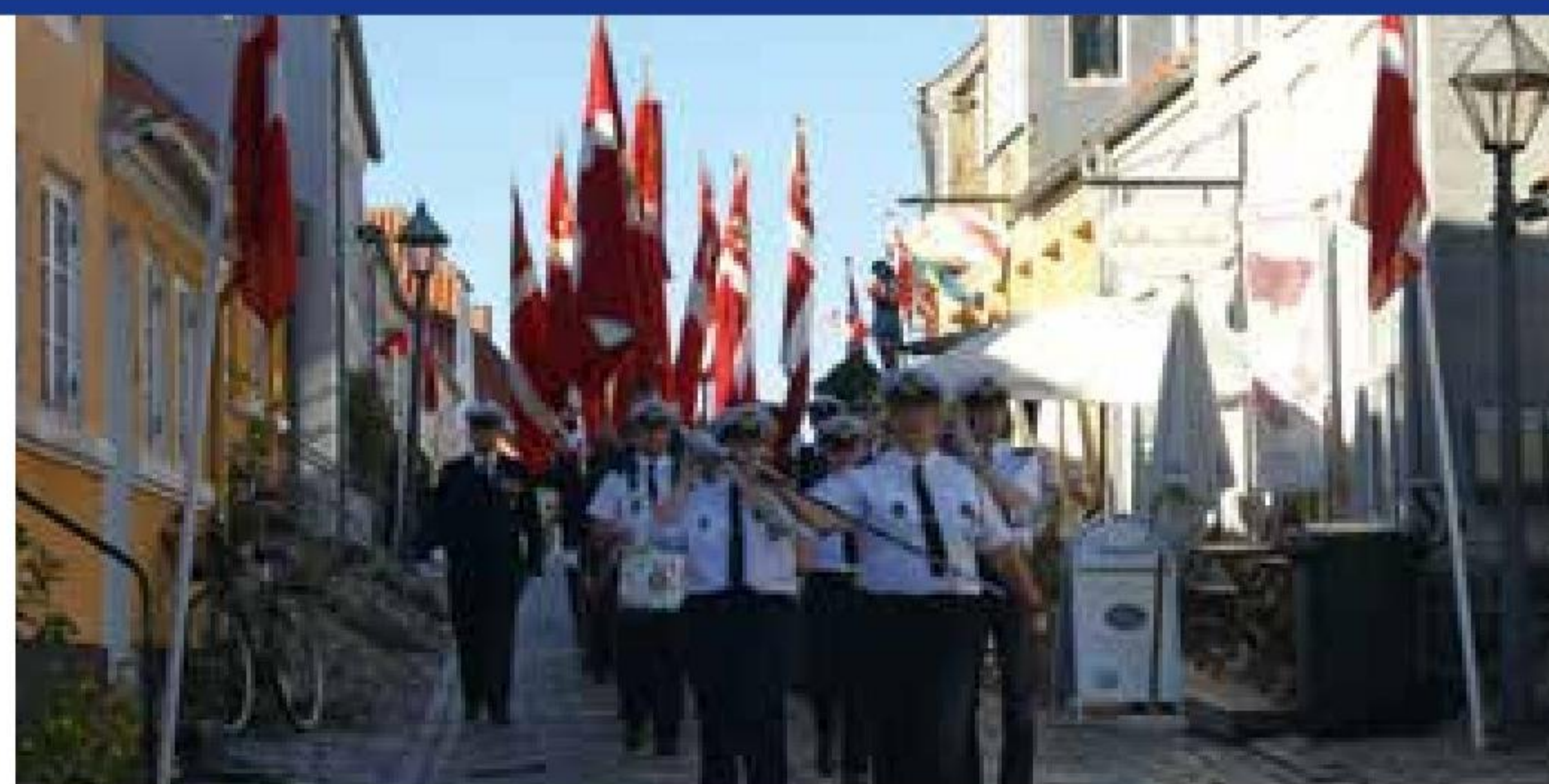
▲ Marinehjemmeværnets Musik- og Tambourkorps fra Randers i front for marchen under Den Nationale Flagdag i Ebeltoft.

Afdelingen deltog med flag og gaster i Den Nationale Flagdags arrangementer i såvel Grenaa som Ebeltoft. I Grenaa var der højtidelighed om mor-