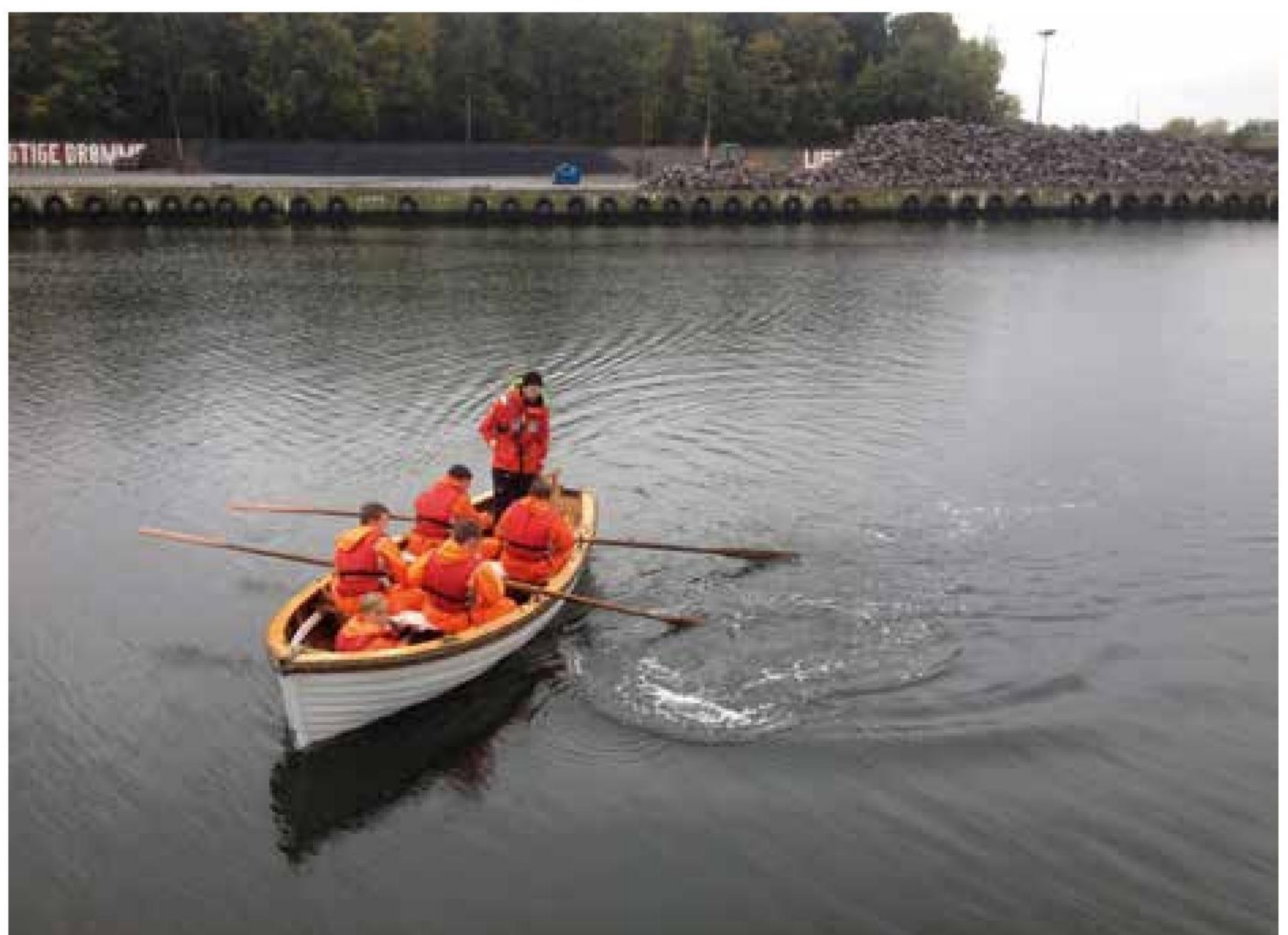
▲ Uge 42 2016 Odense Havn. Der trænes basal roteknik.

Hvis man eksempelvis ikke får ordnet sine ting i undervisningen, fordi man ikke lige gider, er man nødt til at blive ombord og få det ordnet om aftenen, da man jo ellers er bagefter, når skolen starter op igen. Det samme gælder ved det praktiske arbejde. Tingene skal være i orden, inden man går i land. Vi siger, at ”ingen er færdige, før alle er færdige”, og så kan konsekvensen være, at ►