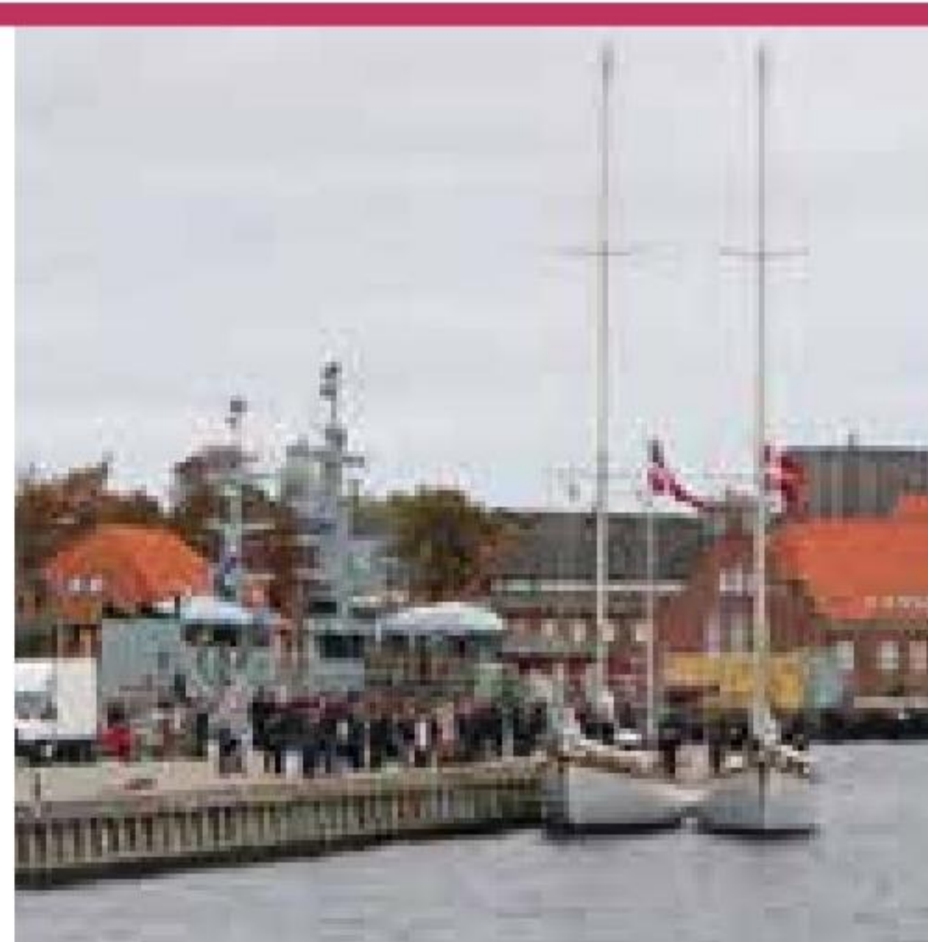
▲ THYRA og SVANEN er bound for Biscayen, Madeira, De Kanariske Øer, Caribien og USA.