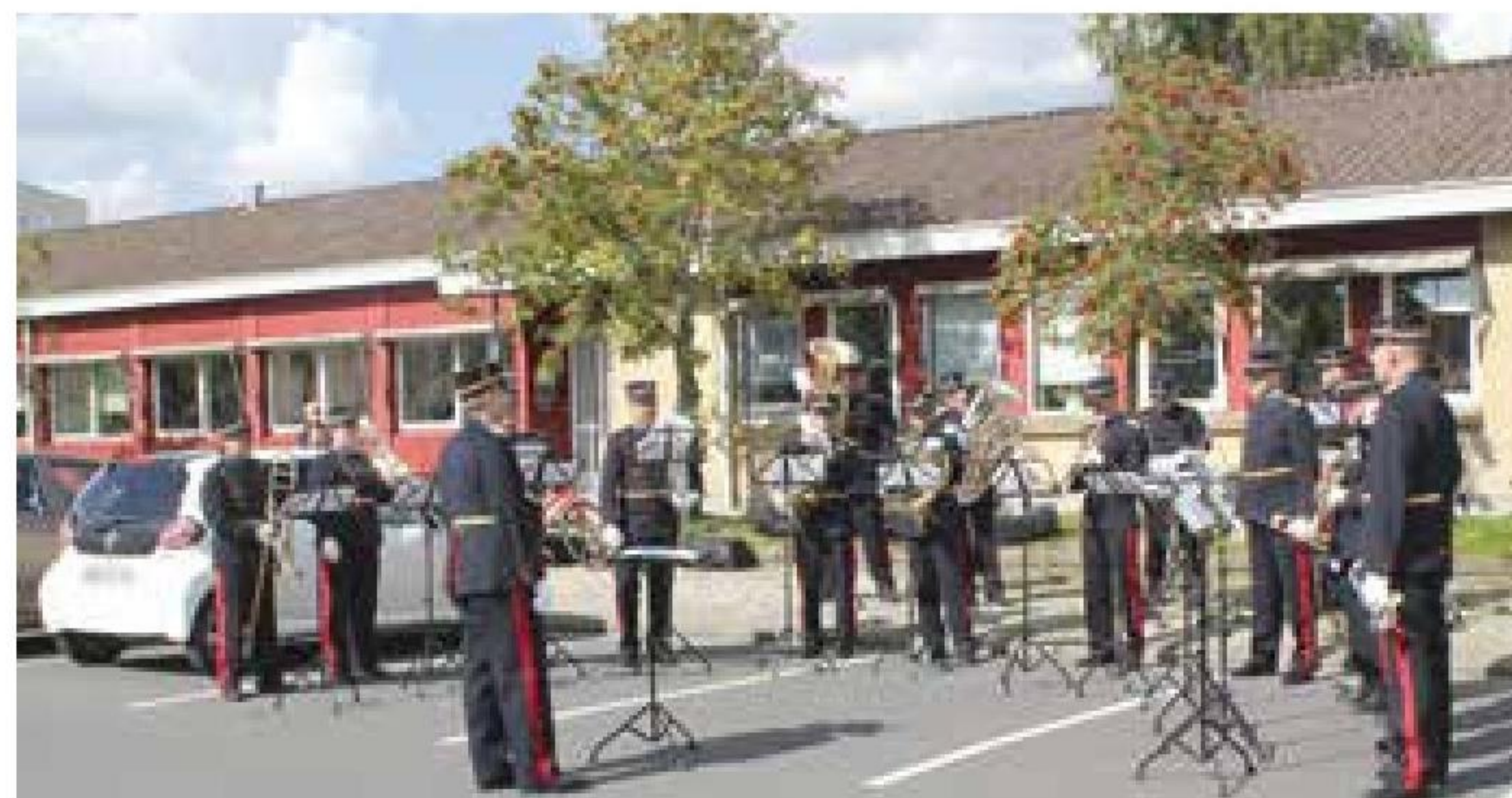
▲ Hærens Telegrafregiment's Slesvigske Musikkorps var med i velkomstdeputationen, da ERTHOLM og ALHOLM i august besøgte Haderslev.