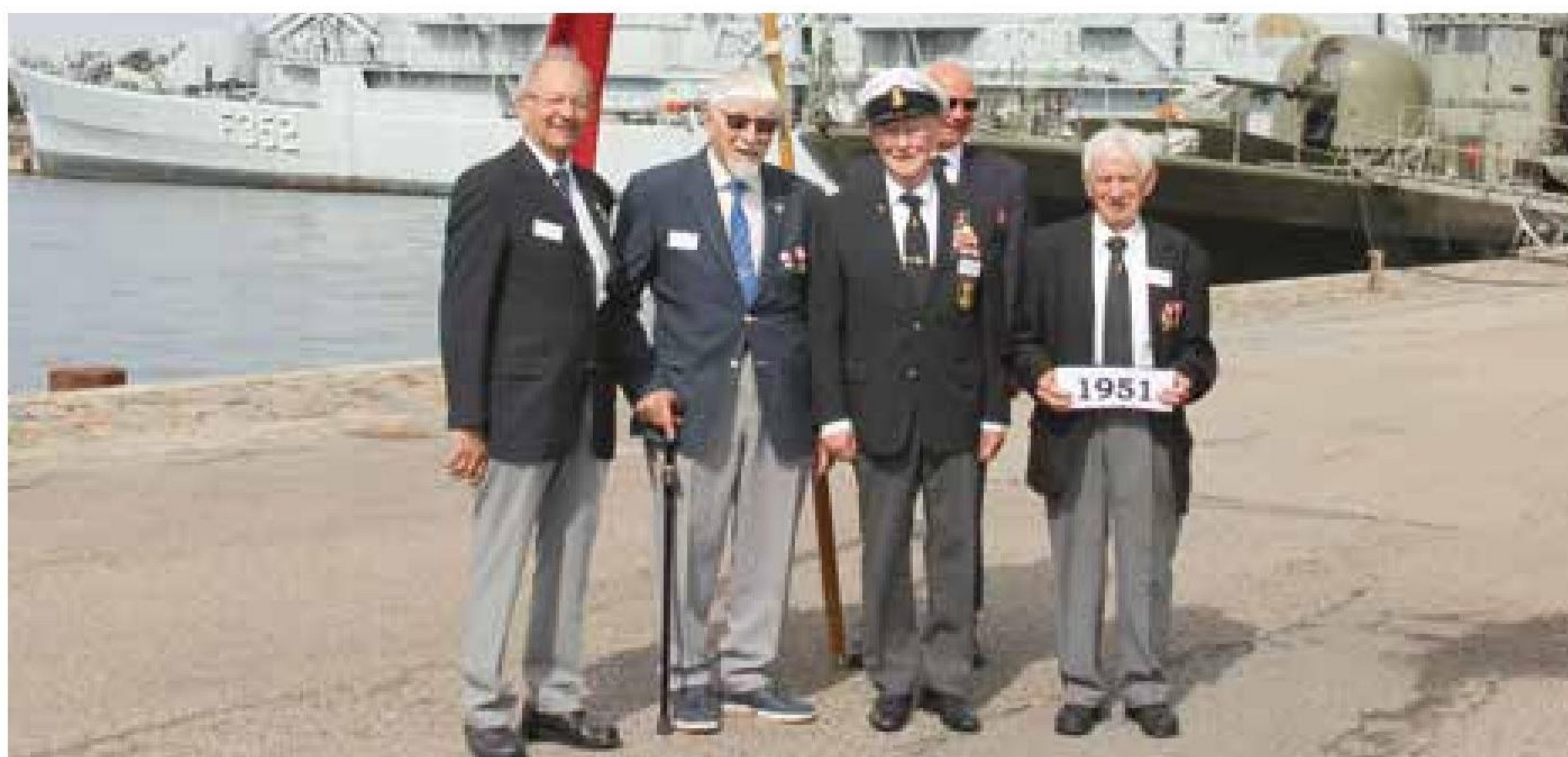
▲ Årgang 1951 (65 år) havde 6 jubilarer.

På bagkant af årgangsfotograferingen og besøg på museumsfregatten PEDER SKRAM samt forfriskninger i København Marineforenings stue stod den på socialt samvær i Søofficersskolens aula. Arrangementet havde sit omdrejningspunkt omkring sild og den traditionelle biksemad med to spejlæg samt musisk underholdning ved Kvindelige Marinere's Musikkorps. De 236 deltagere kunne herefter sidst på eftermiddagen igen spredes ud over det ganske land. Alle med en god oplevelse i bagagen. ■