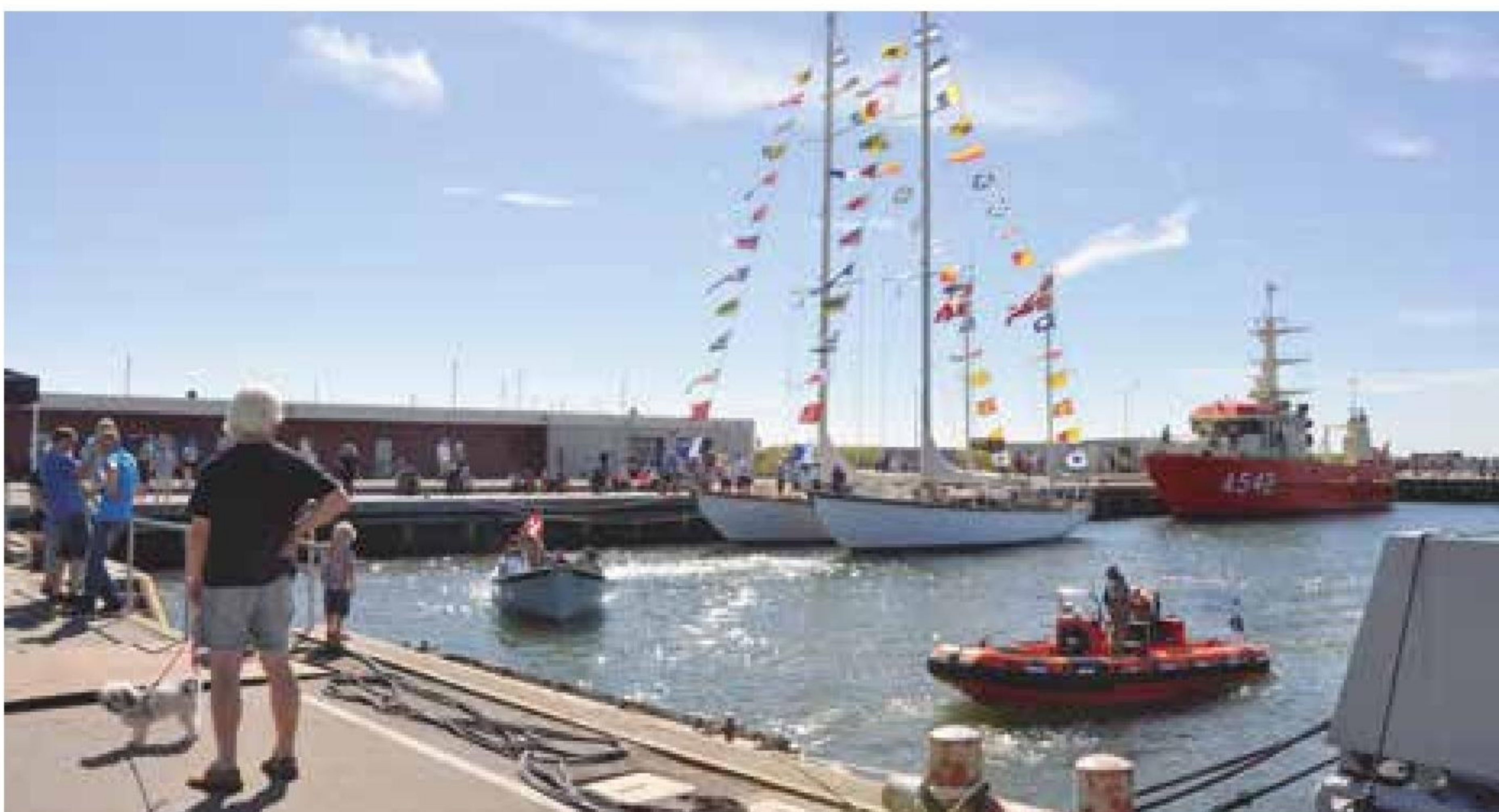
▲ Skolefartøjerne Y101 SVANEN og Y102 THYRA afgår den 6. oktober fra København på et 10 måneders togt over Atlanten tur/retur. Her er skibene med flag over top ved Åbent Hus-arrangementet i august på Flådestation Korsør.

Udbyttet for besætningerne er for alle samarbejde, korpsånd, kultur, holdning, dannelse samt sociale og repræsentative færdigheder. For søfolk giver togtet en læring i sømandskab, meteorologi og basal navigation, mens søofficerer og navigatører lærer astronomisk navigation, storsirkelsejls og sejladsplanlægning. ■