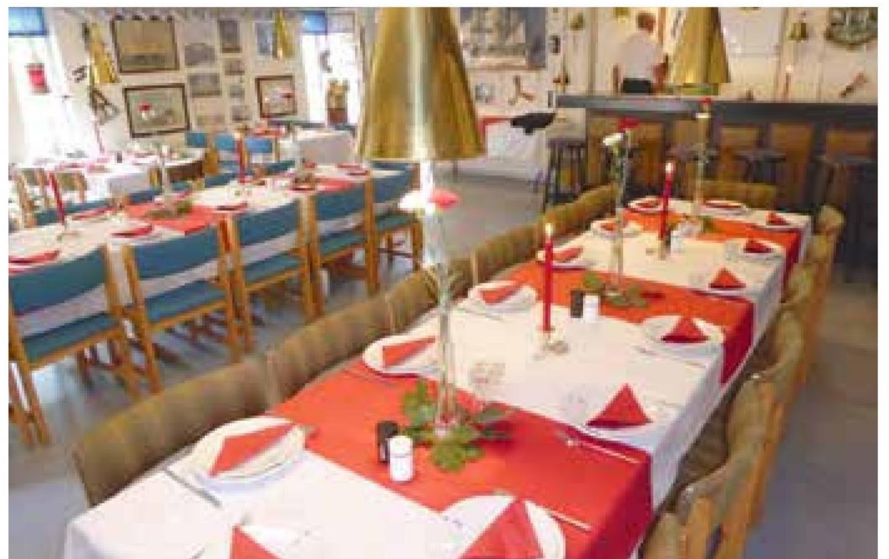
▲ 6. juli festbordet i Fredericia Marineforening var pyntet i rød og hvidt.