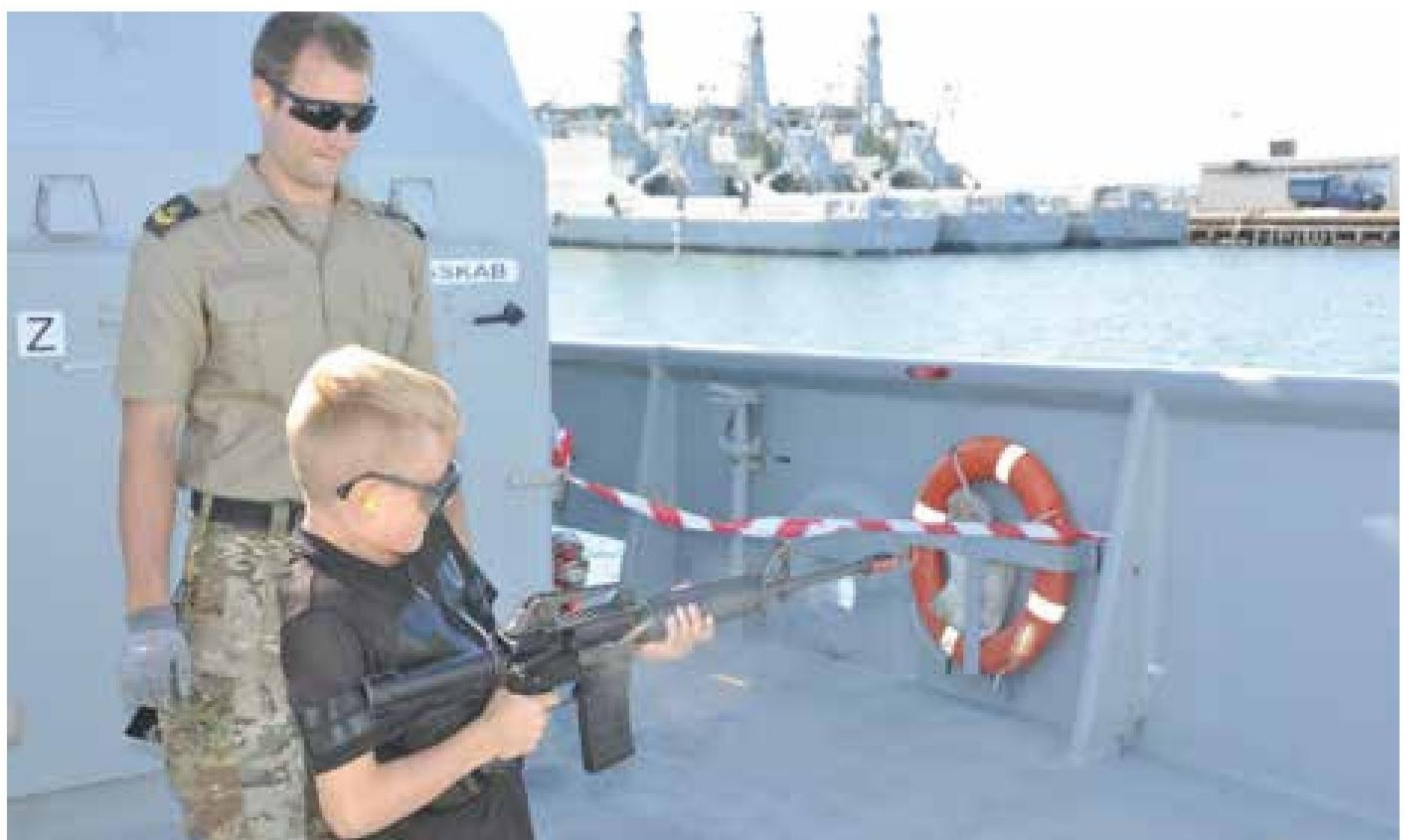
▲ En drengedrøm går i opfyldelse.