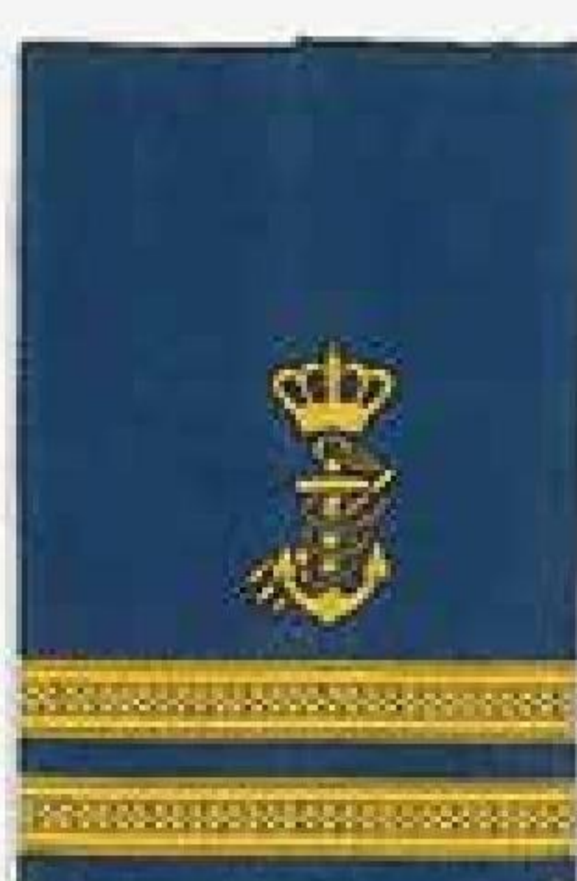
Fiskerikontrollører ved 4 års fastansættelse. Styrmand. Skibsassistenter med basissuddannelse Bedstemænd