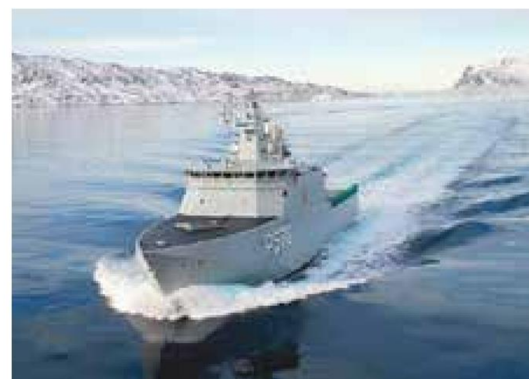
▲ Inspektionsfartøjet P 570 KNUD RASMUSSEN er et af de fartøjer, der udøver fiskeriinspektion i farvandet omkring Grønland.

heder at foretage teknisk kontrol af fiskesfartøjer som nævnt ovenfor. ■