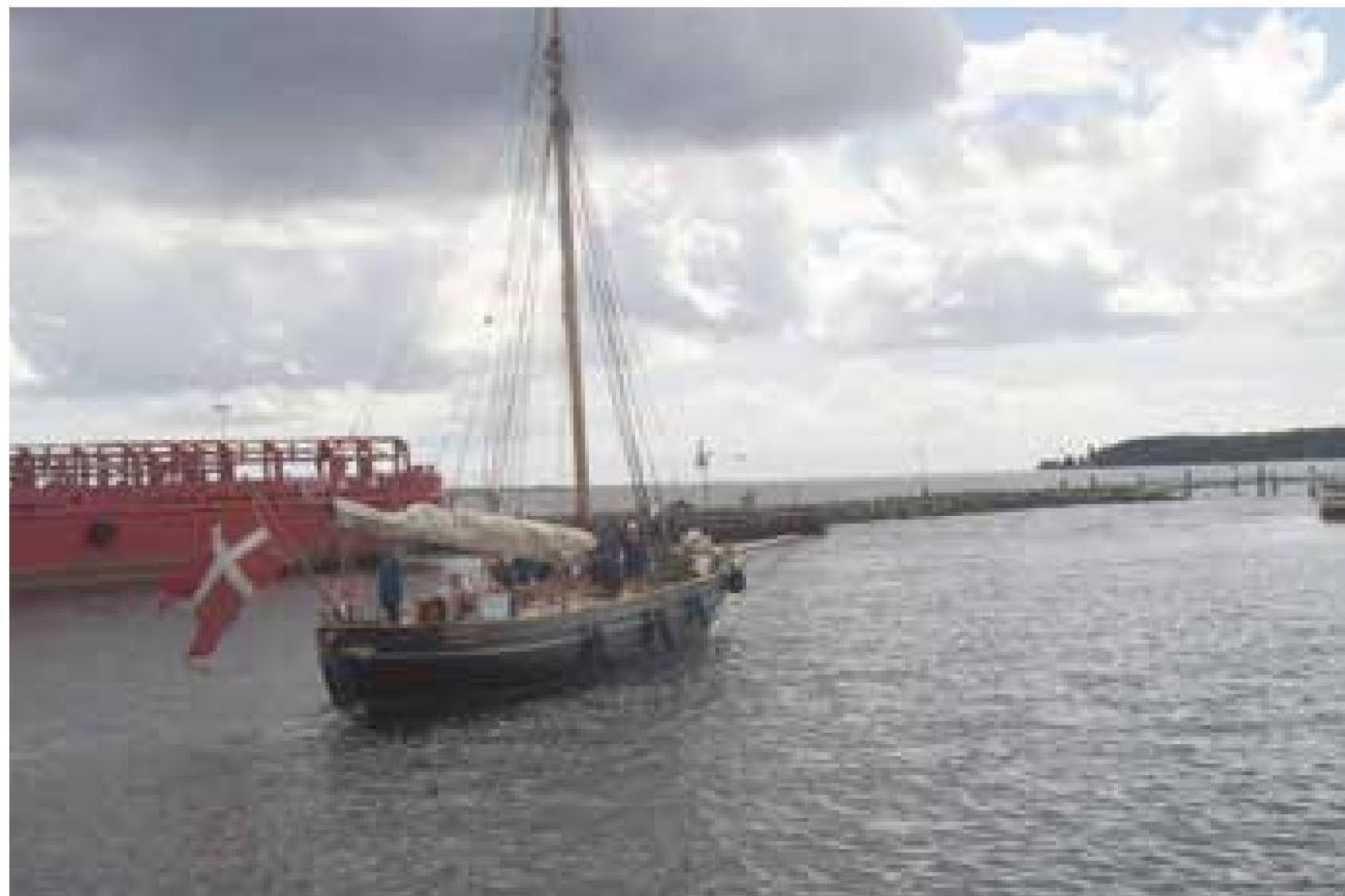
▲ "Viking" forlader Faaborg bound for Svendborg.

Den 2. juli var der returbesøg af kollegaerne fra Svendborg. De 30 gæster og ledsagere