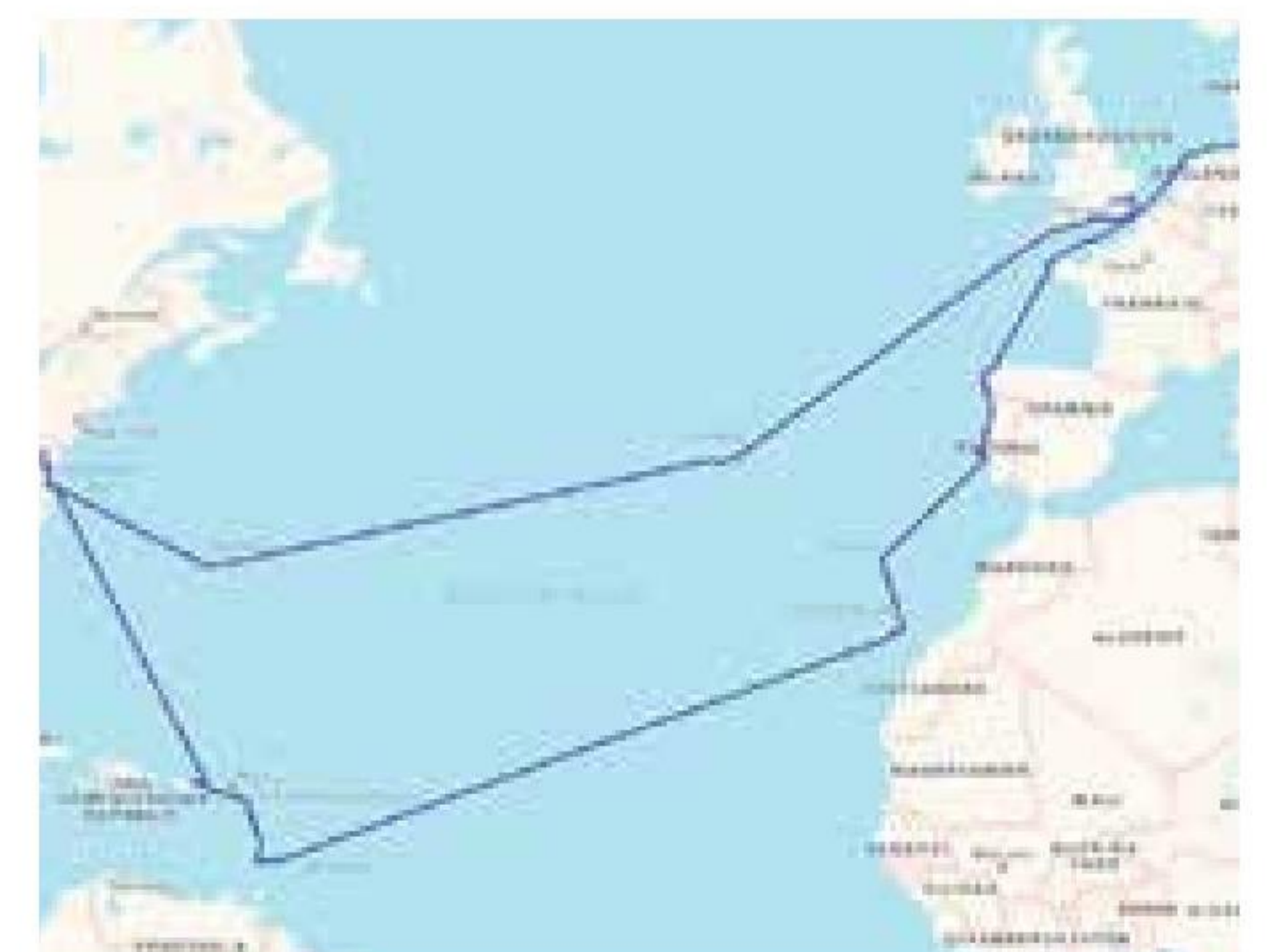
▲ Sejlplanen for SVANEN og THYRA på Atlanterhavstogtet fra 6. oktober 2016 til juni 2017.