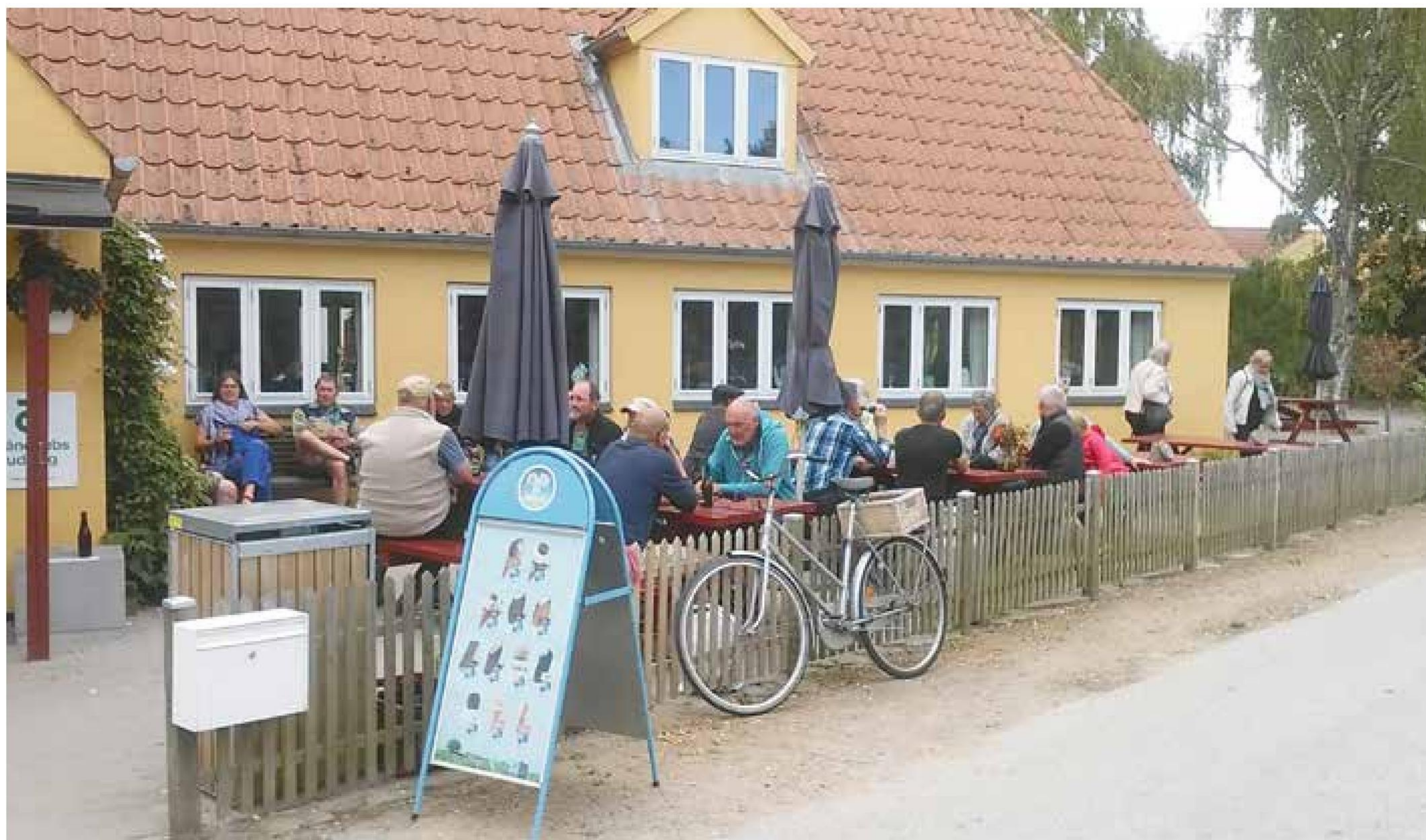
▲ Så er der "Turisterne har taget færgen retur" møde ved købmanden på Lyø.

ret, hvor meget der sker her. Uden for turistsæsonen er der for eksempel fællesspisning en gang om måneden, syng sammen-aftener, billard og diverse foredrag. Så er der arbejdsdage i bådelaug, købmandsforening og kulturcenter. Der arrangeres fælles nytårsfest og sommerfest ved kulturhuset, og om efteråret er der også en øboer, der arrangerer fest med æggekage og dans. Der er rigtig mange foreninger her på Lyø, og mange bestyrelsesposter der skal besættes.