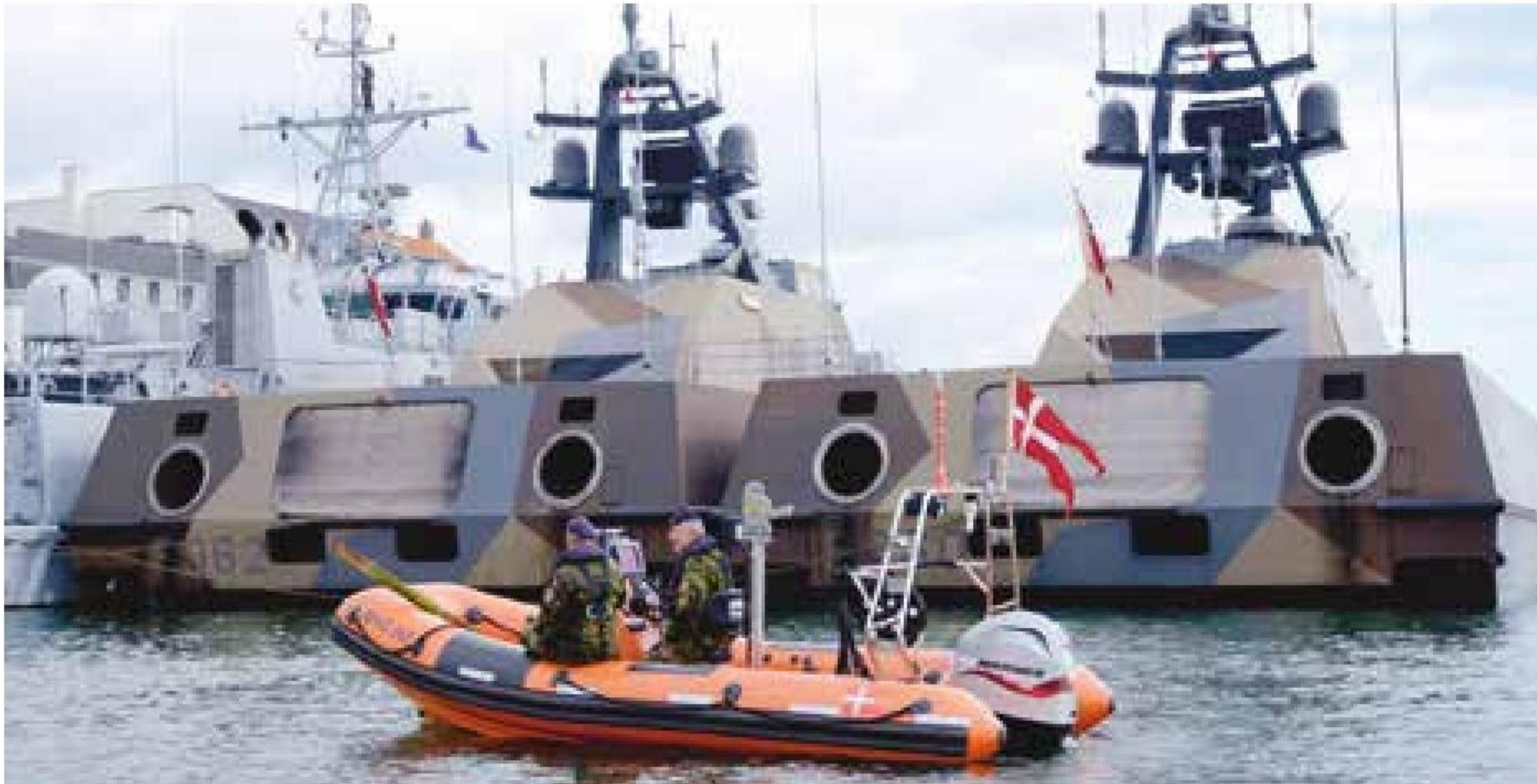
▲ MFP-gummibåd passer på tre af det norske Sjøforsvarets fartøjer. De to kamuflagefarvede enheder er kystkorvetter af SKJOLD-klassen.

indtil de så i den grad kom til hægterne og gik til den med simuleret beskydning af MHV-fartøjet.