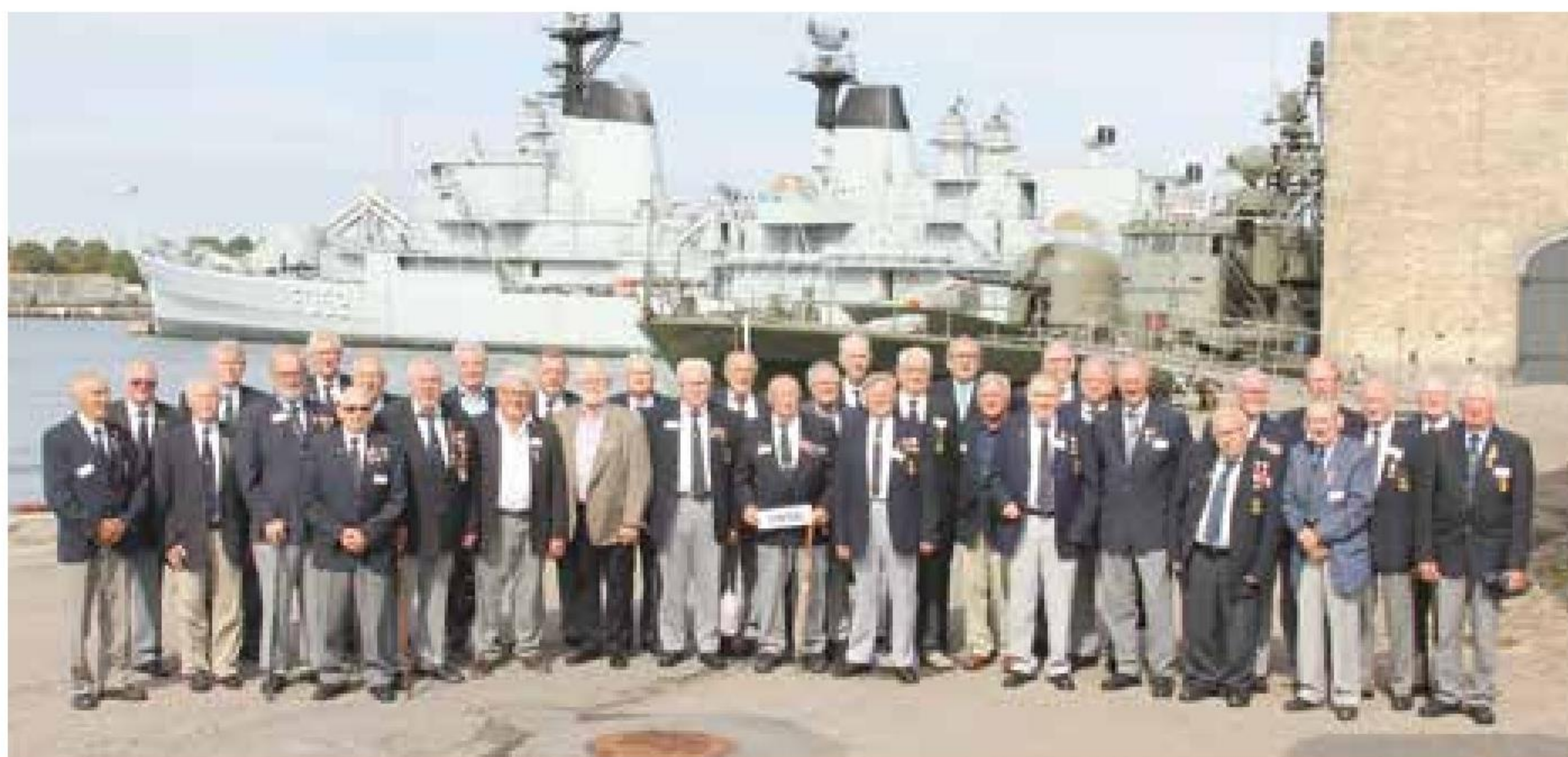
▲ Årgang 1956 (60 år) stillede med 39 jubilarer.