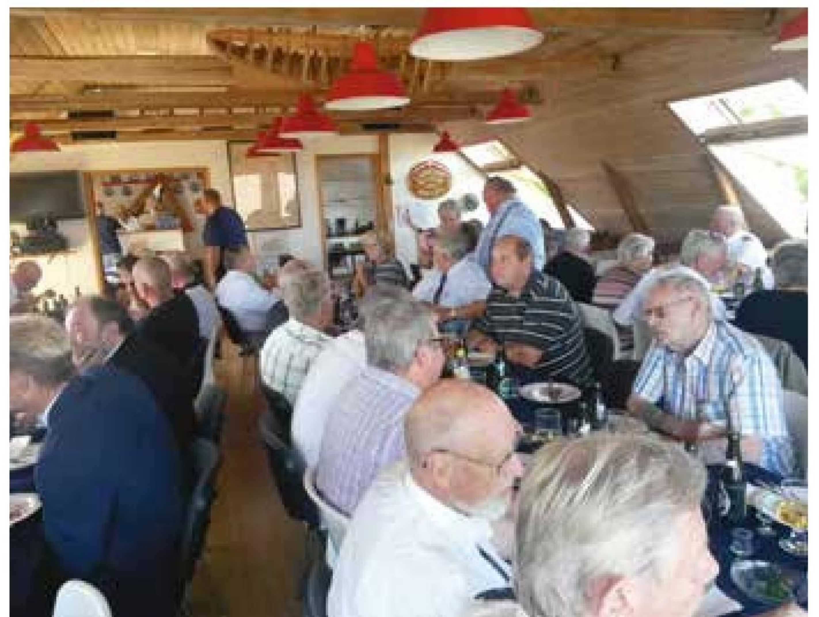
▲ De 44 deltagere på Kalundborg Marineforening's sommerudflugt til Samsø fyldte godt op i Ballen Sejlklubs lokale.