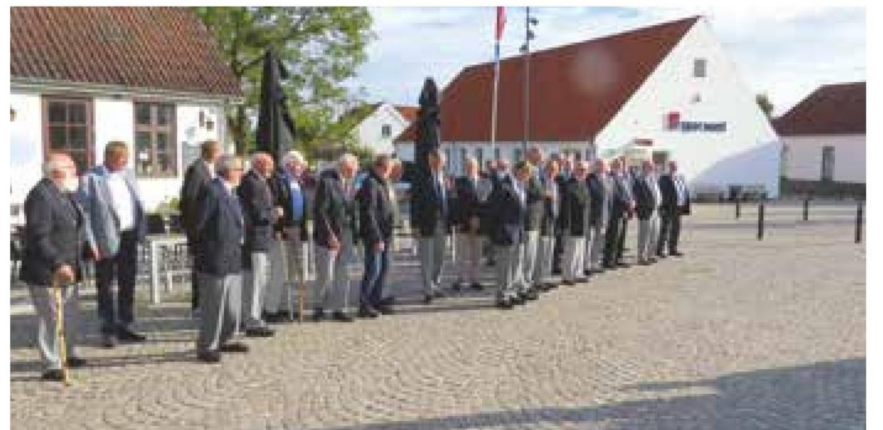
▲ Rundt 40 morgenfriske skytter fra Nibe Marineforening klar til fregatmorgenmønstring på torvet i Nibe.