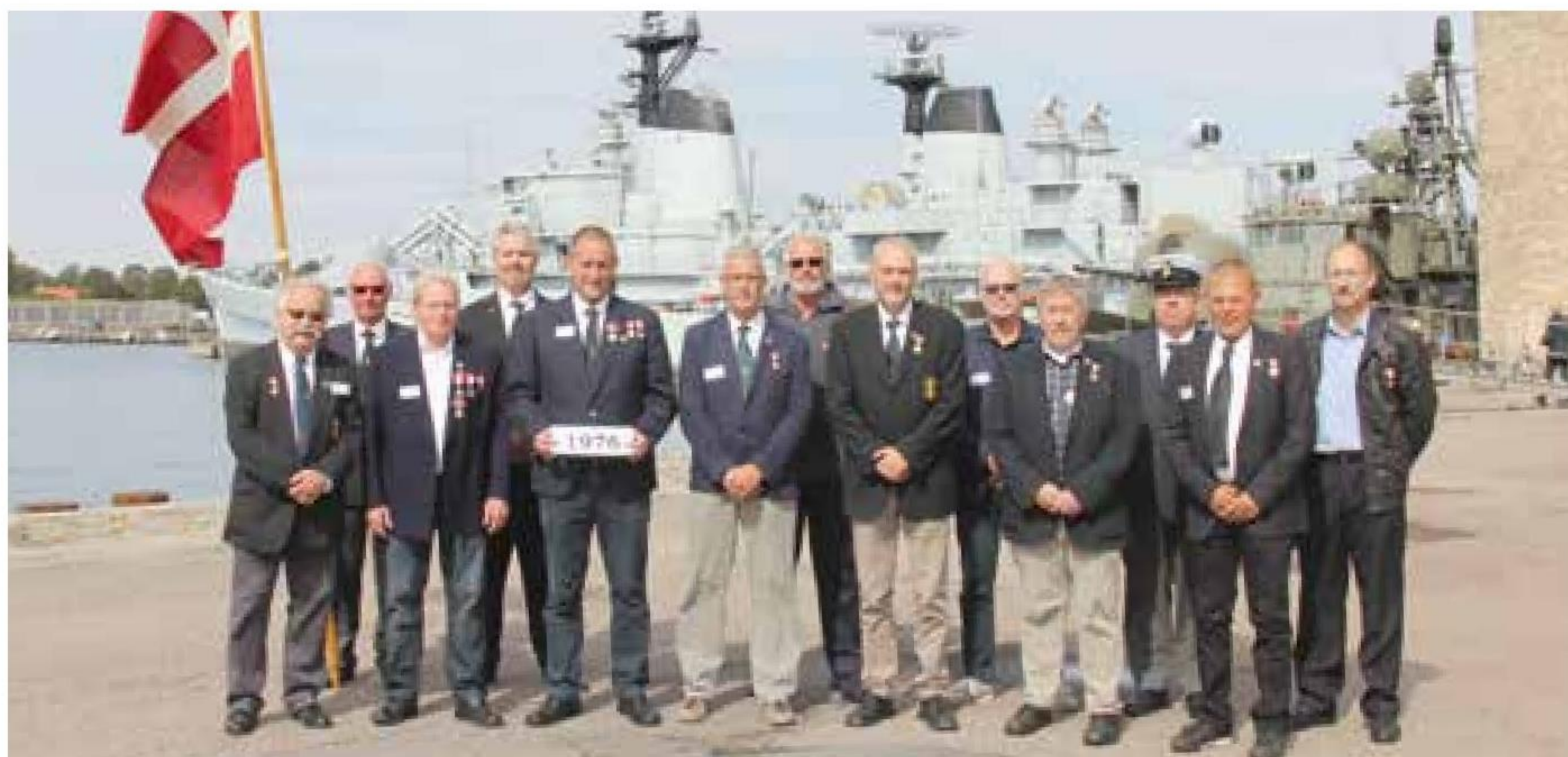
▲ Årgang 1976 (40 år) havde 13 mand på plads på Nyholm.