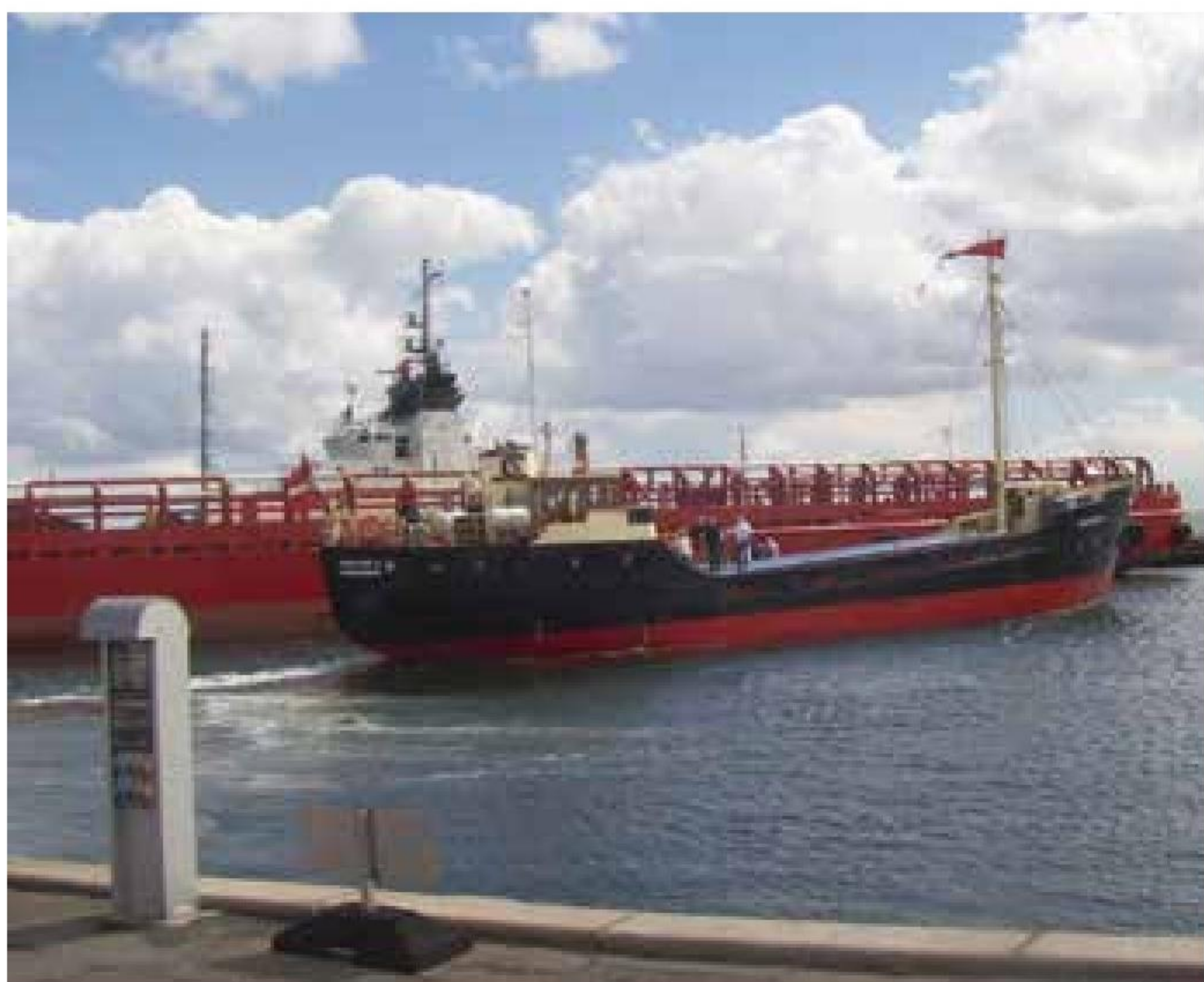
▲ "Caroline S" følger i kølvandet på "Viking" med udflugtsgæsterne fra Svendborg.

brugte som vanlig museums-skibet "Viking" og projekt coasteren "Caroline S" som transportmiddel. Under frokosten i marinestuen stod den på harmonikamusik og sommerhygge inden svendborgenserne returnerede til Svendborgsund.