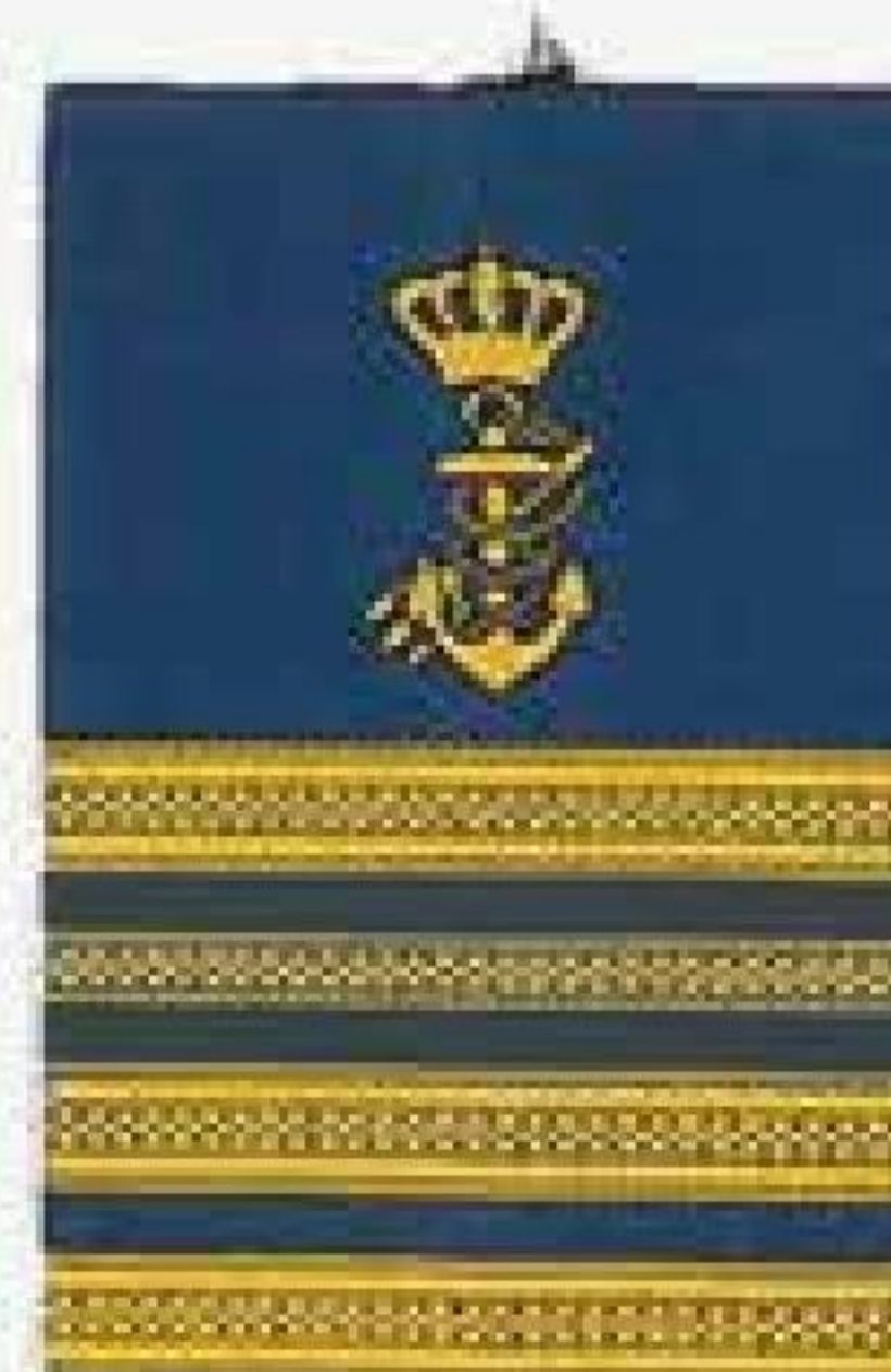
Vicefiskeriinspektører Overstyrmand Skibsmaskinmestere