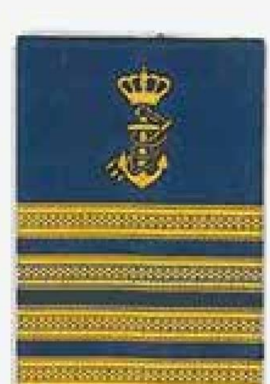
Fiskeriinspektører Skibslærere Vedligeholdelseschefer Skibsmaskinchefer