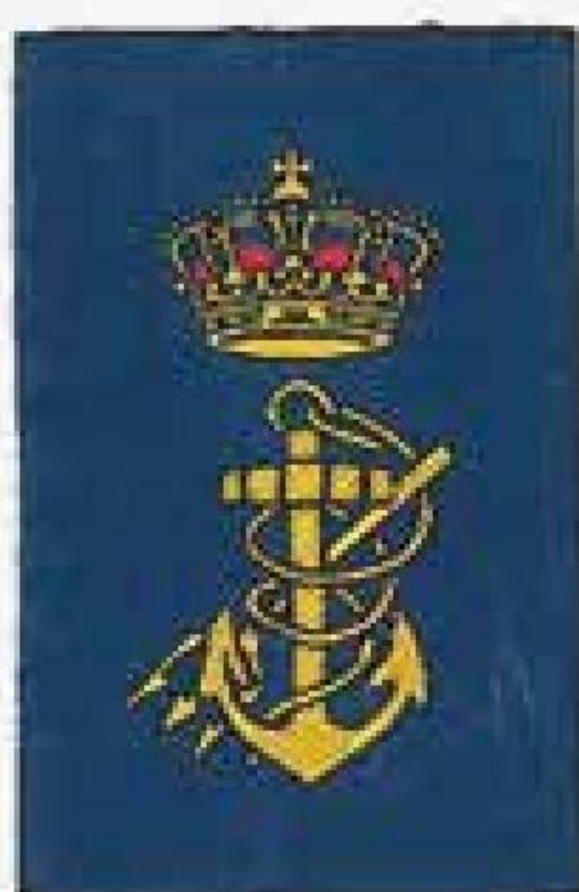
Fiskerikontrollører på prøve Skibsassistenter på prøve Skibskok på prøve