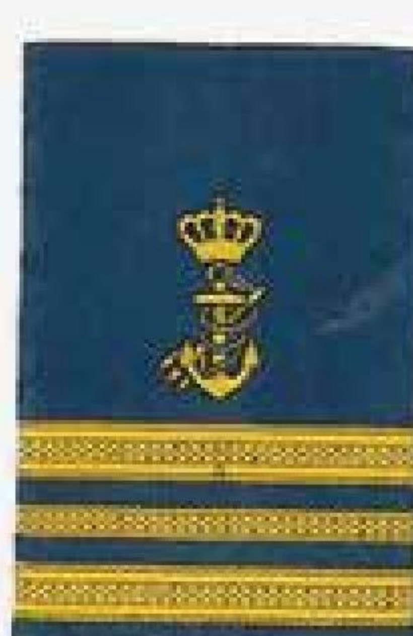
Overfiskerikontrollører Styrmand med basissuddannelse