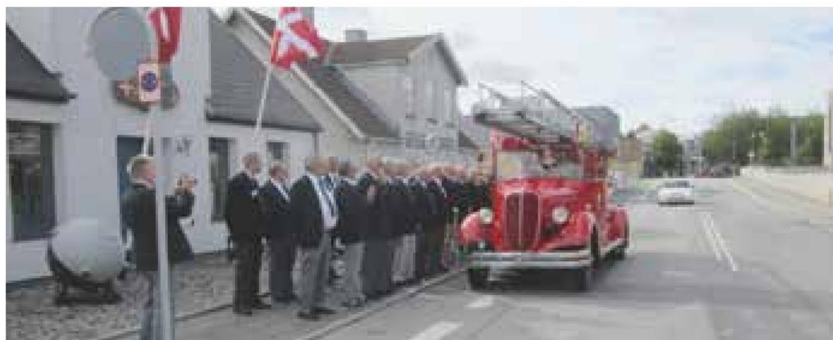
▲ Roskilde Brandvæsens gamle stigevoan afleverer fregatkaptajn anno 2015 ved marinehuset.