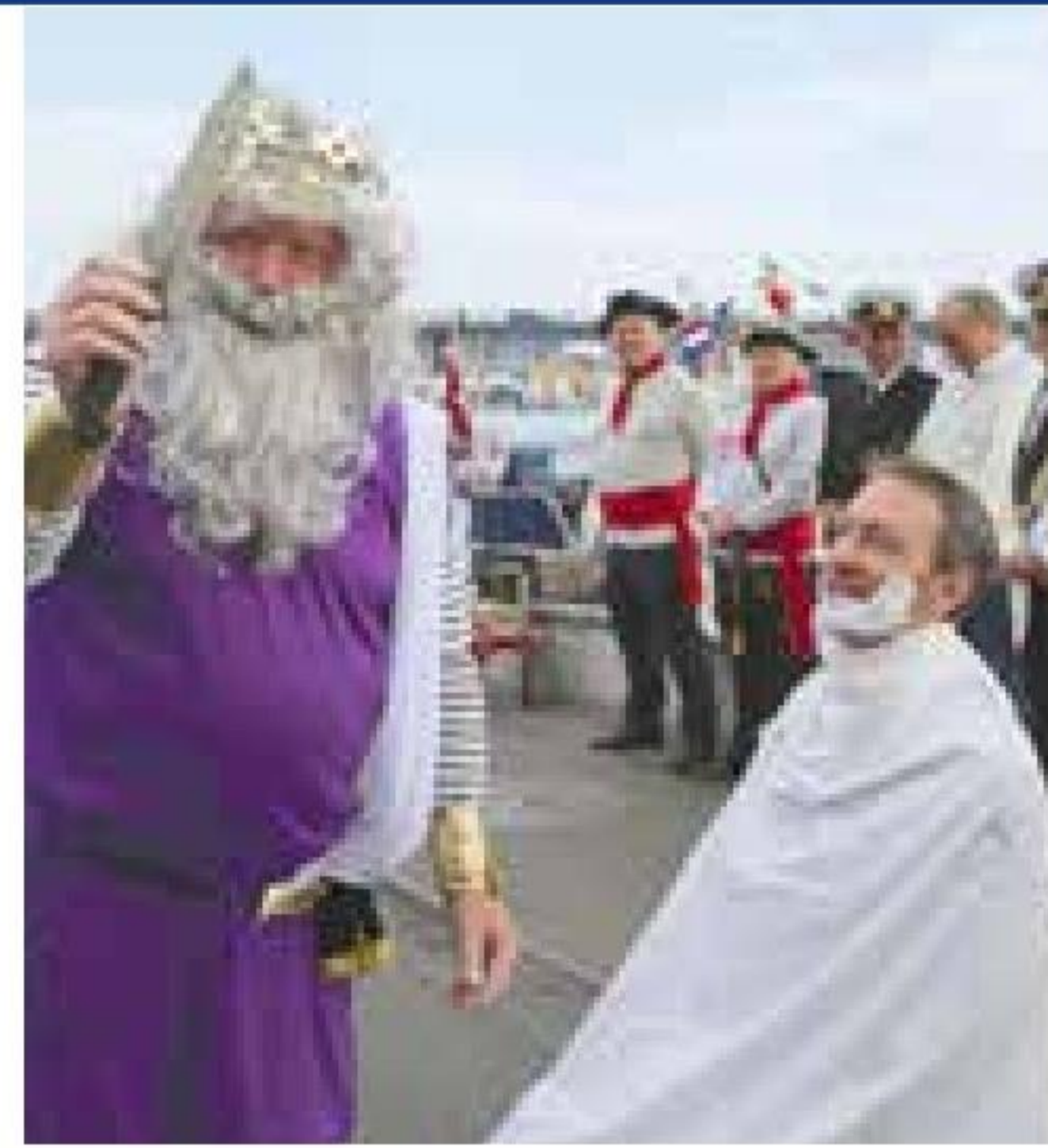
▲ Ingen kommer ubarberet til fregatskydning i Aalborg Marineforening.

Marinehjemmeværnets Musik- og Tambourkorps fra Randers gik i front, da deltagerne til Aalborg Marineforening's fregatskydning den 21. august forhalede fra havnen ved restaurant-