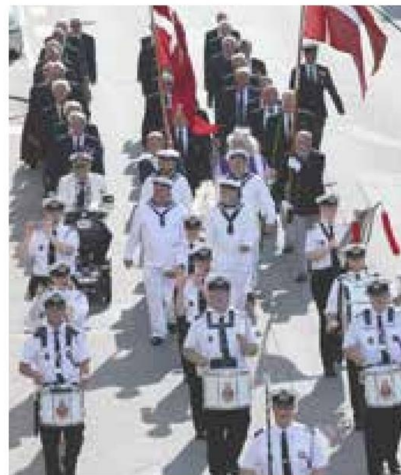
▲ Marinehjemmeværnets Musik- og Tambourkorps fra Randers havde stor succes ved fregatskydningen i Aalborg. Her er de i front under forlægningen fra restaurantskibet "Elbjørn" til Marinehuset.

skibet "Elbjørn" til marinehuset. Inden da, havde Kong Neptun sørget for, at sjuskede og ubarberede skyttegaster var blevet behørigt nettet op, så de stadsmæssigt kunne deltage i skydningen.