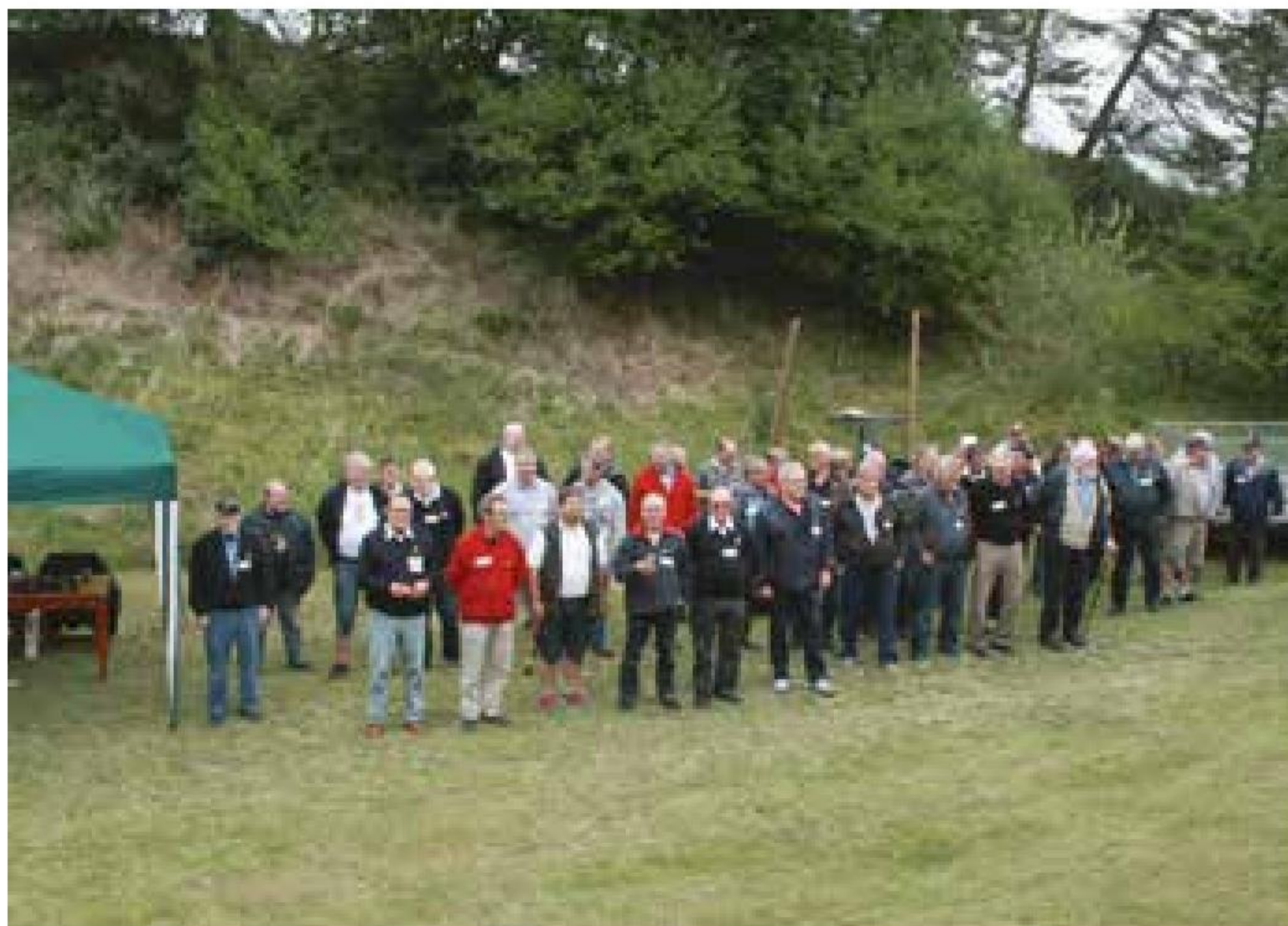
▲ Samling af fregatskytterne fra Hundested, Frederiksværk og Frederikssund Marineforeninger på Melby Skytteforenings anlæg i Tollerup.

Fra Frederikssund lyder der en stor tak til kollegaerne fra de to øvrige afdelinger. ■