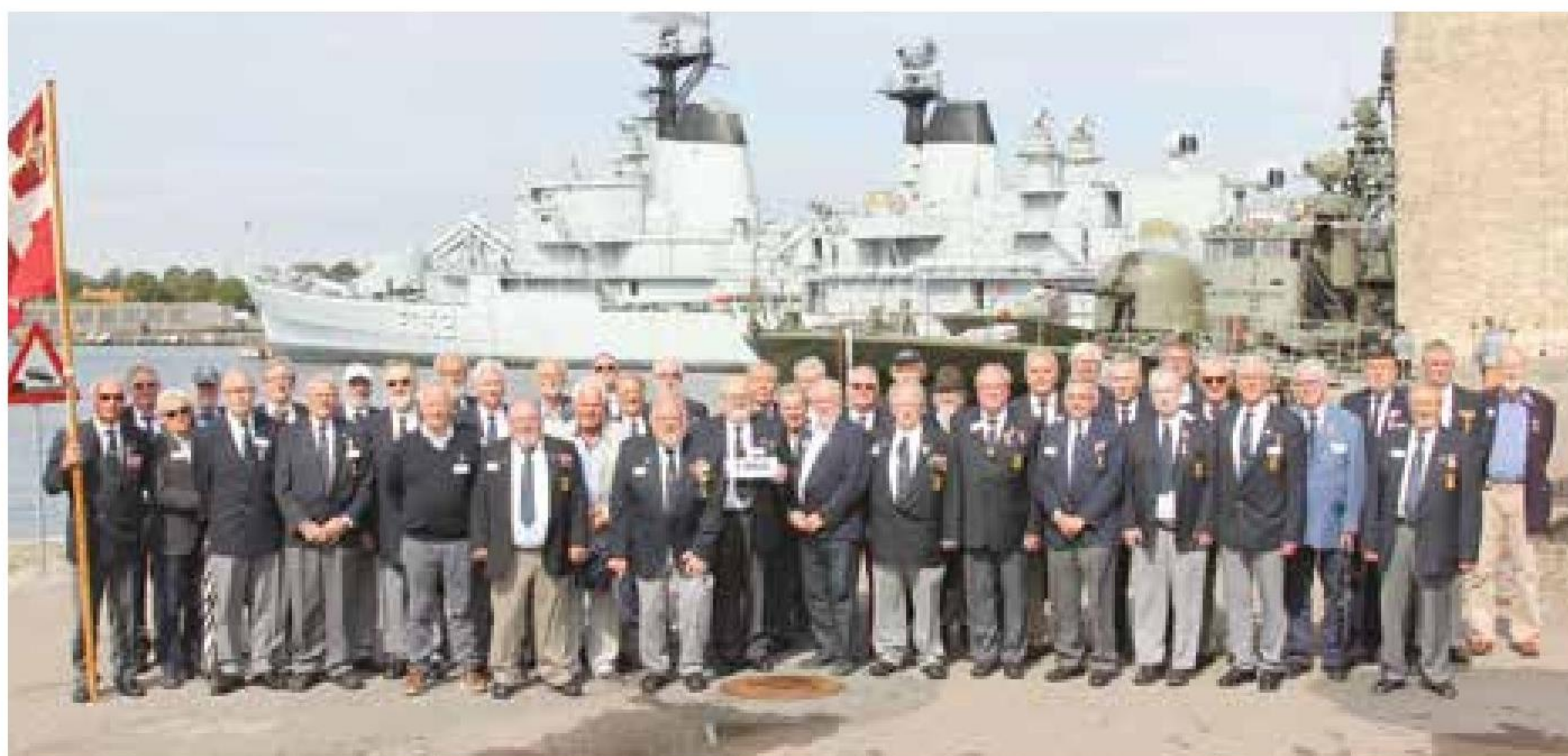
▲ Årgang 1966 (50 år) mønstrede 44 jubilarer.