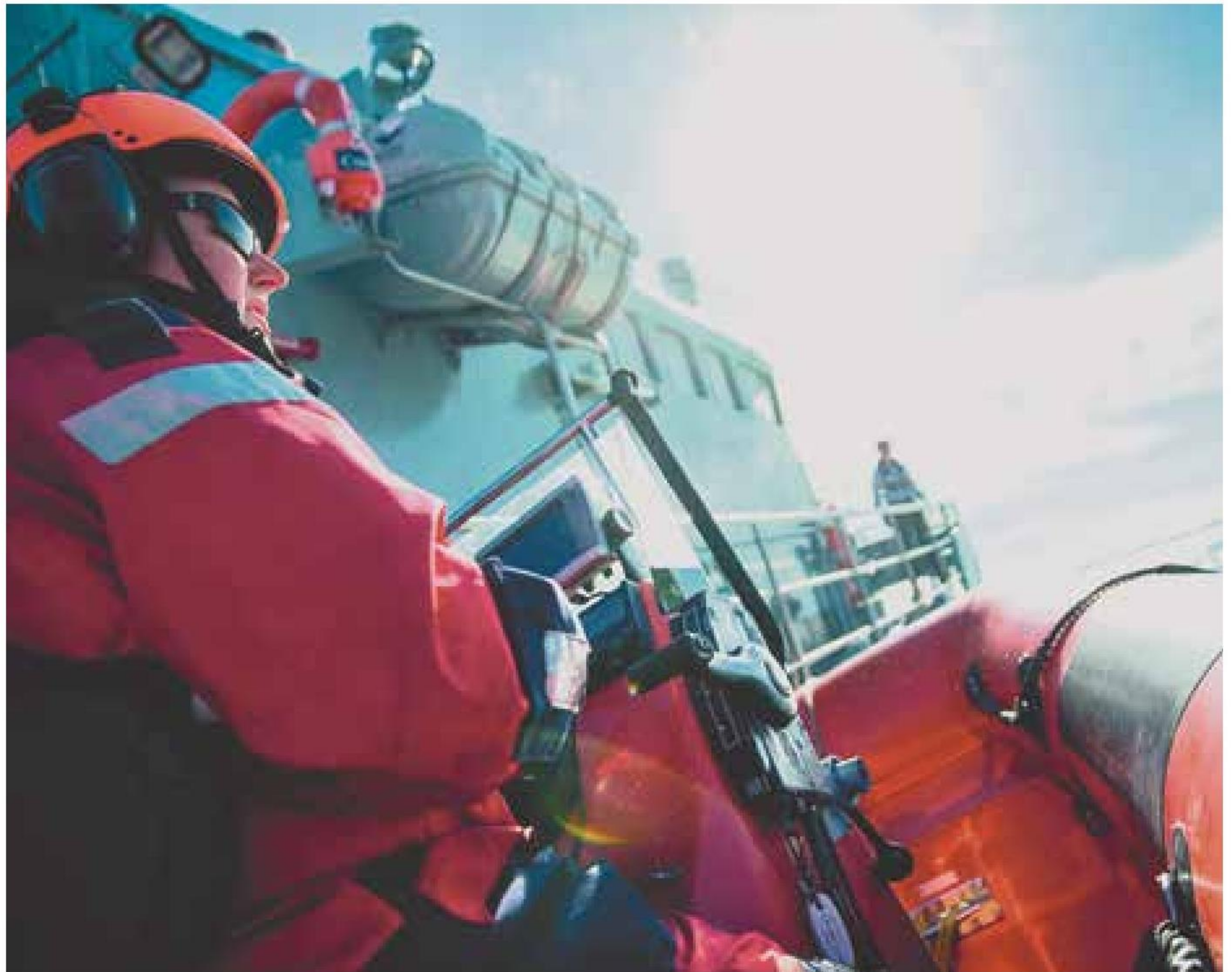
▲ Marinehjemmeværnet er frivilligt, lokalt forankret og klar til at rykke ud på én time – døgnet rundt.

Omstillingen af Marinehjemmeværnet søges tilrettelagt således, at det udførende led – de helt essentielle frivillige flotiller – berøres i så margi-nalt omfang, som det er muligt, idet både frivillige og fastansatte holder sammen og ved fælles tilgang arbejder for, at Marinehjemmeværnet kan levere operativ effekt til glæde for Søværnet, samfundet og den enkelte mariner. ■