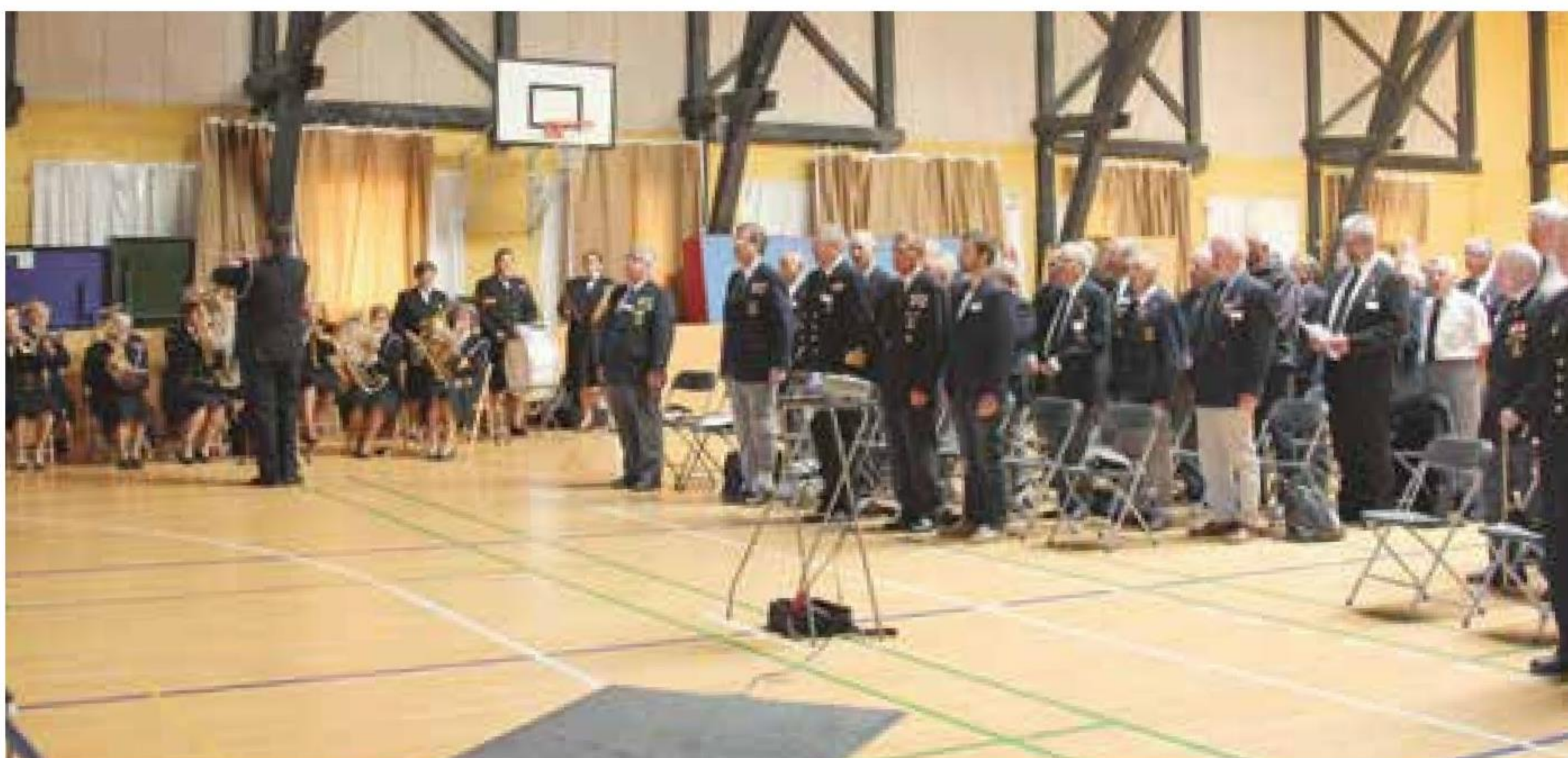
▲ Flaget sættes i Planbygningen.