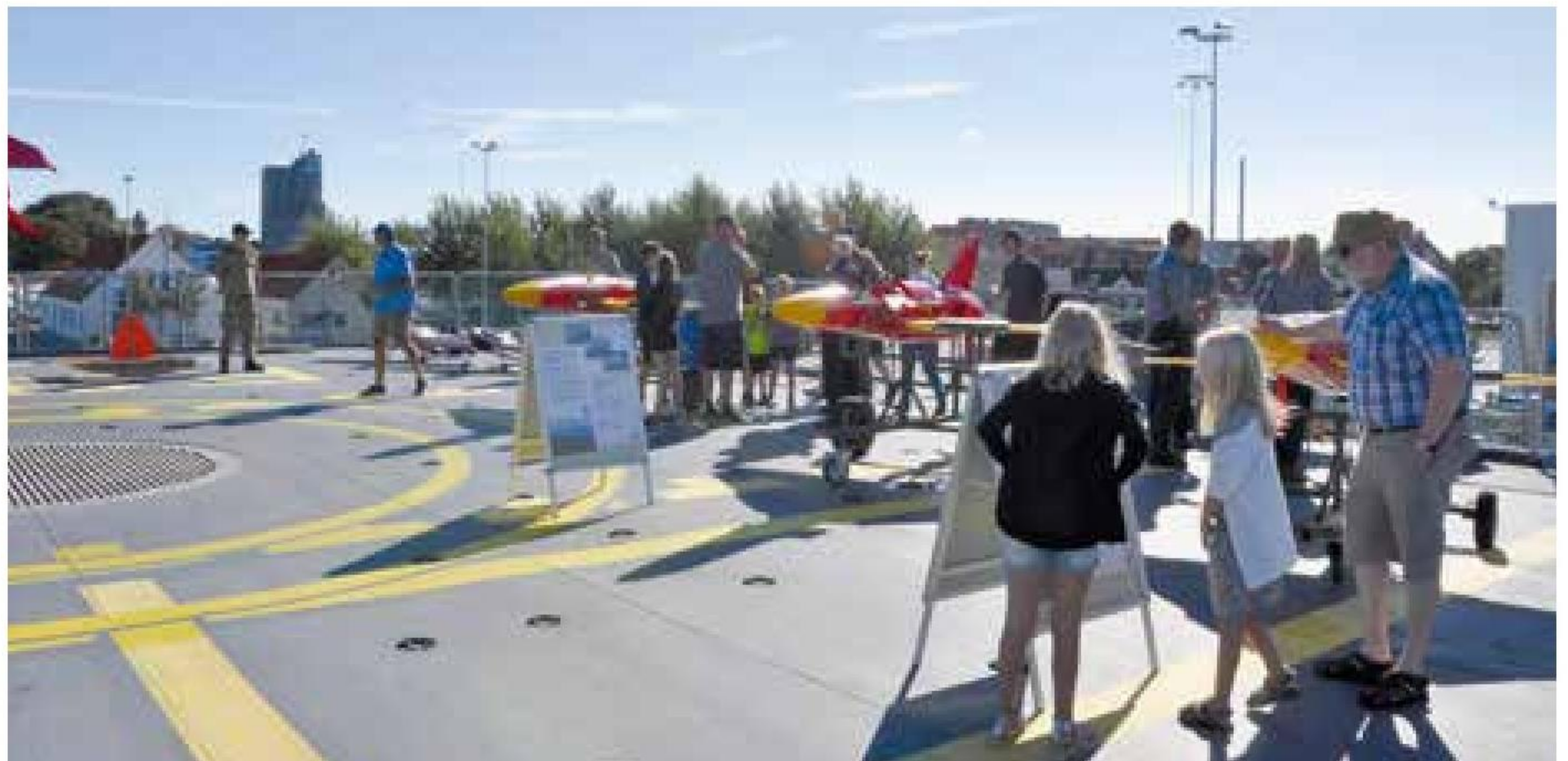
▲ Unge som ældre havde stor fornøjelse af at tilbringe en god dag under åbent husarrangementet på Flådestation Korsør.

På forhånd vidste vi, at gæstesejladserne ville være eftertragtede. Der sejles med flere typer af fartøjer. Den gamle jolle MARTHA sejler i et adstadigt tempo, slæbebåden ALSIN kan tage familierne i alle aldre, og gummi-bådene sejler med dem, der gerne vil have lidt fart over feltet. Ventetiden var i perioder en time, men som en kvindelig gæst udtrykte det, så var turen hele ventetiden værd.