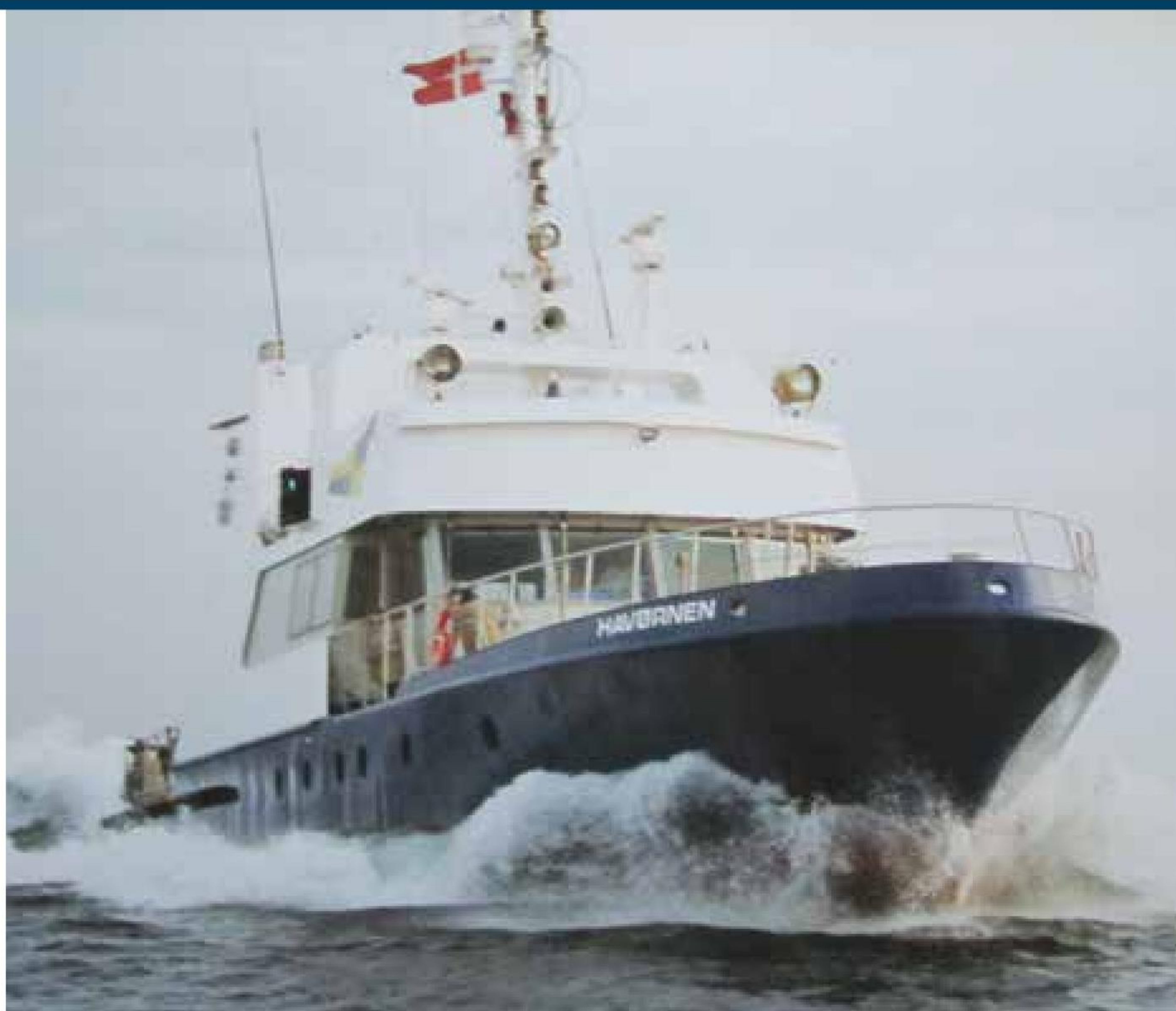
▲ Havørnen arbejder primært med fiskerikontrol i de indre danske farvande

Derfor sker fordelingen af de 51 muslingelicenser i Limfjorden og friholdelse af