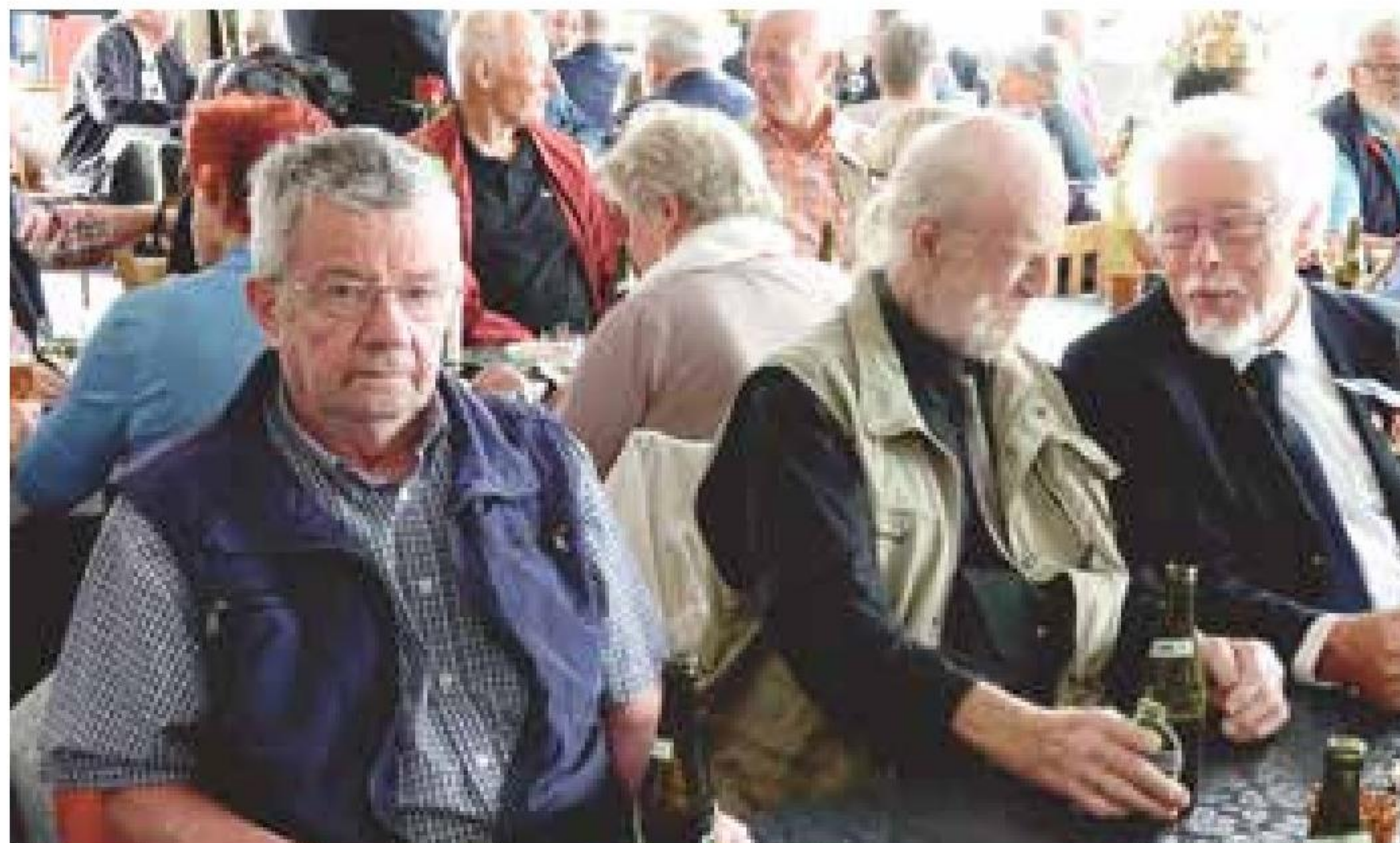
▲ Den nye marinestue i Gilleleje var tæt pakket med medlemmer, ledsagere og øvrige gæster under åbningsreceptionen den 6. august.

af afdelingens nye marinestue. En formidabel indsats fra medlemmerne og afdelingens samarbejdspartnere er endt op med