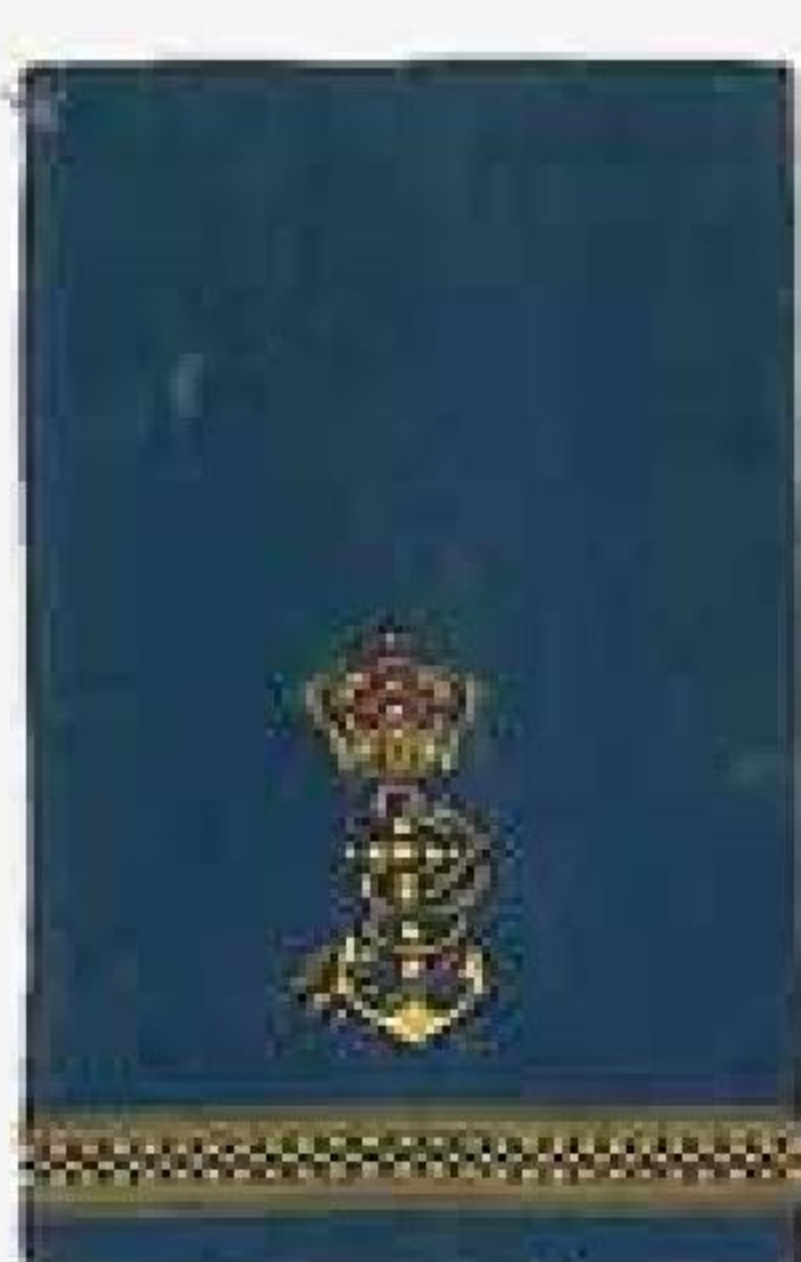
Fiskerikontrollører ved fastansættelse. Skibsassistenter ved fastansættelse. Skibskok ved fastansættelse