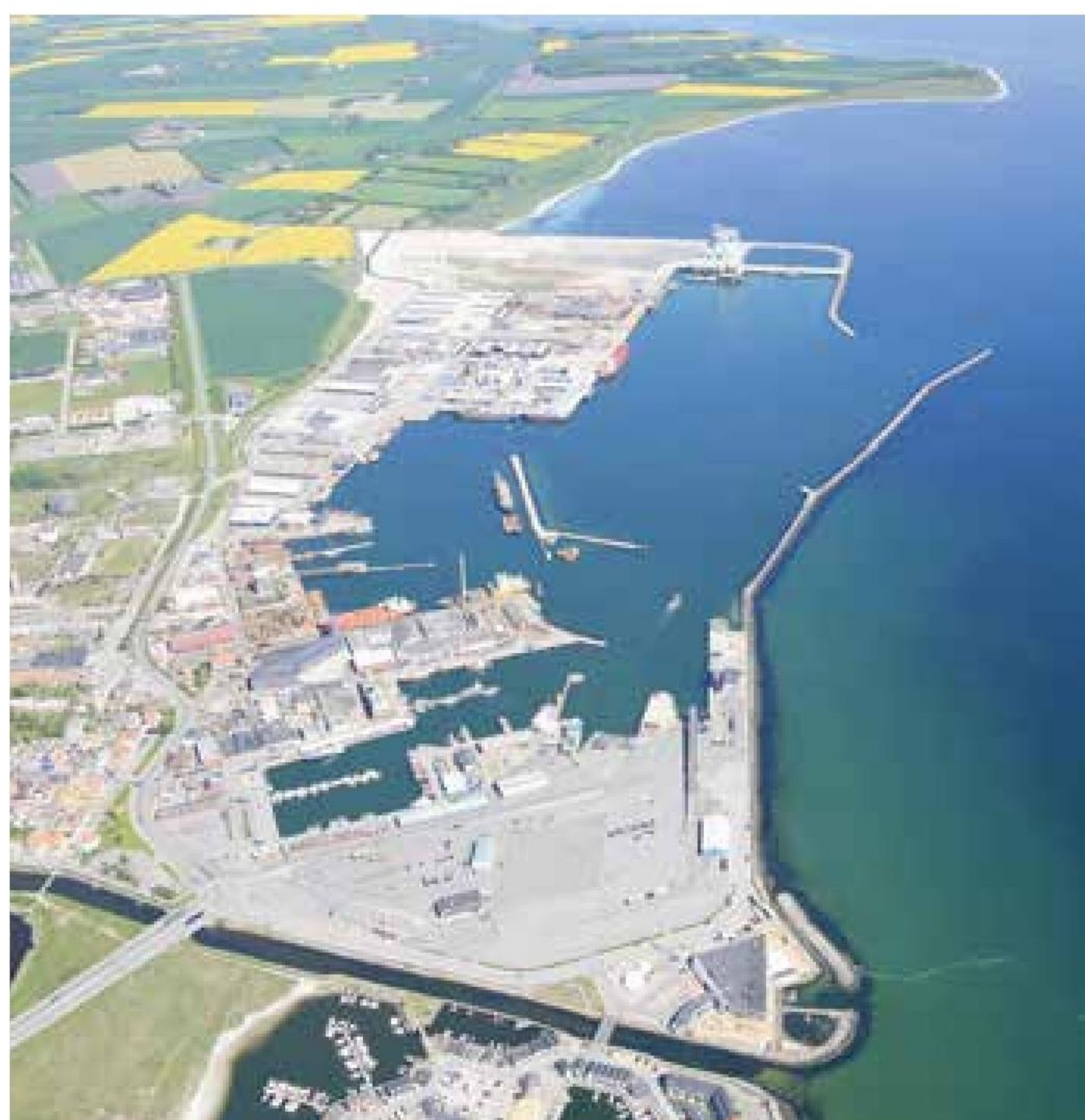
▲ Ny strategiplan skal fremtidssikre Grenaa Havn.

Grenaa Havns rolle som stor industrihavn skal netop gøres kendt og udnyttes strategisk i disse år, hvor konkurrencen blandt danske havne øges, og hvor der samtidig sker en strukturændring blandt havnene. Mange havne tæt på byernes centrum ændrer karakter og udlægger i stigende grad arealer til beboelse og rekreative områder. Det sætter nogle ret snævre miljømæssige begrænsninger for de aktiviteter, der kan rummes på havnearealet.