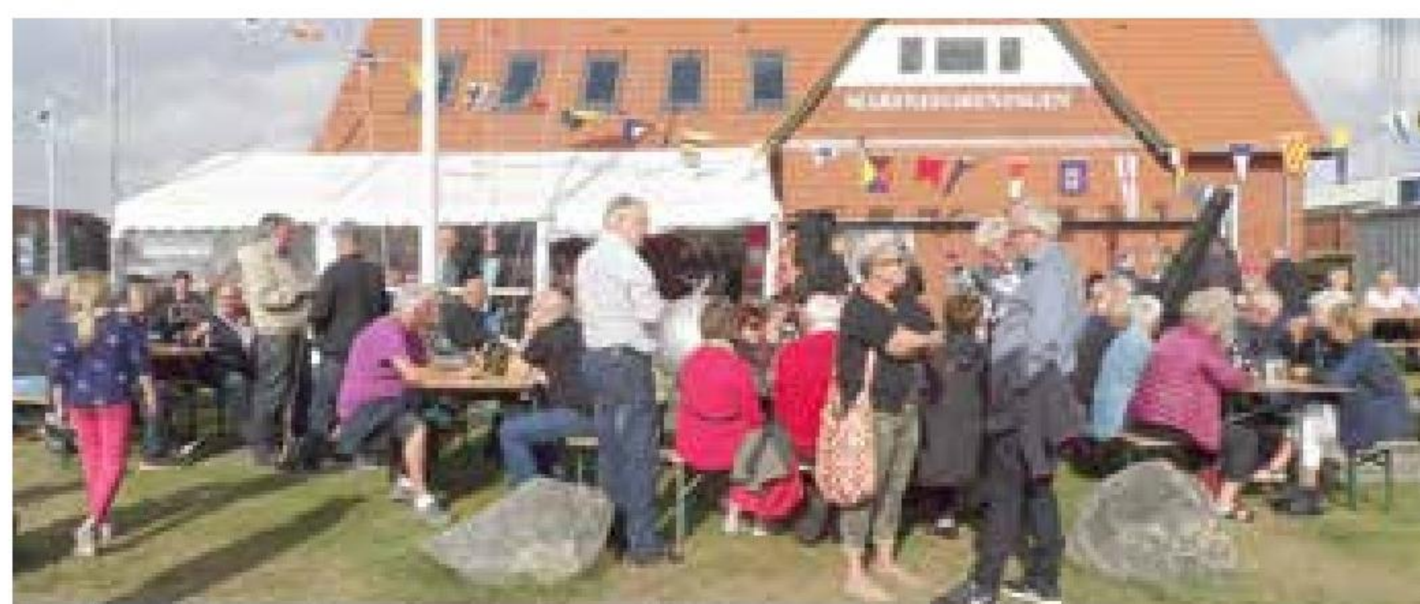
▲ Det gode vejr sidste weekend i Esbjerg Festuge gav run på publikum presset ved marinehuset.