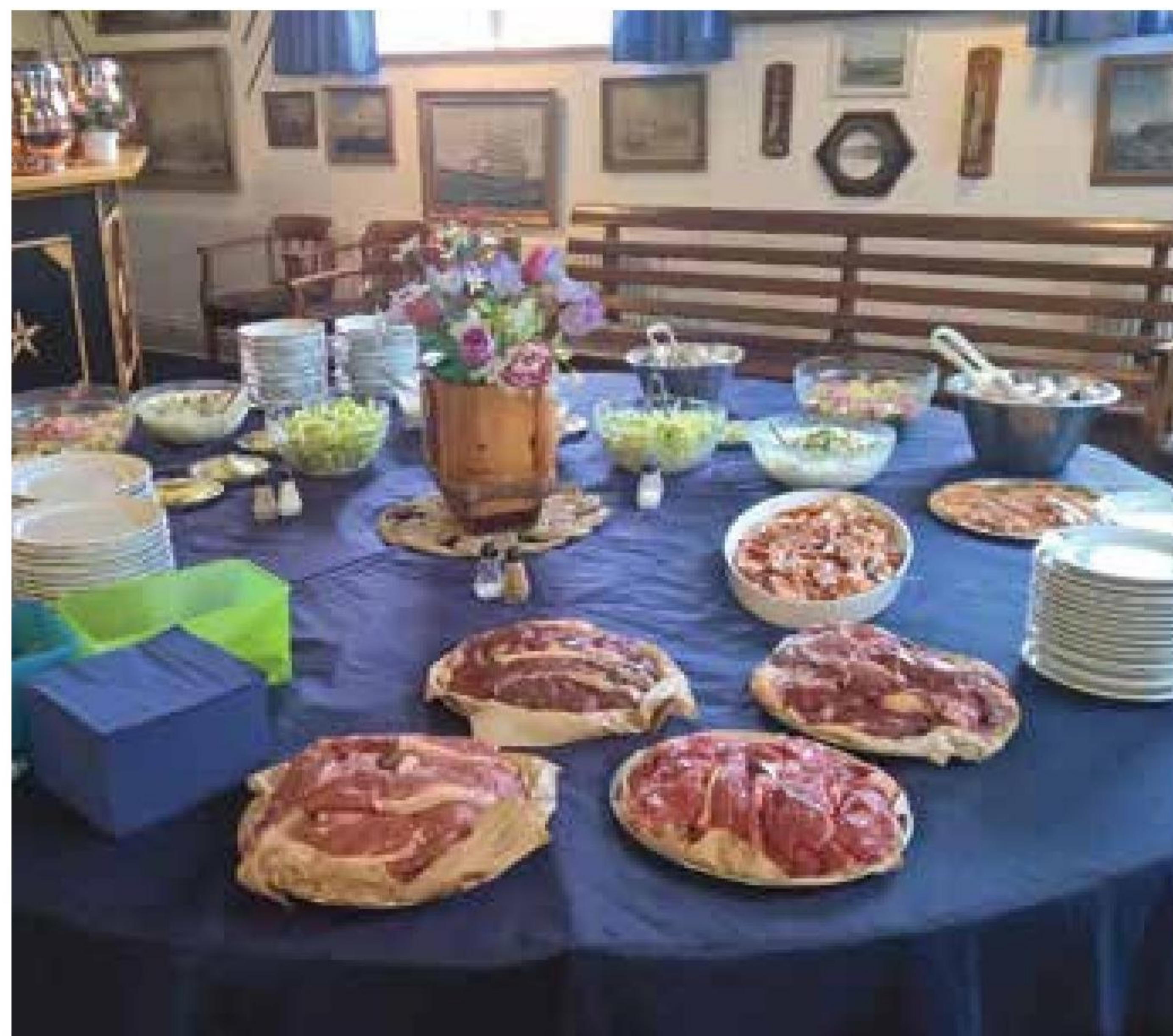
▲ Det skorter ikke på kød- og tilbehørskvaliteten ved sommerfesterne i Ebeltoft Marineforening.

Makkerskydningen genoptages i oktober. Frem mod jul kommer hjemmebane- og juleskydning. I november deltager afdelingen i distriktsskydningen. ■