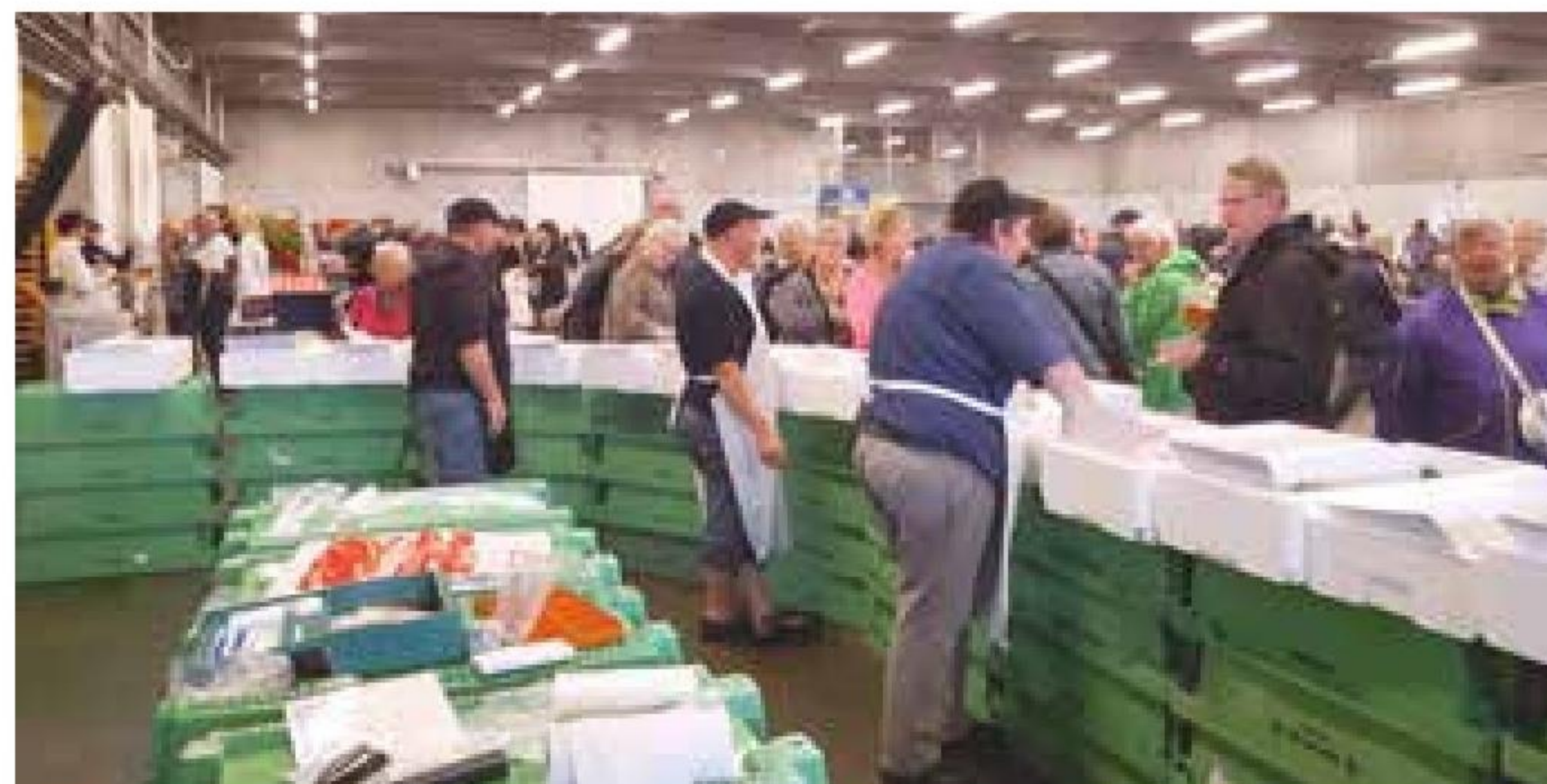
▲ Der var run på standen fra Thyborøn Marineforening, da afdelingen styrkede økonomien ved eventen Fiskedagen i Thyborøn.

Der er i Thyborøn Marineforening også stor tilfredshed omkring samarbejdet med Sea War Museum Jutland og Mindeparken. Det gode samarbejde genererer en del besøg i marinestuen af marineforeningskollegaer fra det ganske land. Således har der været besøg af marineforeningerne i Hals og Sønderborg samt et forsøg på besøg fra Glyngøre og Morsø. Thyborøn Marineforening's aftale med Thyborøn Fritidscenter gør dog, at centret har ret til at bruge marinestuen, når de har pladsman- gel til større arrangementer. ■