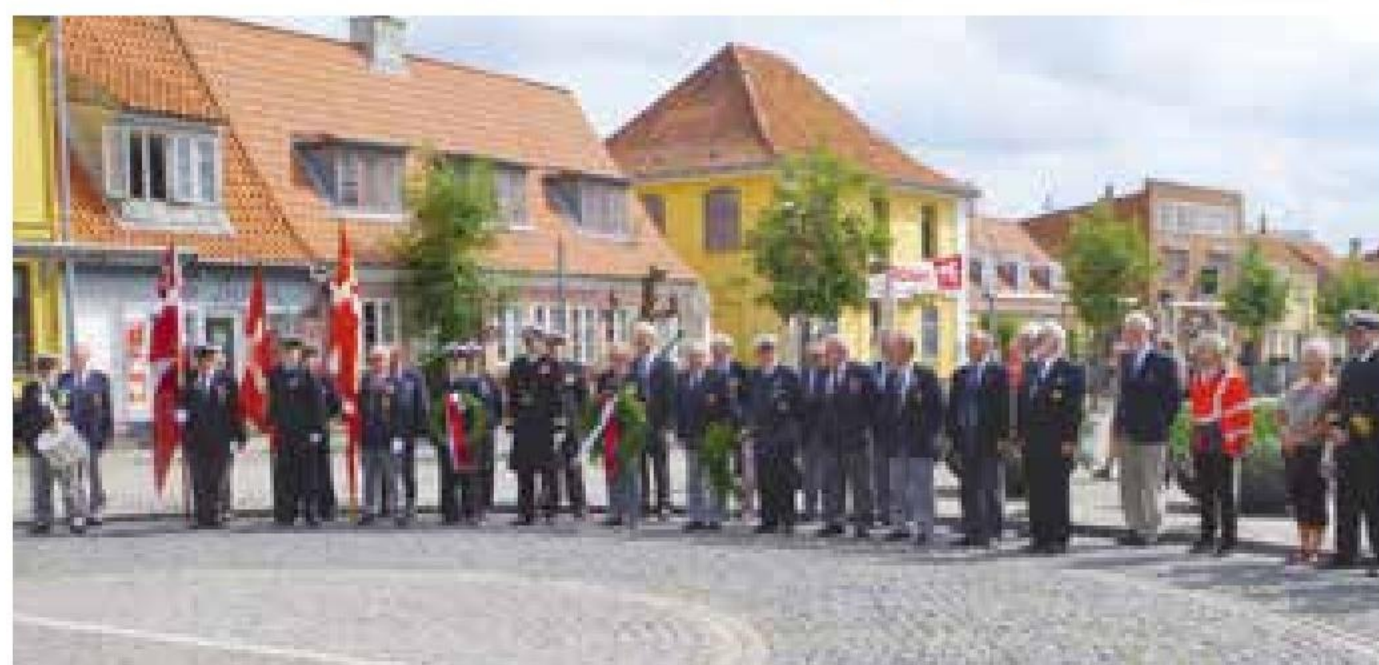
▲ Slaget i Køge Bugt den 1. juli 1677 markeres hvert år med parade og kranselægning ved mindestøtten på havnen i Køge.