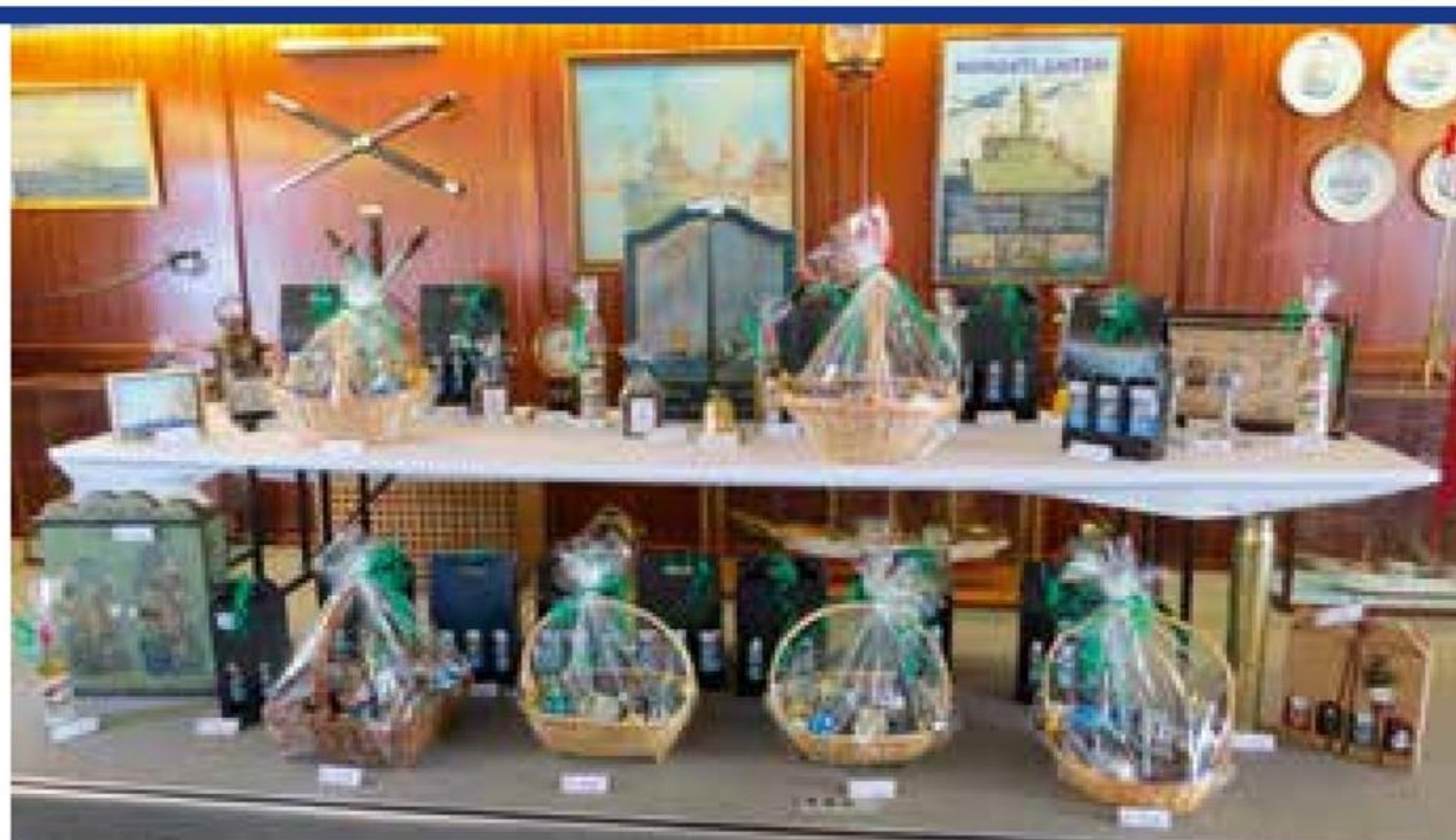
▲ Som det fremgår er præmieniveauet til fregatskydningen i Nibe af høj kvalitet.

Efter behørig mønstring og uniformstjek efterfulgt af morgenforfriskninger begav skytterne sig ud til marinehuset,