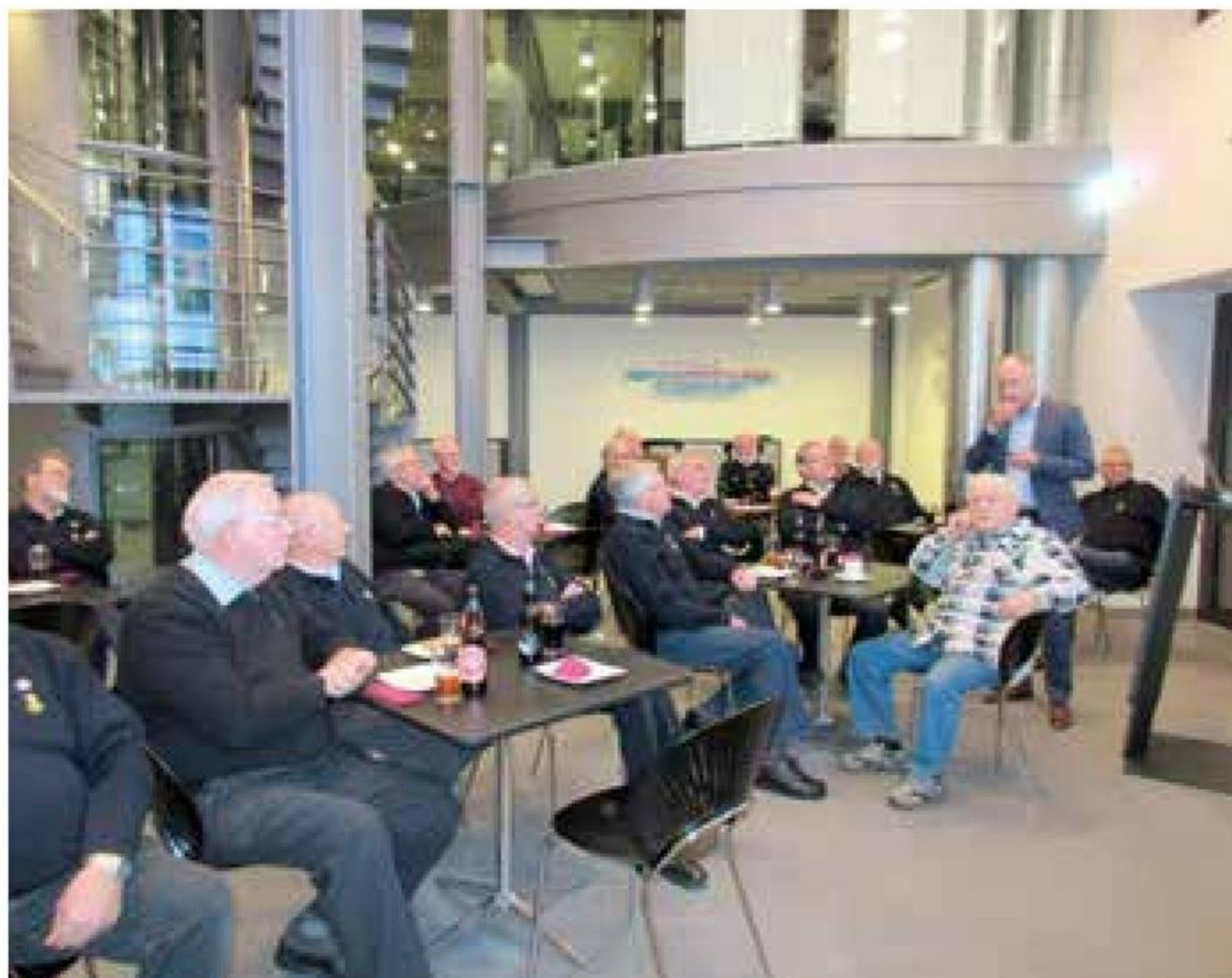
▲ Medlemmer af Middelfart Marineforening på virksomhedsbesøg i United Shipping & Trading Company's hovedkontor i Middelfart.