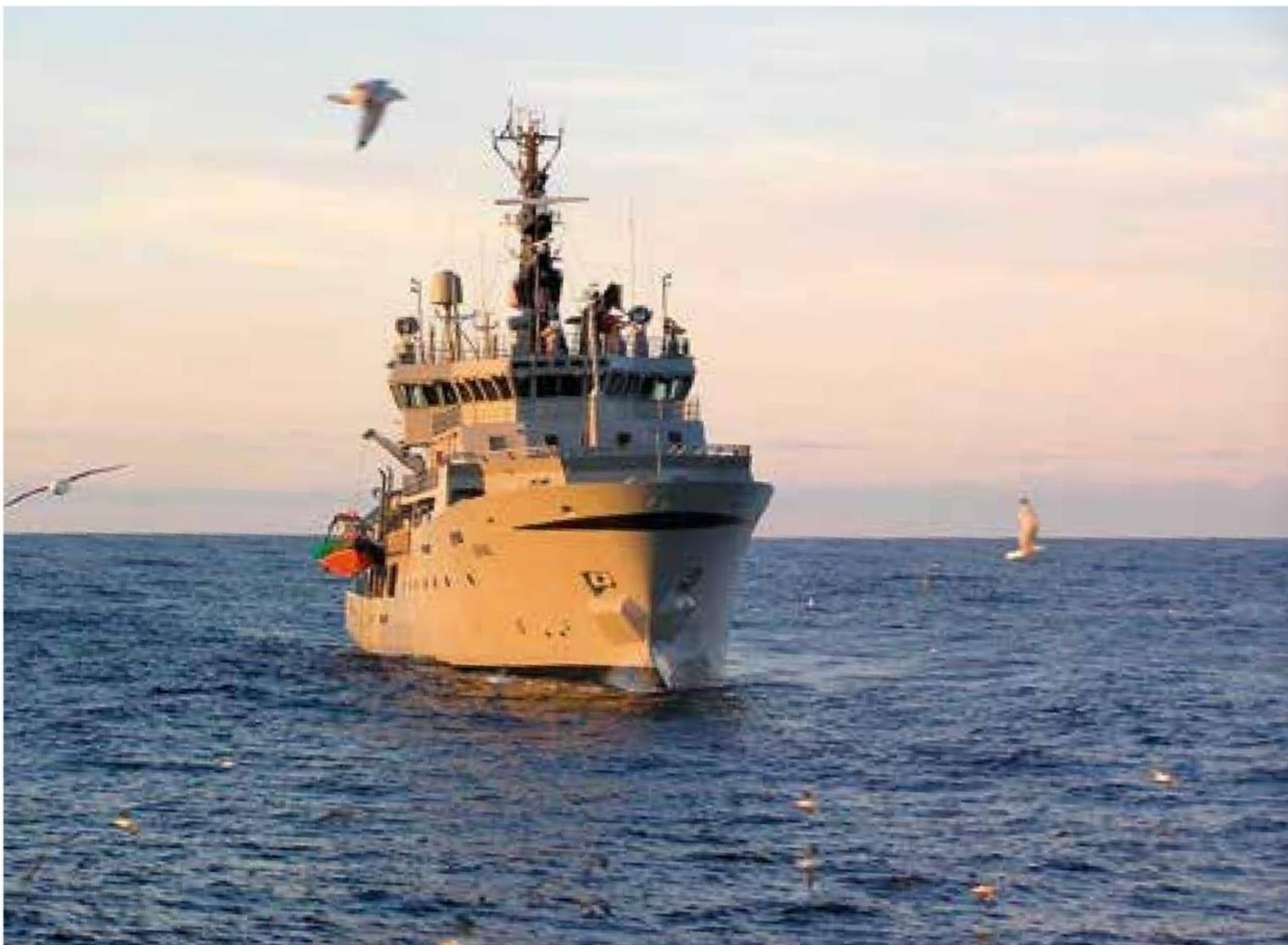
▲ Inspektionsskibet "Brimil" er den nyeste og største enhed i den færøske fiskerikontrol.

tinemæssigt. Søværnets enheder har brug for "træningsskibe", når der for eksempel skal øves "assistance til andet skib".