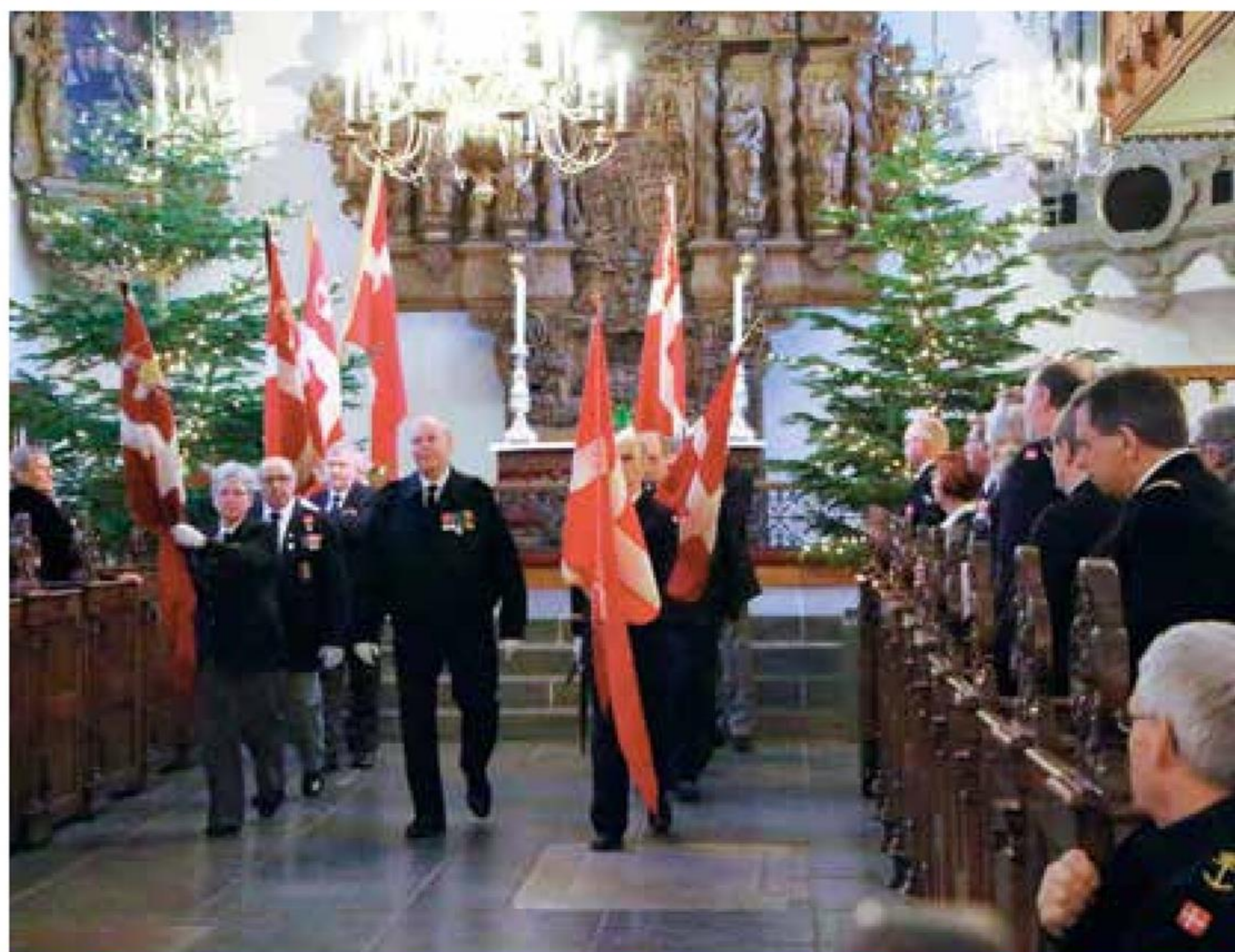
Flag og faner føres ud af Holmens Kirke.