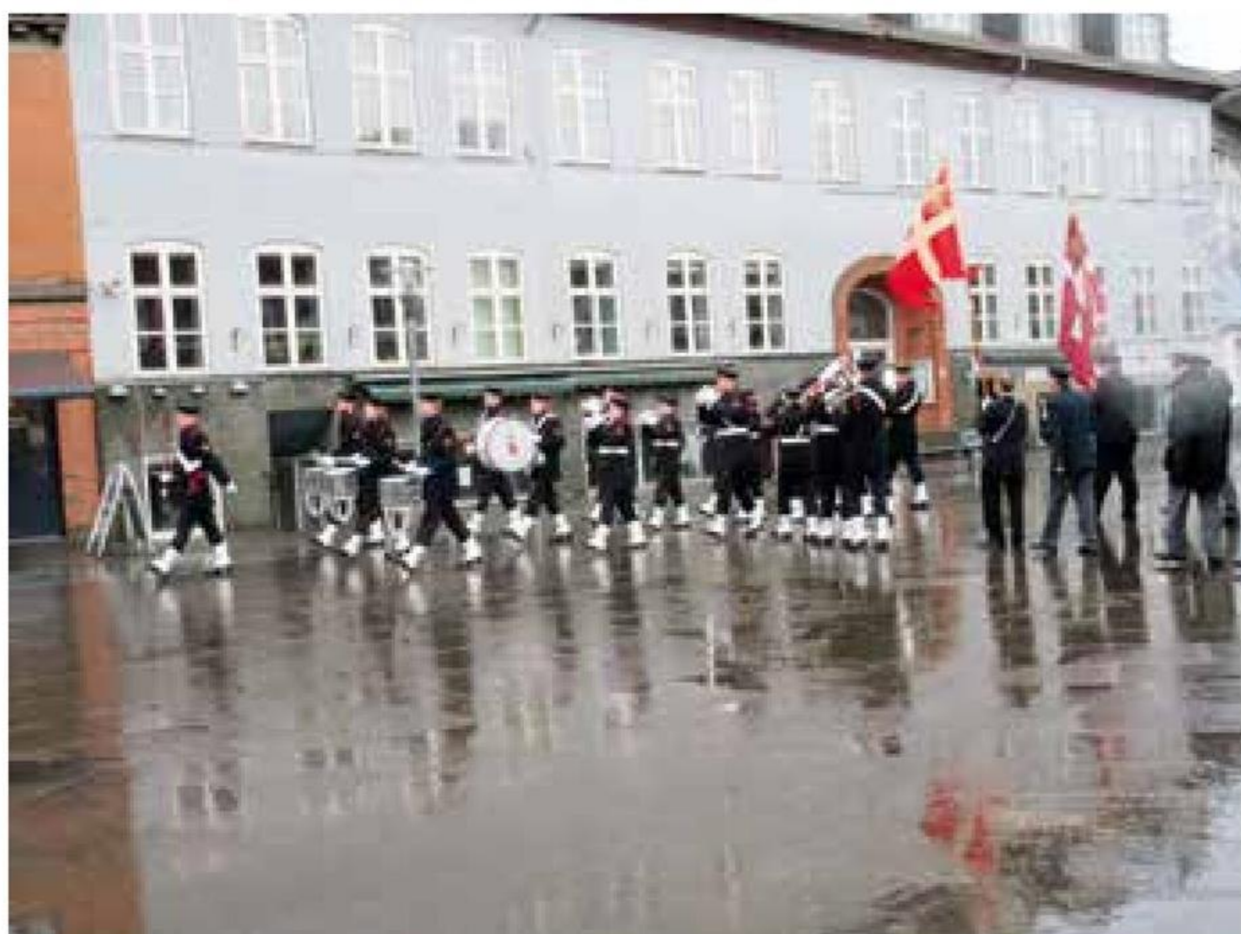
▲ Morsø Marineforening viste sammen med kollegaerne fra Fanø Marineforening flaget ved 90-års arrangementet den 24. november 2015 på gågaden i Nykøbing Mors.