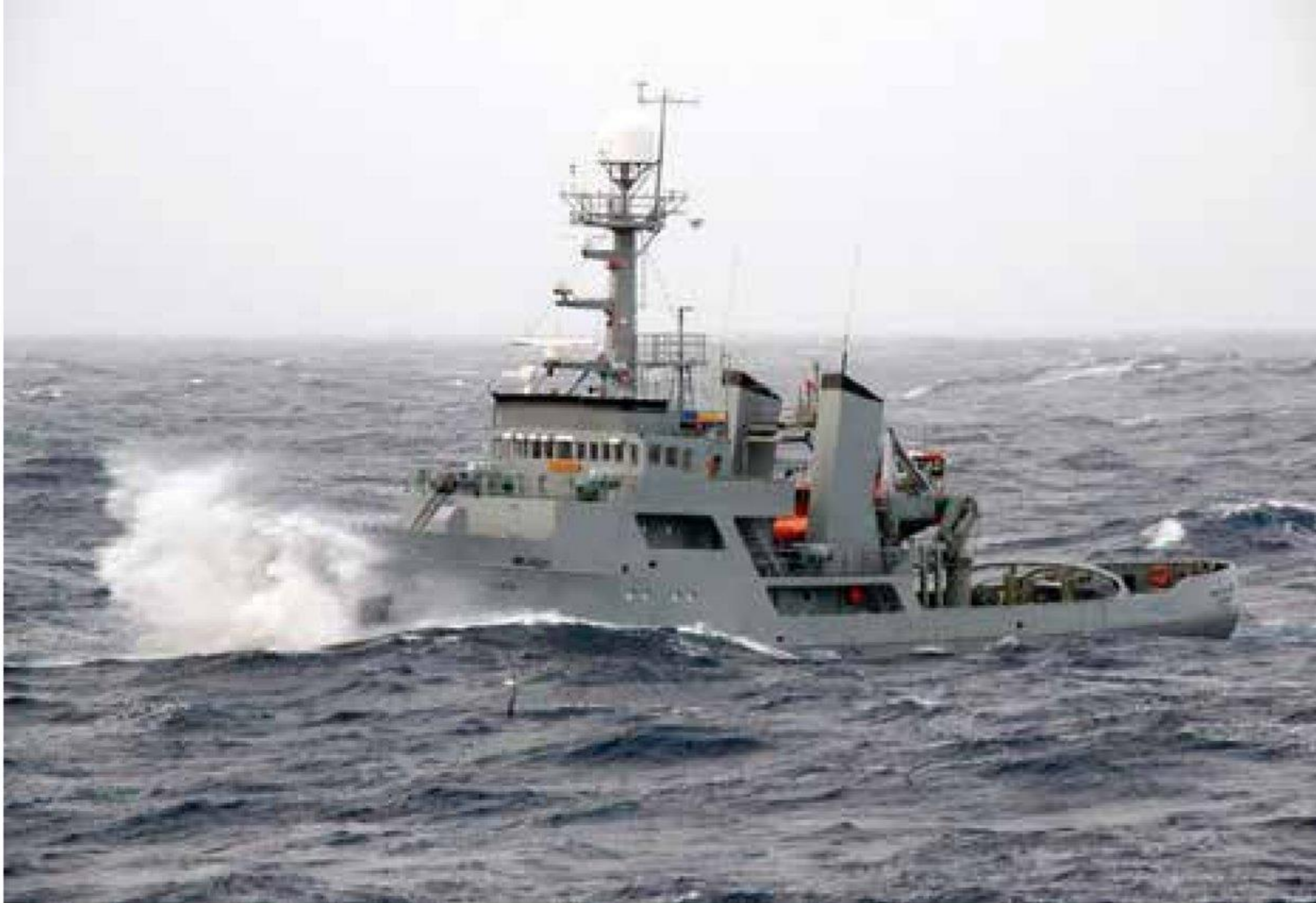
▲ Inspektionsskibet "Tjaldríð" er den første enhed til den færøske fiskerikontrol.