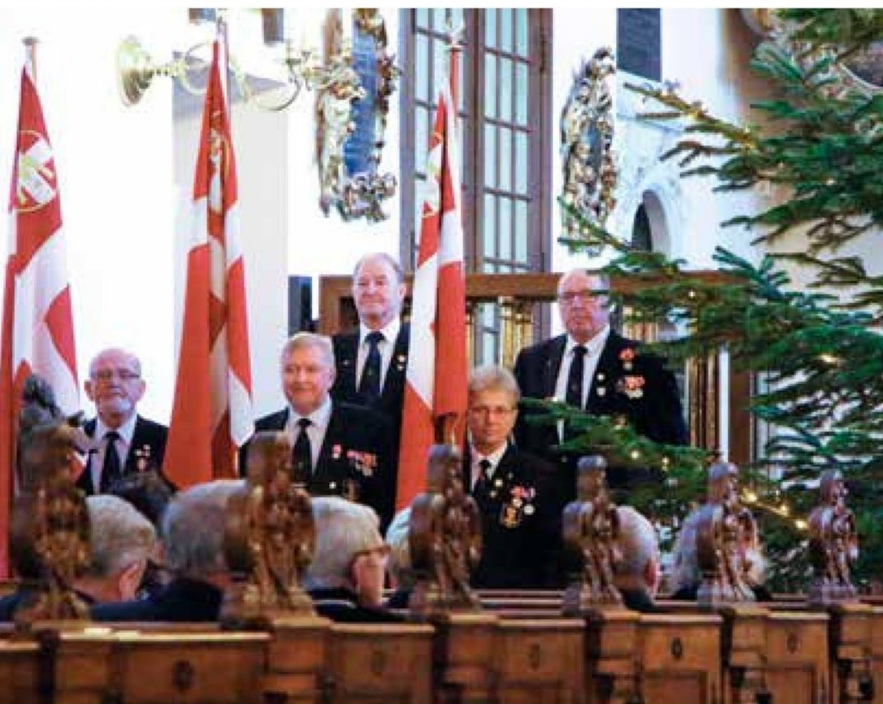
Flagvakter fra Danmarks Marineforening.