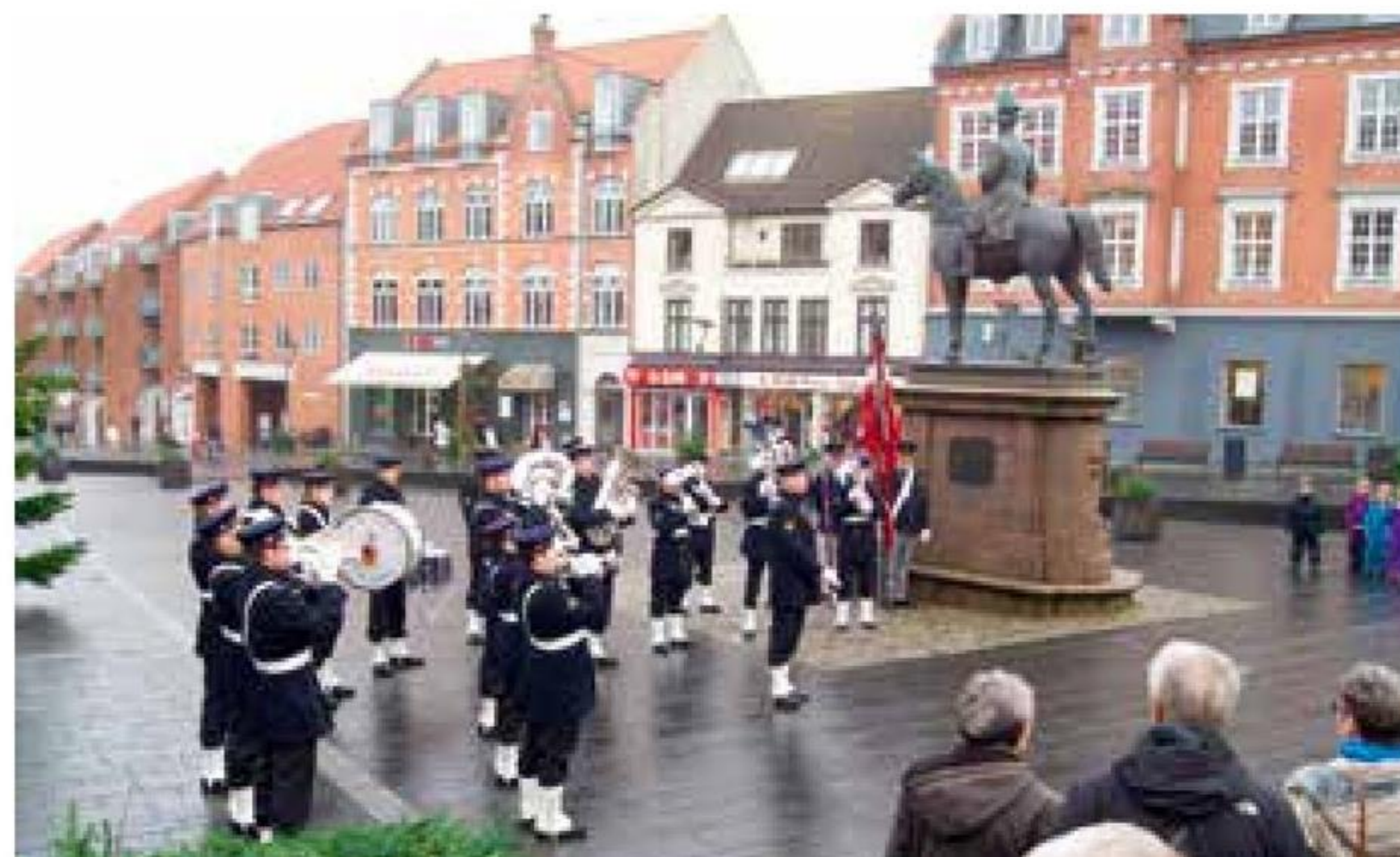
▲ Søværnets Tamburkorps giver koncert på Schweizerpladsen i Slagelse.