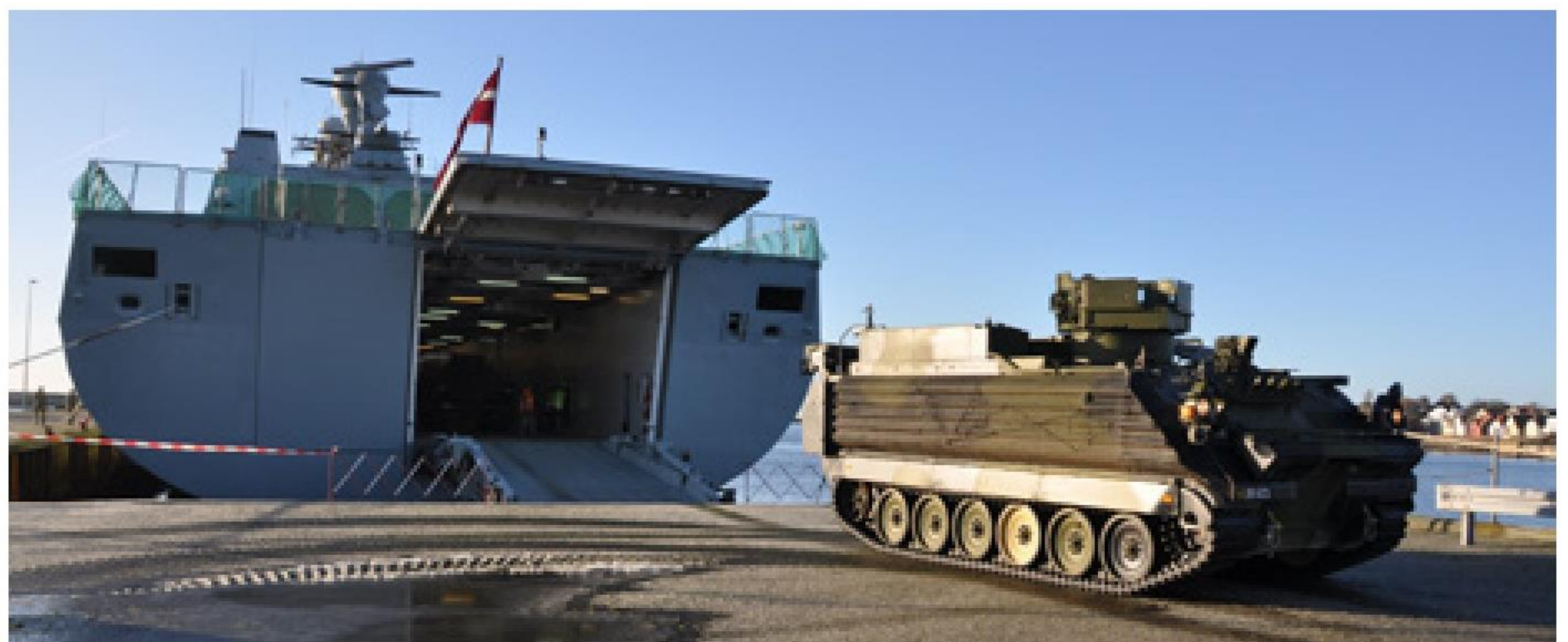
► ESBERN SNARE klar til at modtage grej og personel fra Garderhusarregimentet i Slagelse.

Ombordtagningen af køretøjerne blev gennemført på Flådestation Korsør mandag den 8. januar 2018 i et samarbejde mellem dækspersonel fra ESBERN SNARE, Garderhusarregimentet og Joint Movement Transportation. Operationen illustrerede ganske godt værnenes evne og vilje til værnsfælles samarbejde, da ombordtagningen og den efterfølgende surring af køretøjerne forløb markant hurtigere end forventet. Rent faktisk er det første gang, at ABSALON-klassen anvendes til en sådan transportopgave af Hærens køretøjer. Tidligere har det enkelte gange været afprøvet som koncept, men aldrig som en reel operativ opgave. Det er dog langt fra første gang, at ABSALON-klassen anvendes i en værnsfælles sammenhæng.