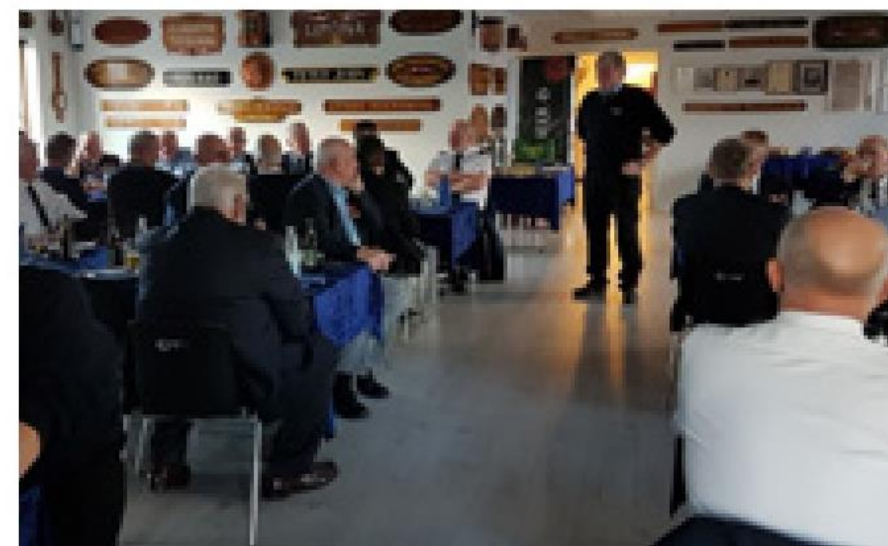
► Medlemmer fra Thyborøn Marineforening lægger krans ved mindestenen for omkomne danske søfolk der er opsat ud for Sea War Museum Jutland.