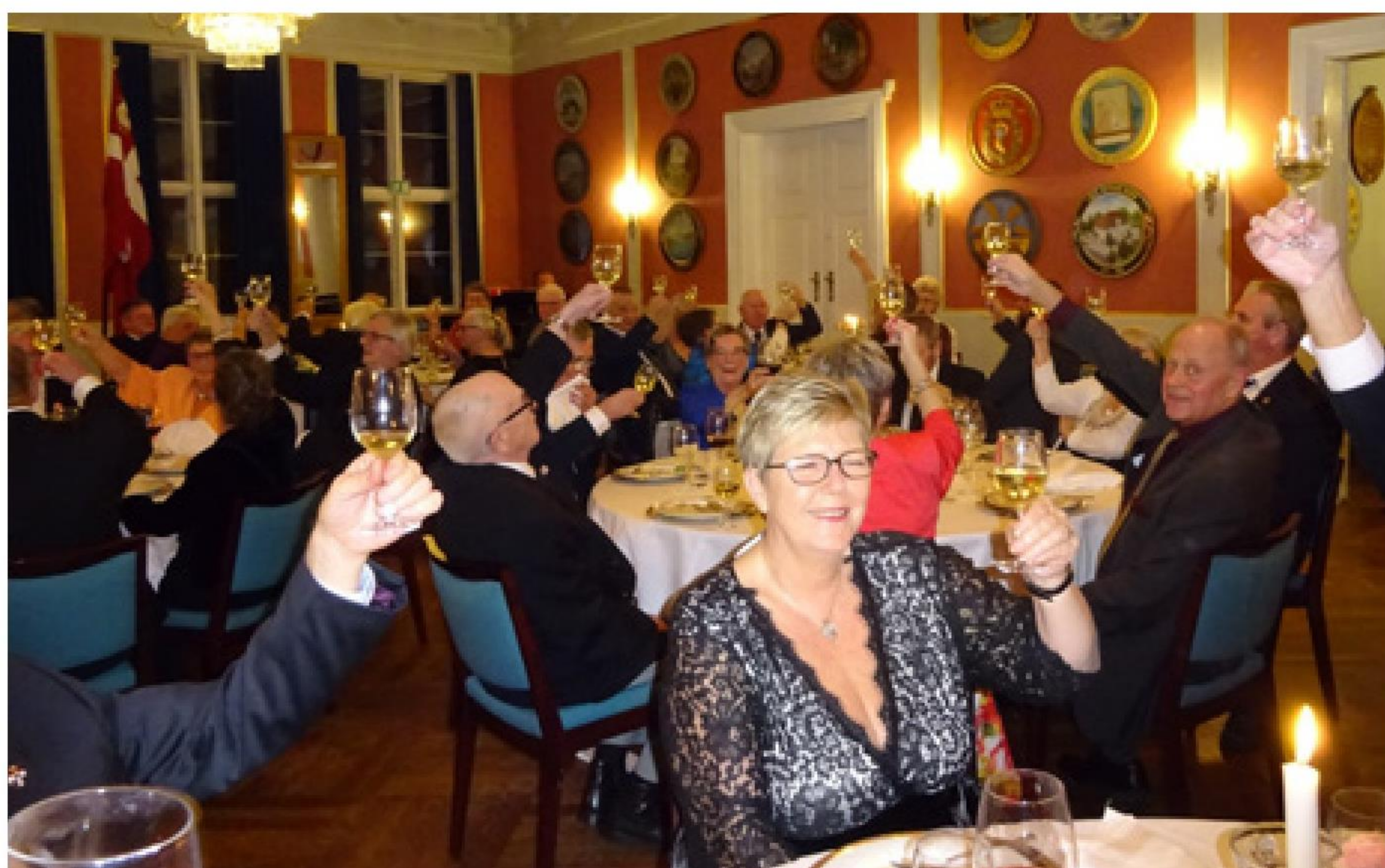
► Den afsluttende medlemsfest i Helsingørs Kongelig Privilegerede Skydeselskab's lokaler for medlemmer med ledsagere blev, som det fremgår, en ualmindelig god og vellykket afslutning på Helsingør Marineforening's 100 års festivitás.

-Lørdag den 11. november afholdt vi et brag af en medlemsfest for gaster med partnere i de historiske lokaler i Helsingørs Kongelig Privilegerede Skydeselskab. Dejligt at se de mange piger i deres flotte skrud, mange i lange kjoler. Skafningen var en tre retters menu med vin af det lumske mærke Ad Libitum, hvilket hurtigt