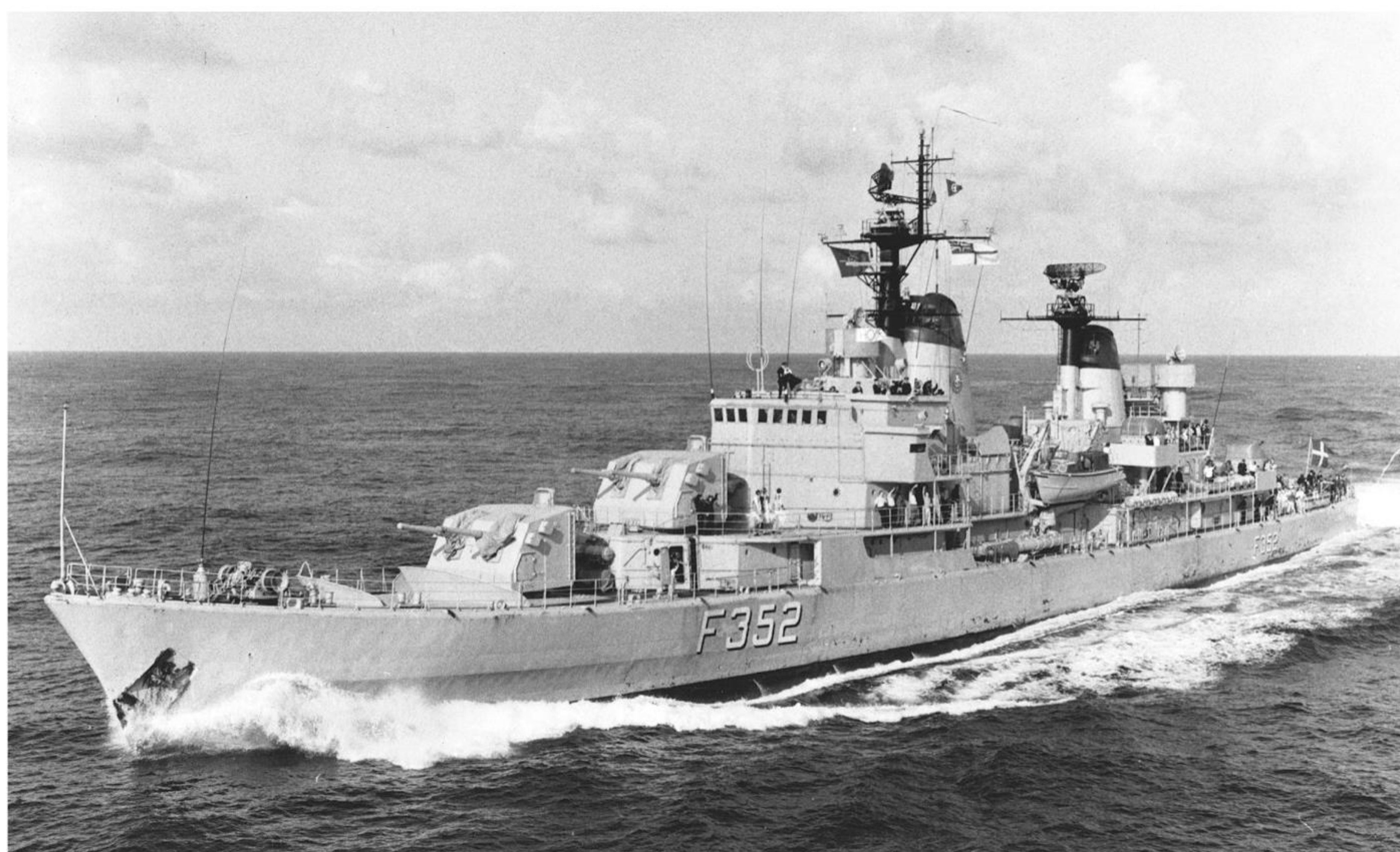
► Fregatten PEDER SKRAM. I flådens tal 1965-1988. I den brede offentlighed er skibet nok bedst kendt for missiluheldet ved Lumsås i september 1982, hvor en teknisk fejl i fregattens missilsystem medførte en affyring af et Harpoon-missil, der kort efter detonerede i et sommerhusområde ved Lumsås. Heldigvis uden at nogen kom til skade. Fregatten ligger i dag som museumsskib på Nyholm i København.

stå for denne genopbygning af flåden, og det endte med en dansk-amerikansk aftale, hvor USA forærede Danmark 22 orlogsskibe til en samlet værdi af 300 mio. kr.