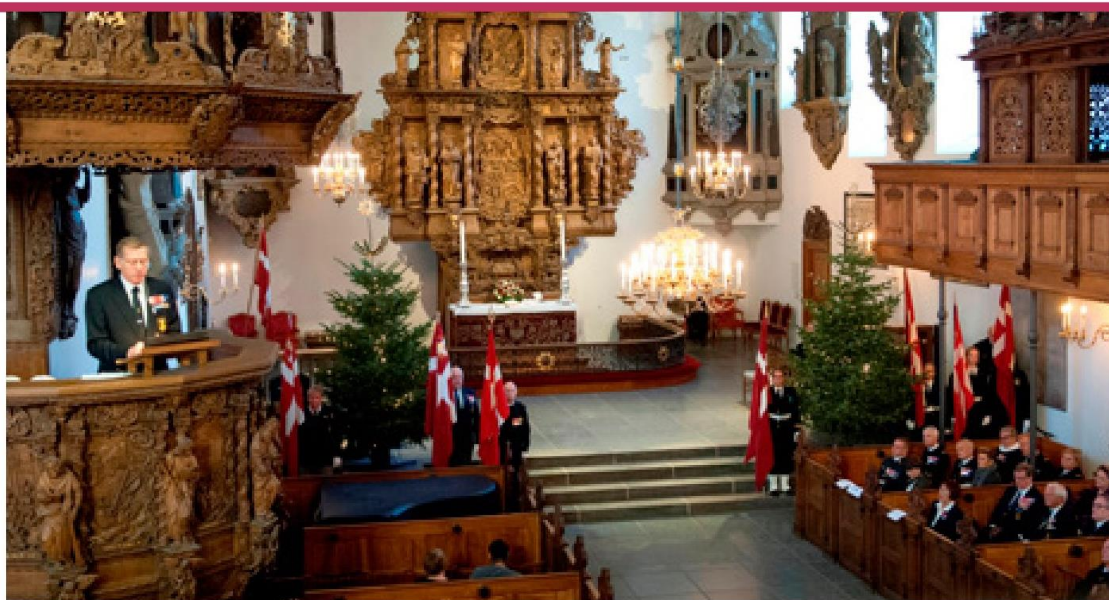
► Holmens Kirke danner en smuk ramme om Marinehjemmeværnets nytårsgudstjeneste.