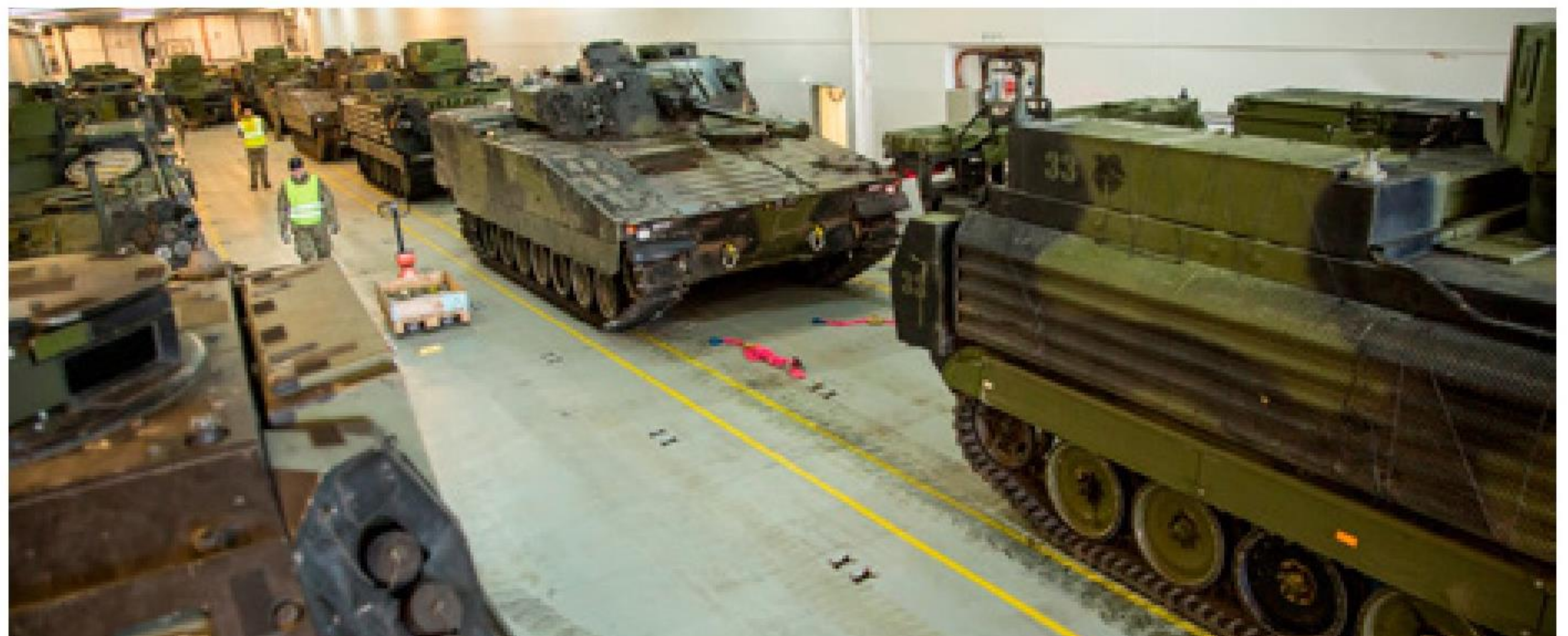
► De 15 køretøjer fylder godt på de 900 kvm flexdæk.

Hver gang SEAHAWK-helikopteren er om bord på skibet, er der også tale om en værnsfælles opgave, idet helikopteren er fra Flyvevåbnet.