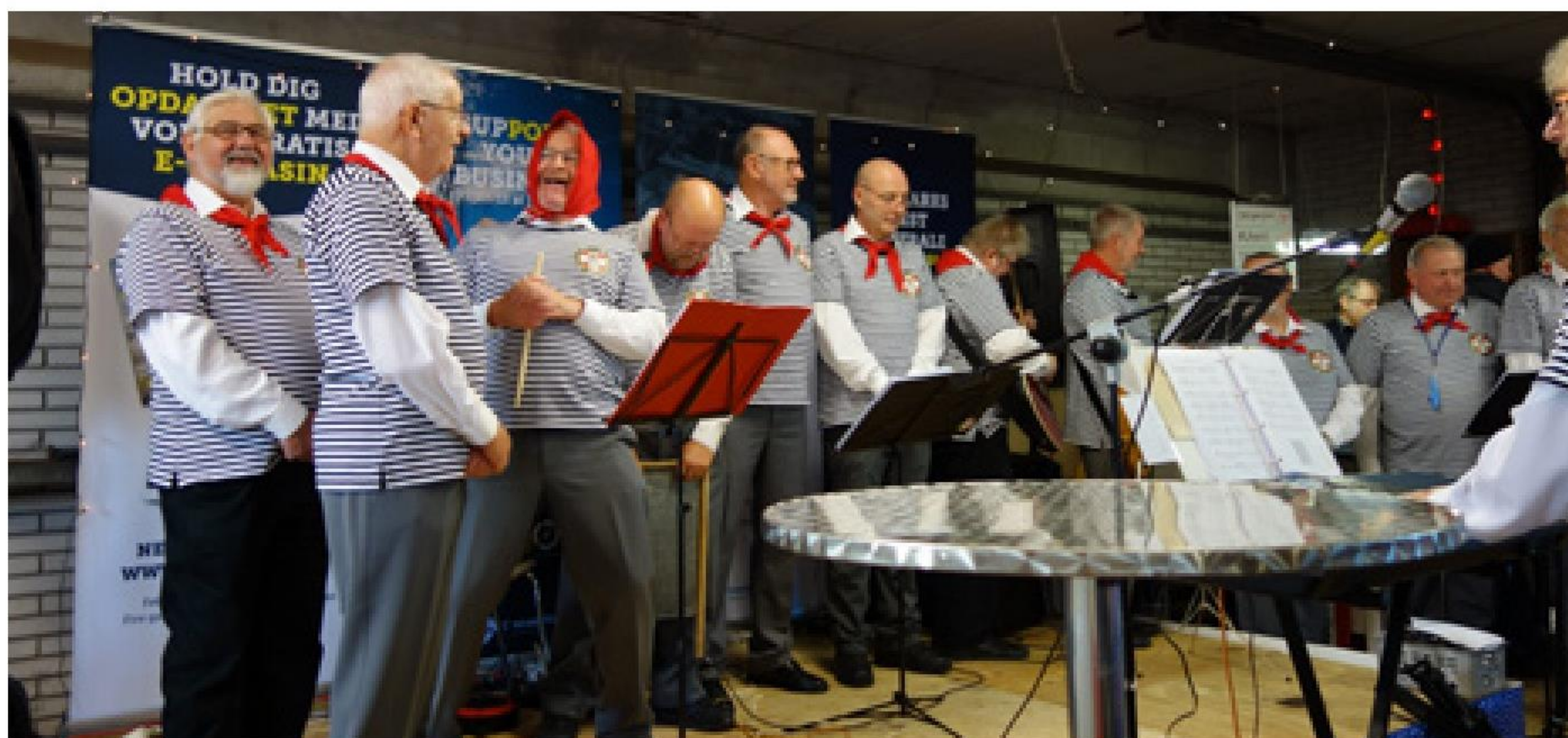
► Den veloplagte besætning i Grenaa Marineforening's sangkor gav den på alle tangenter ved afdelingens julemarked i Fiskernes Bødehal i november.

Nytårskuren 27. december var velbesøgt, så nu ser bestyrelsen frem til generalforsamlingen primo 2018, hvor der blandt andet skal bydes velkommen til tre nye medlemmer.