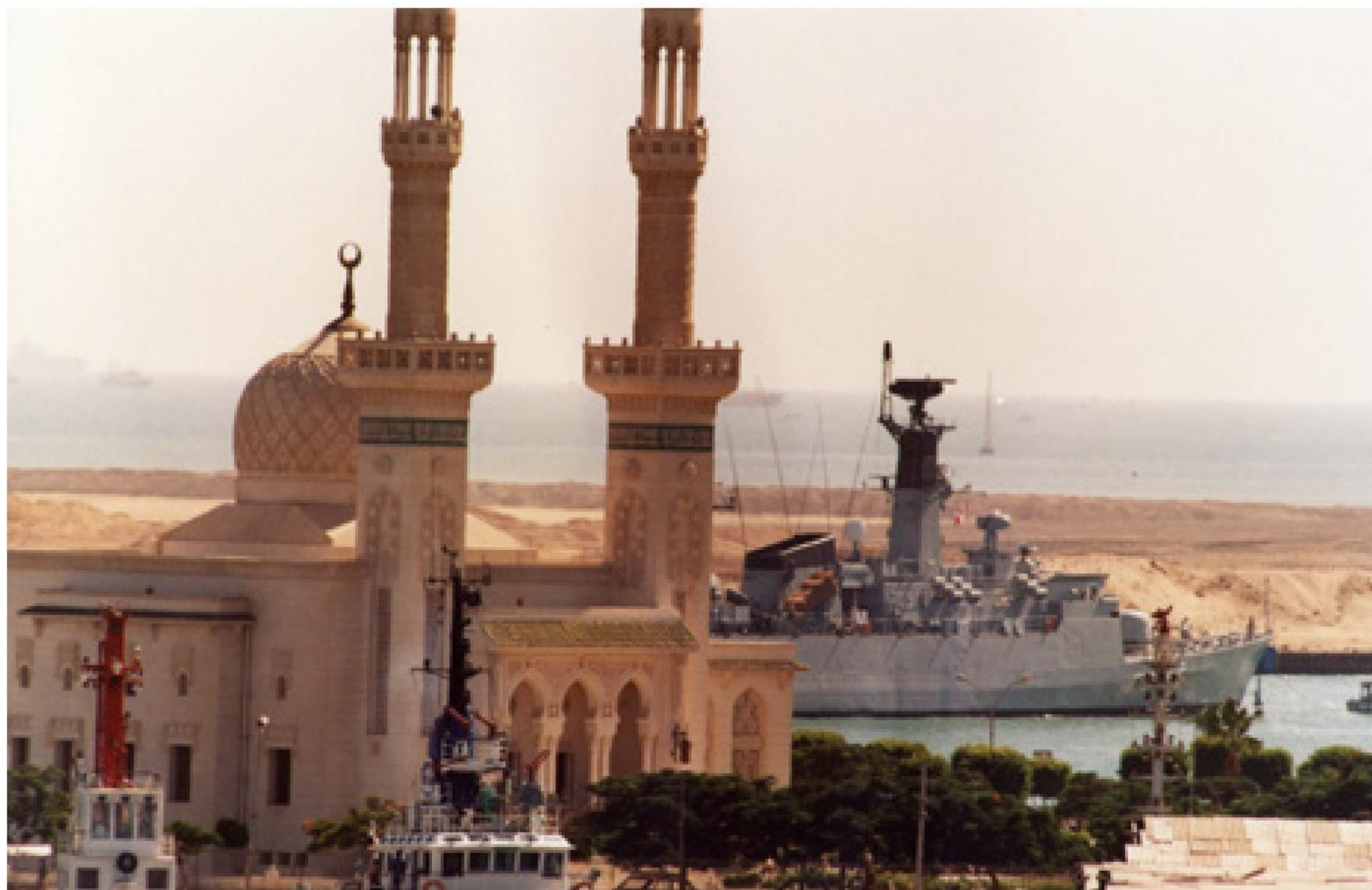
► Korvetten OLFERT FISCHER i Suezkanalen på vej til Den Persiske Golf i 1990. Et ikonisk fotografi, der tydeligere end noget andet illustrerer Søværnets ændrede vilkår efter den kolde krigs ophør. Korvettens succesfulde deltagelse i FN-operationen i 1990-1991 spiller en central rolle for Søværnets selvforståelse, der siger, at succesen banede vejen for den aktivistiske danske udenrigspolitik, som blev realiteten efter Berlinmurens fald.