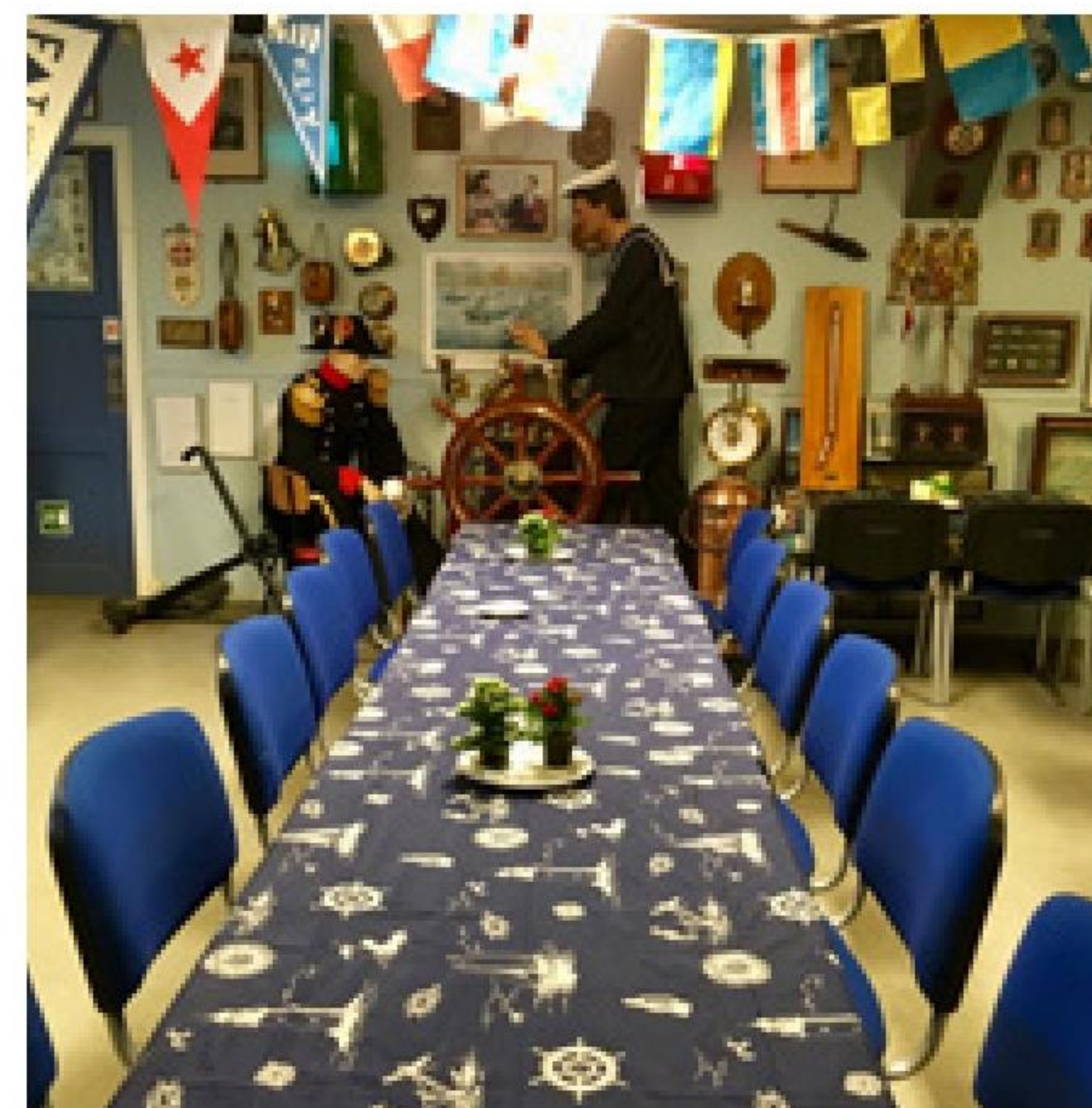
▶ Det lykkedes at få et sjældent "tomt" foto af Københavns marinestue, som ellers er velbesøgt af mange arrangementer og møder, med de nye, marineblå stole.

Med kammeratlig hilsen samt vor dybeste respekt. "Æret være Allans minde". Bestyrelsen Godthåb Marineforening.