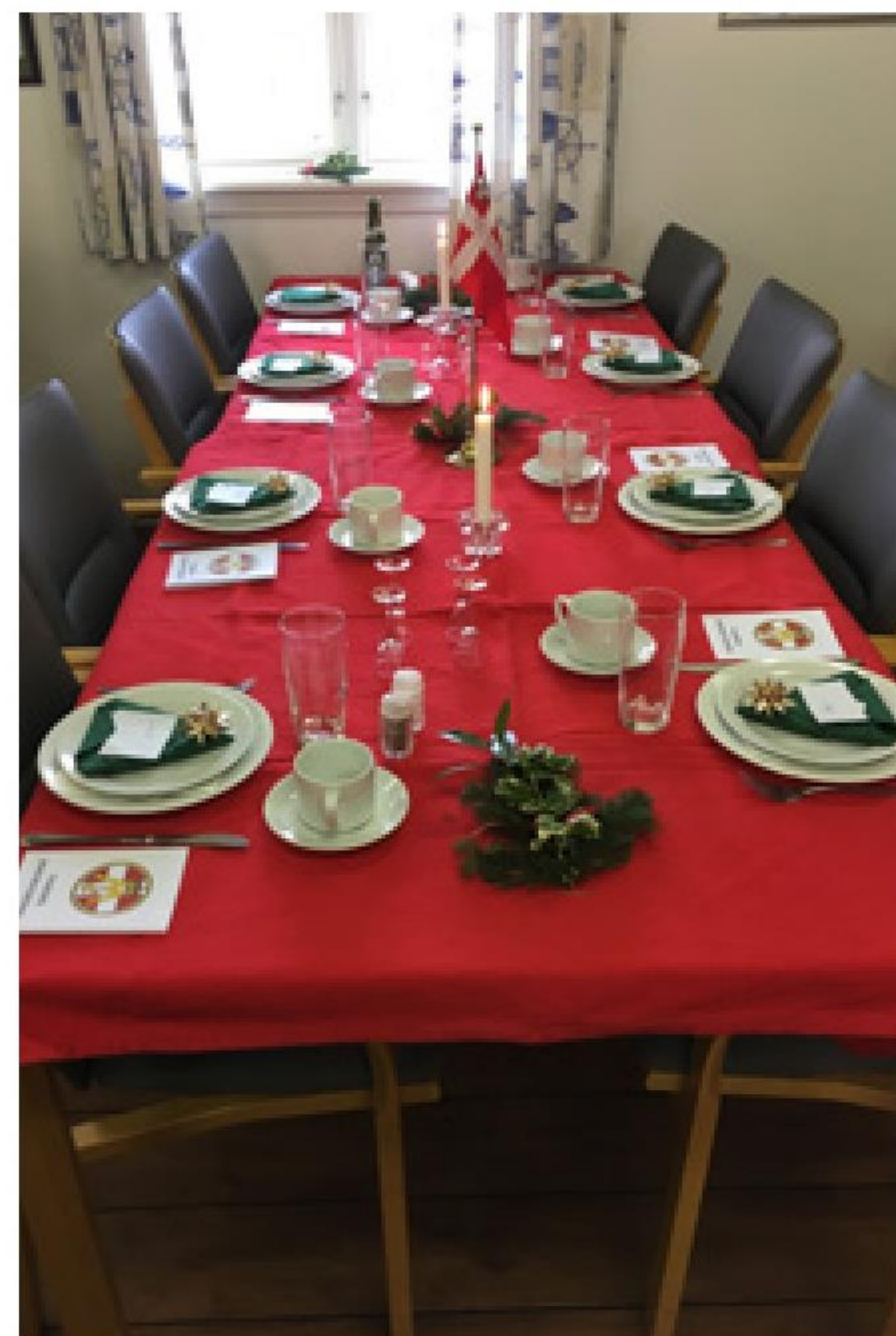
► Den 2. december stod den på julefrokost ved pyntede juleborde i marinestuen i Faaborg

Julelotteriet med indsamlede gevinster gav et pænt overskud til afdelingskassen. Fra bestyrelsen er der en stor tak til alle, som gav en hånd med oprydning og opvask.