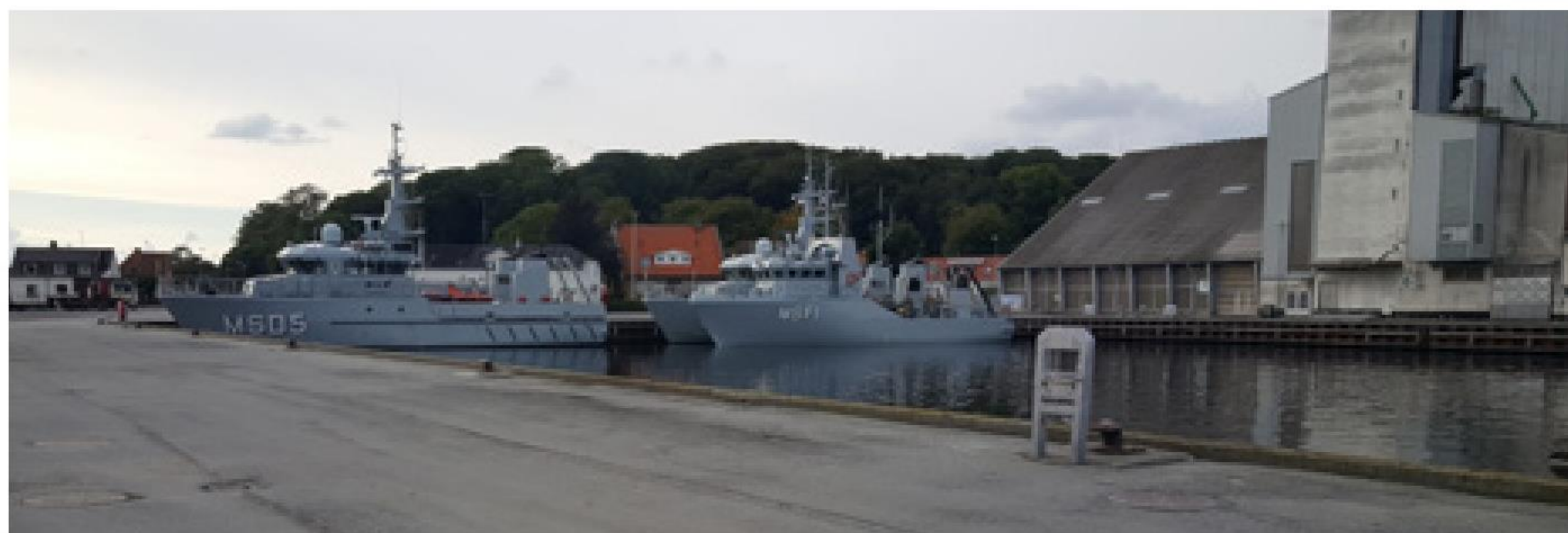
► MSD 5 HIRSHOLM samt MSD 6 SALTHOLM med minerydningsdronefartøjet MSF 1 på bagbord side under september besøget i Skive Havn.

På det faglige område har Skive, som flere andre Limfjordsbyer, haft besøg af de tre enheder fra Søværnets minerydningsenhed MCM Danmark, der i september i forbindelse med adoptionsbesøget i Lemvig Kommune, var på